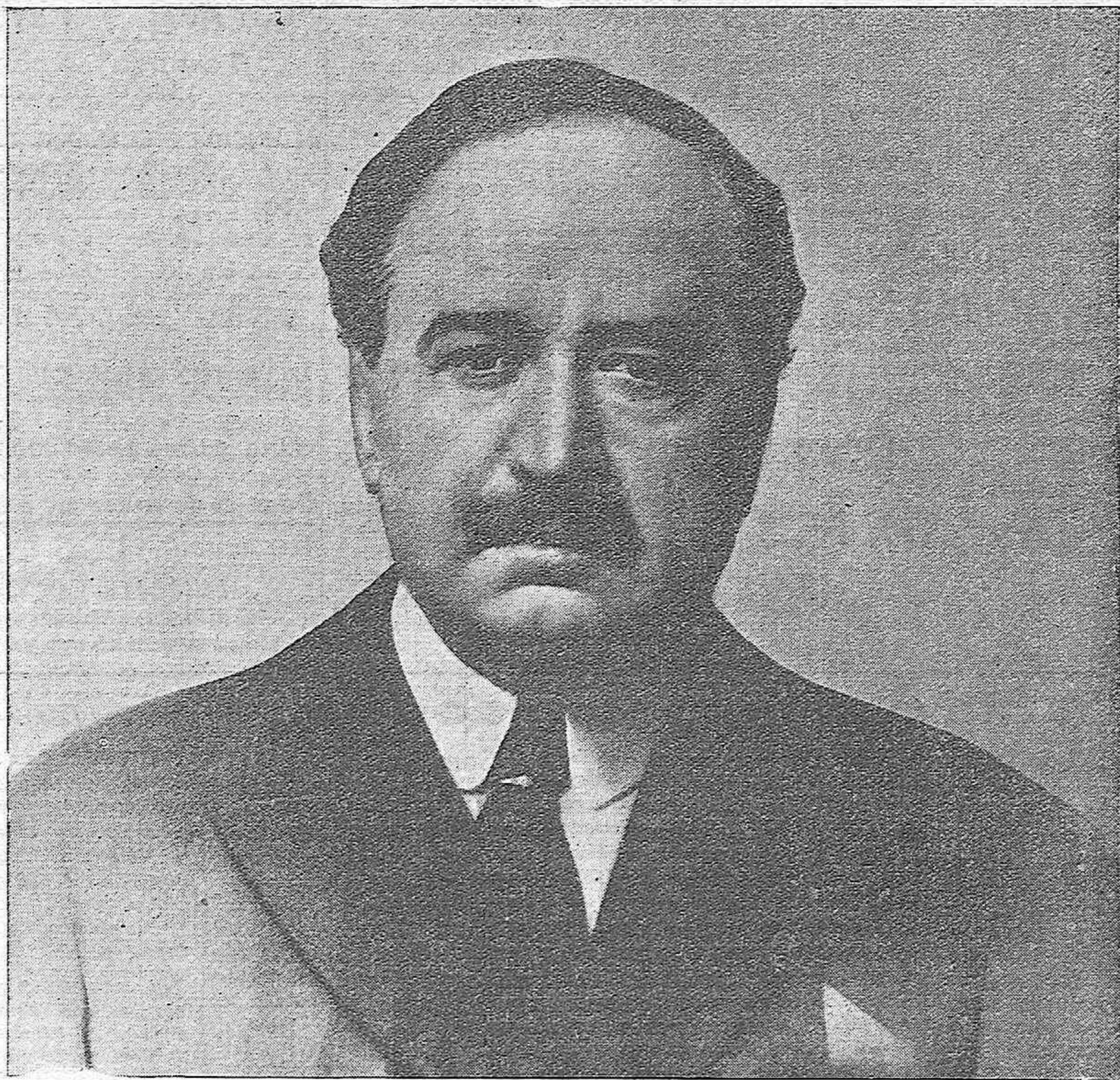
FIGURA MAGNIFICA Y VIDA FECUNDA QUE ESPAÑA PERDIÓ PARA SIEMPRE HACE HOY CUATRO AÑOS, A QUIEN LAS CORTES CONSTITUYENTES DE LA REPUBLICA ESPAÑOLA, DANDO UN ALTO EJEMPLO DE SENSIBILIDAD CIUDADANA Y RECOGIENDO EL ESPIRITU DE LA DEMOCRACIA NACIONAL QUE EL CONTRIBUYO A FORMAR, RINDEN EN ESTE DIA UN FERVOROSO HOMENAJE DE ADMIRACION ANTE LA TUMBA DEL INSIGNE REPUBLICANO QUE DUERME EN MENTON