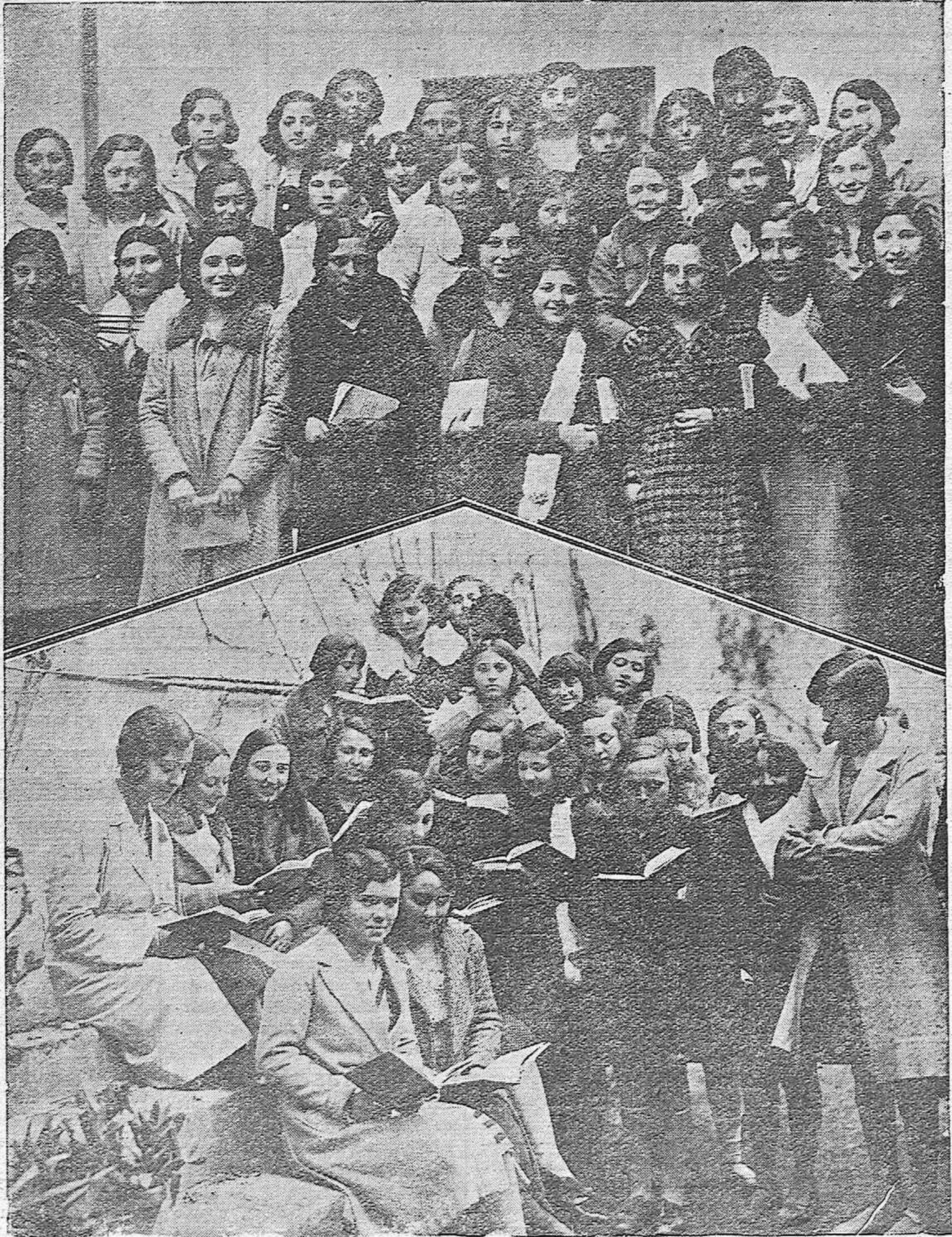
LA JUVENTUD ESTUDIOSA DEL PORVENIR.—Grupo de encantadoras estudiantes de Bachillerato, en un descanso entre las clases posan en el jardín del Instituto.—Las más aplicaditas aprovechan los momentos de ocio para el repaso de sus lecciones.