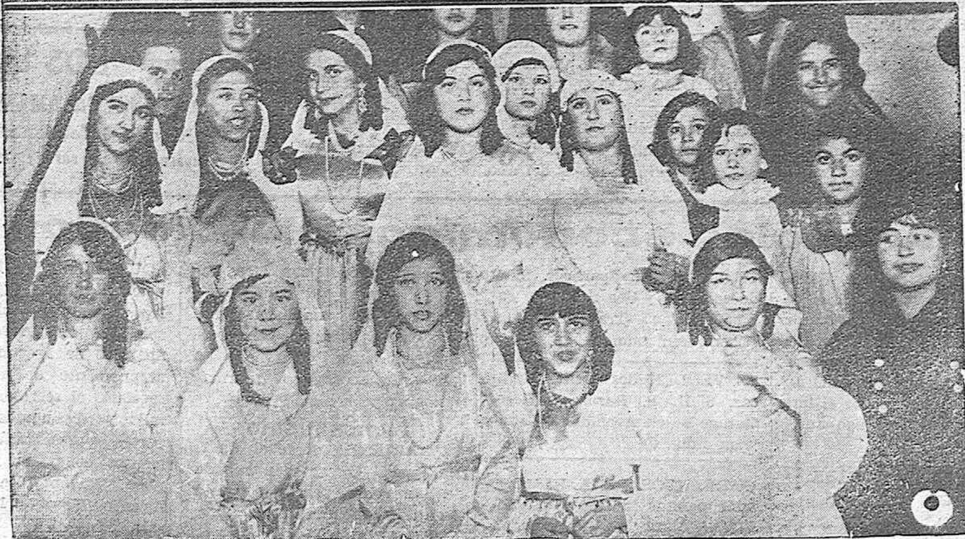
LA CABALGATA DE LOS MAGOS.—Melchor, Gaspar y Baltasar, los tres Magos de Oriente, distribuyendo la preciosa carga de juguetes entre los acogidos en la Casa de Expositos.—Lindisimas odaliscas que figuraban en la brillante comitiva.