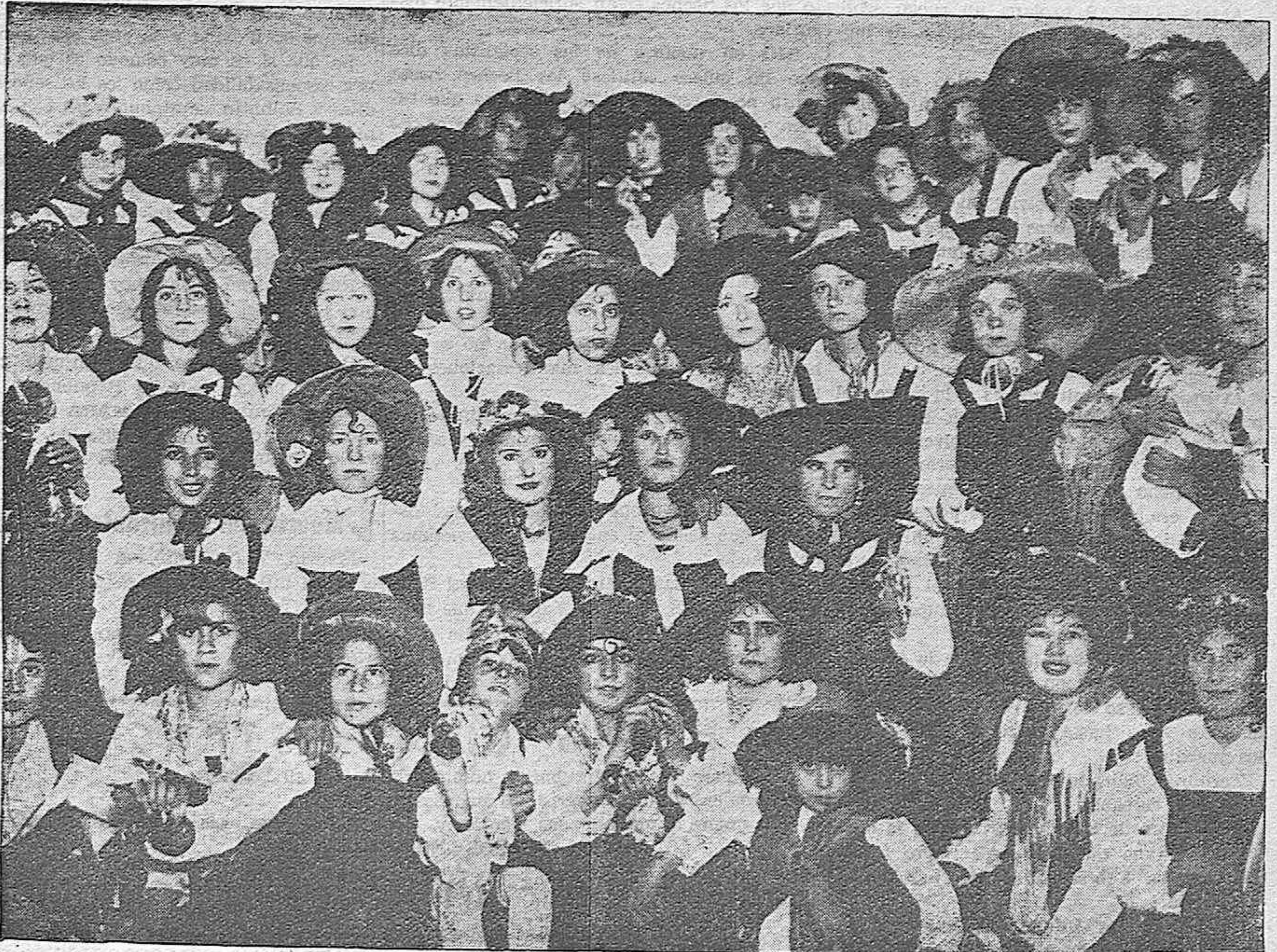
LA CABALGATA DE LOS MAGOS.—Grupo de pastoras, que formó parte de la vistosa cabalgata celebrada el martes y que constituyó un éxito para sus organizadores.