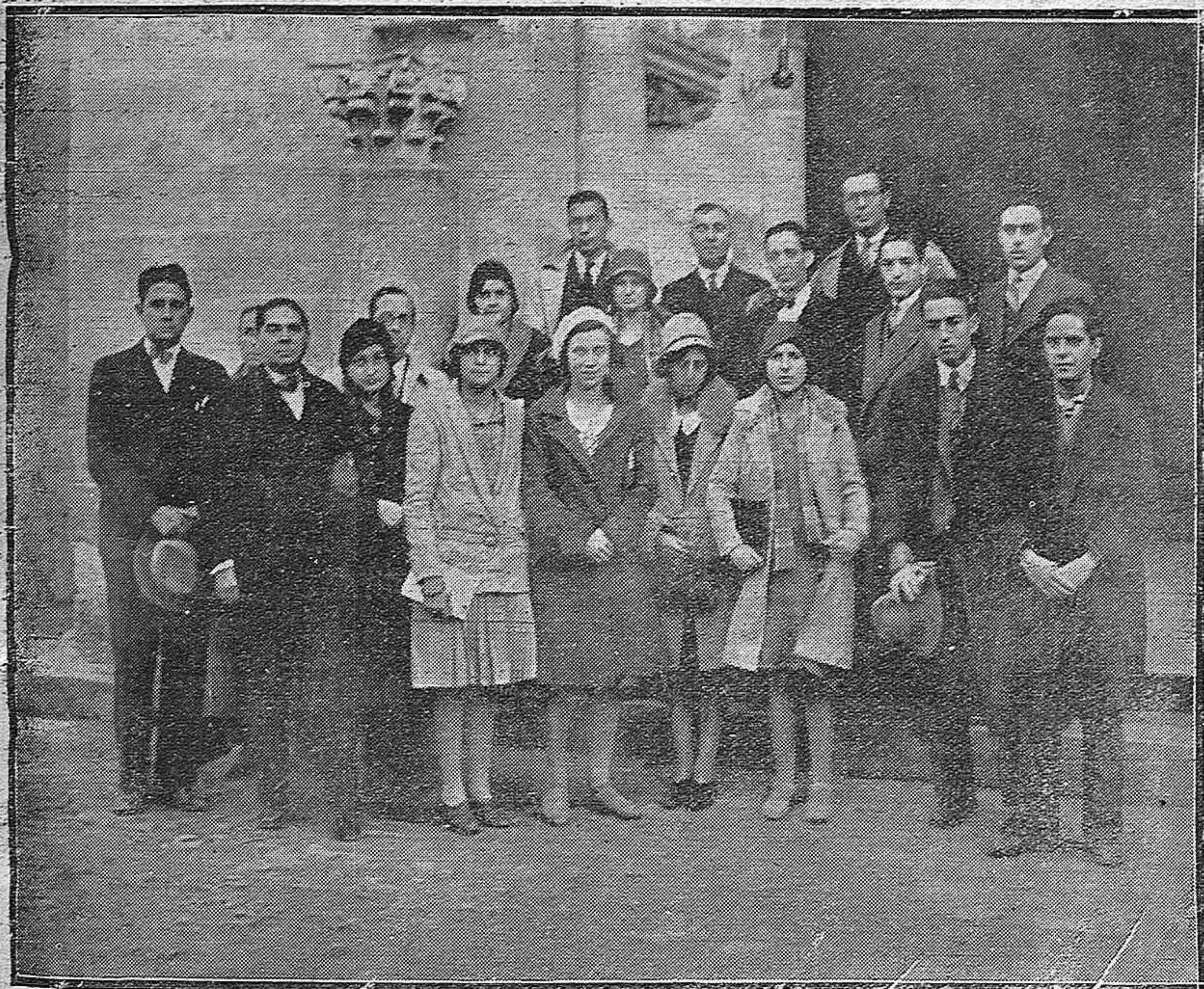
Profesores y alumnos del Instituto de Segunda Enseñanza de Tarragona, que acaban de llegar a esta capital en viaje de estudios. — Los excursionistas al salir de la Mezquita.