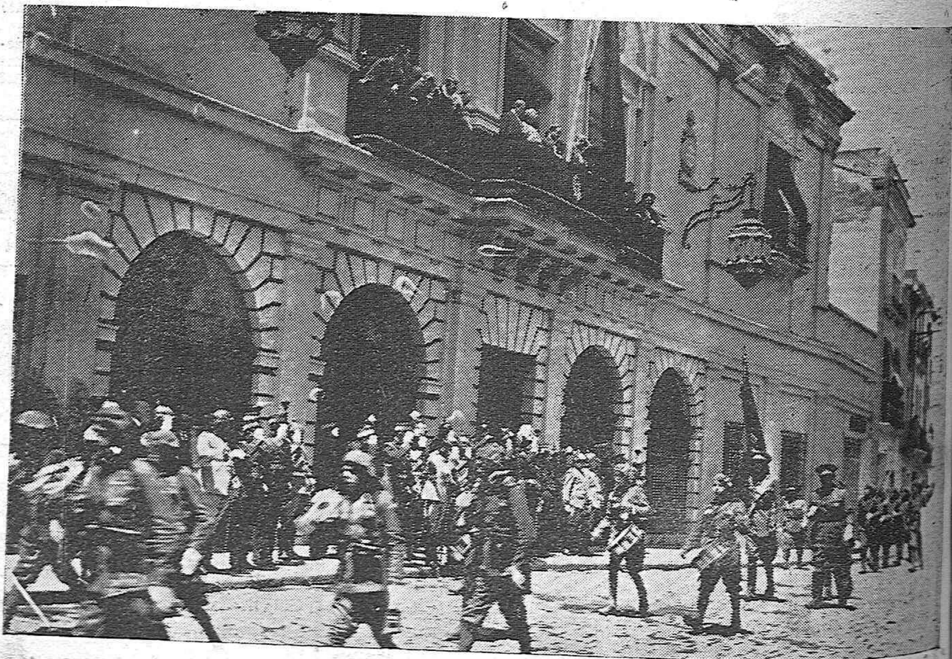
EL CUMPLEAÑOS DE S. M.—LAS AUTORIDADES EN EL BALCÓN DEL AYUNTAMIENTO, PRESENCIANDO EL DESFILE DE LA COMPAÑÍA, DESPUÉS DEL ACTO CELEBRADO ESTA MAÑANA.

ALTO: para medias, calcetines y camisetitas de verano, la casa más surtida y de precios más afinados, es El Metro y sus Sucursales.