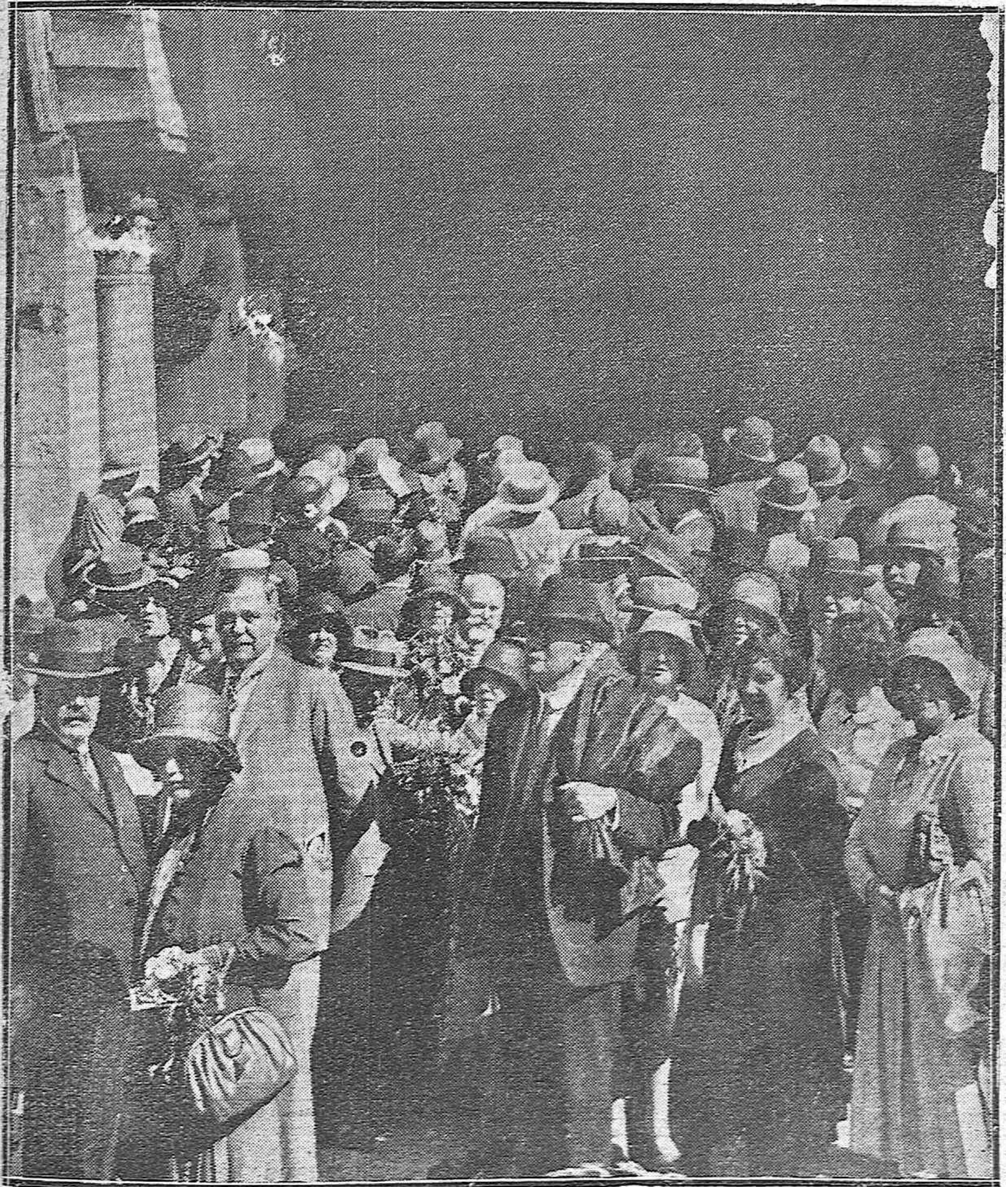
MIEMBROS DEL CONGRESO INTERNACIONAL DE FERROVIARIOS, QUE ACABAN DE LLEGAR A NUESTRA CAPITAL.