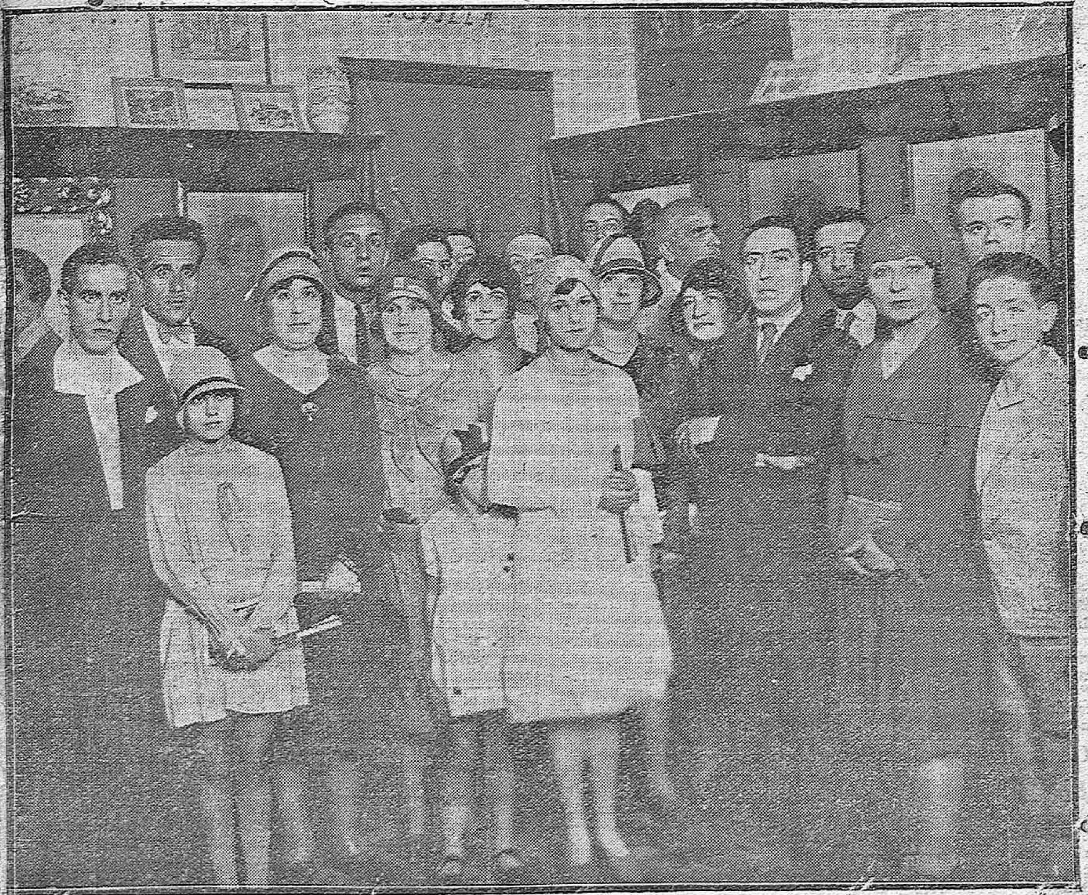
Inauguración oficial de los originales dibujos presentados por el notable artista León Astruc.