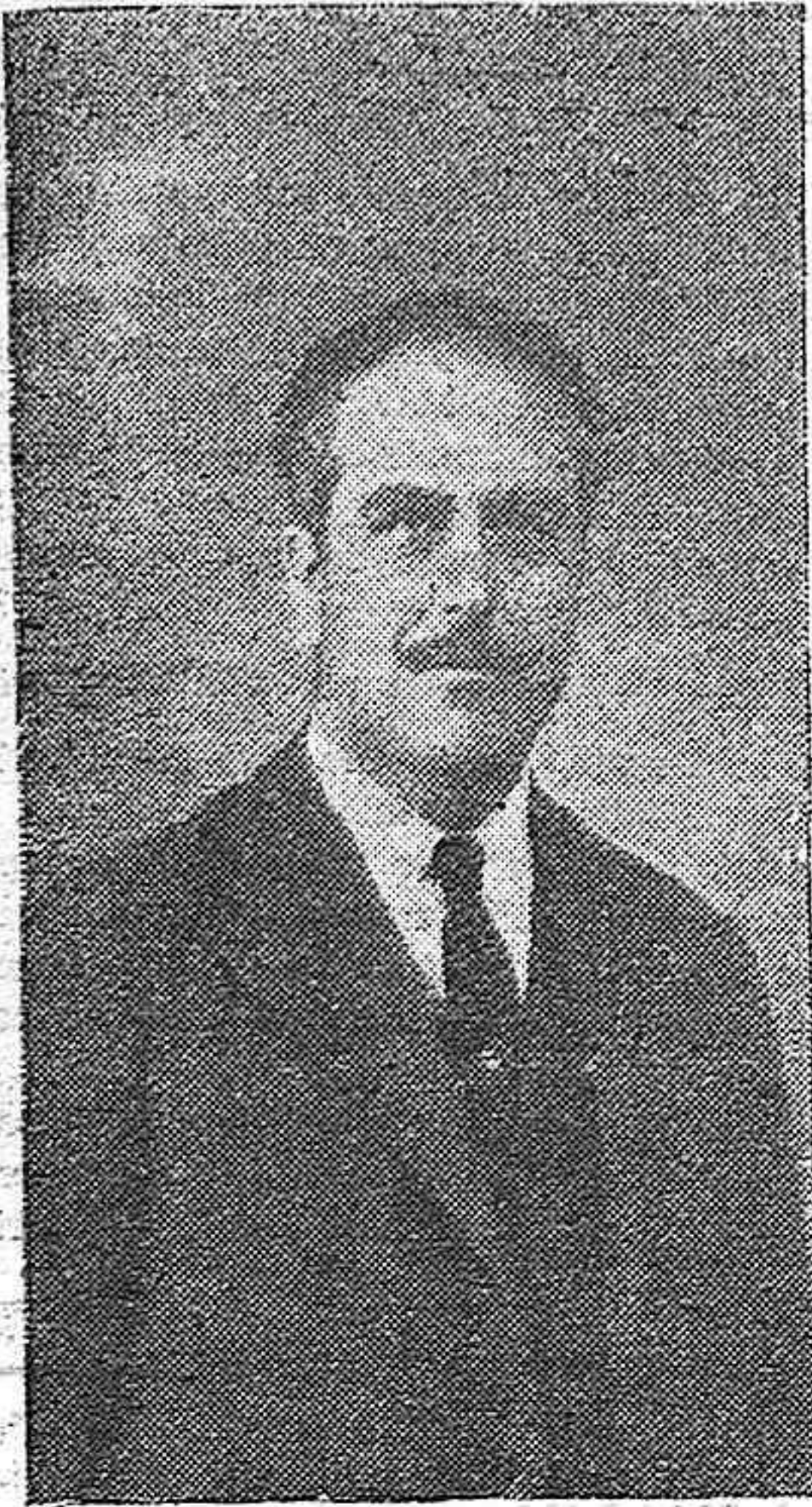
El profesor don Eloy Vaquero Cantillo, alcalde popular de Córdoba, cuyo nombramiento ha sido excelentemente acogido.