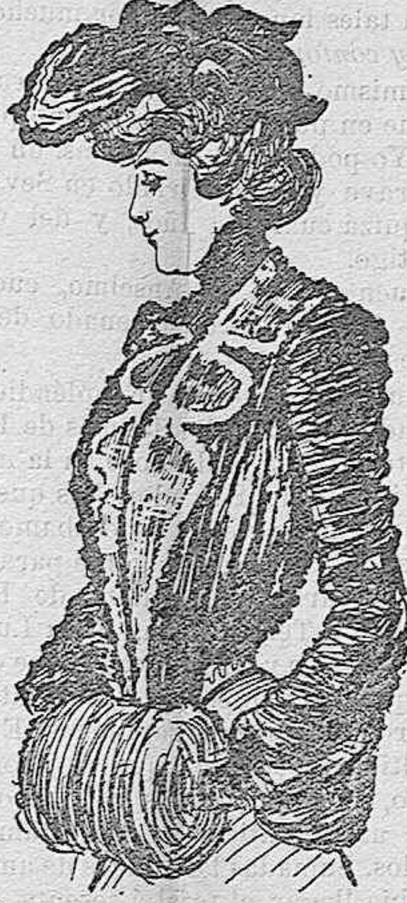
Cuerpo blusa para paseo.

Se confecciona este cuerpo con terciopelo, color verde oscuro, con cuello y solapas de encaje; alrededor del cuello una pasamanería del mismo color que el cuerpo.