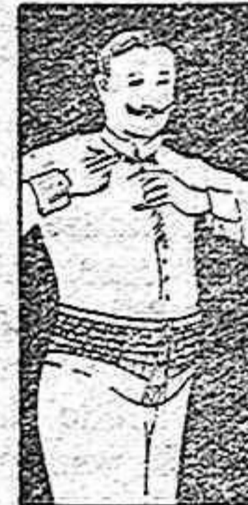
FAJA DE CABALLERO