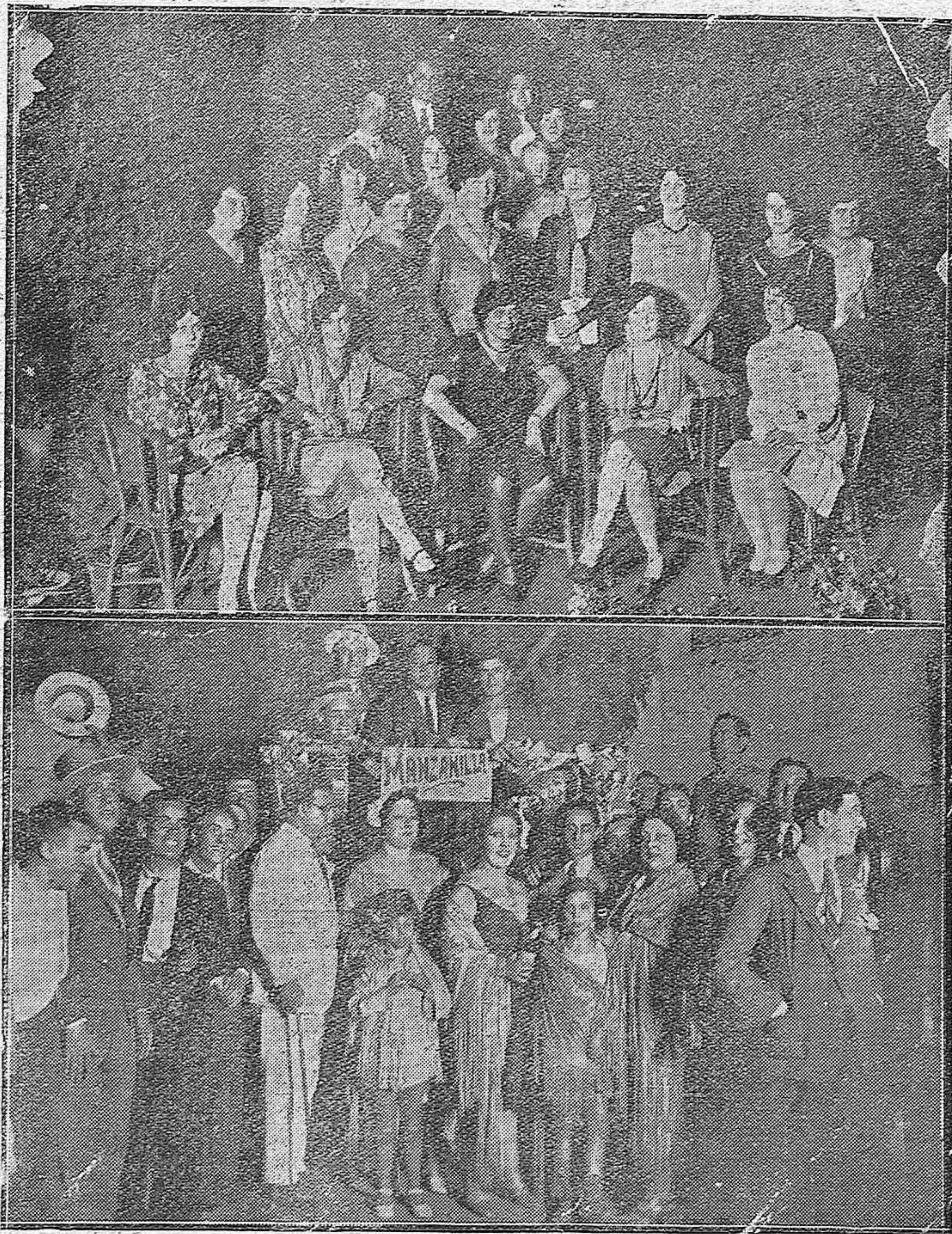
NOTAS GRÁFICAS DE ACTUALIDAD.—Profesores y alumnas del Instituto de “Las Españas”, de Nueva York, que acaban de llegar a Córdoba en viaje de estudios.—Uno de los puestos; servido por lindas señoritas, en la verbena celebrada anoche en el Teatro de San Lorenzo.