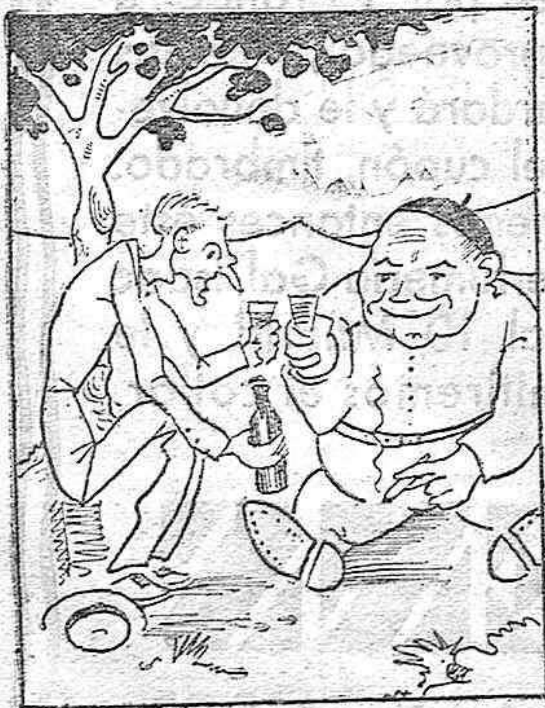
Bebe el pobre y bebe el rico.