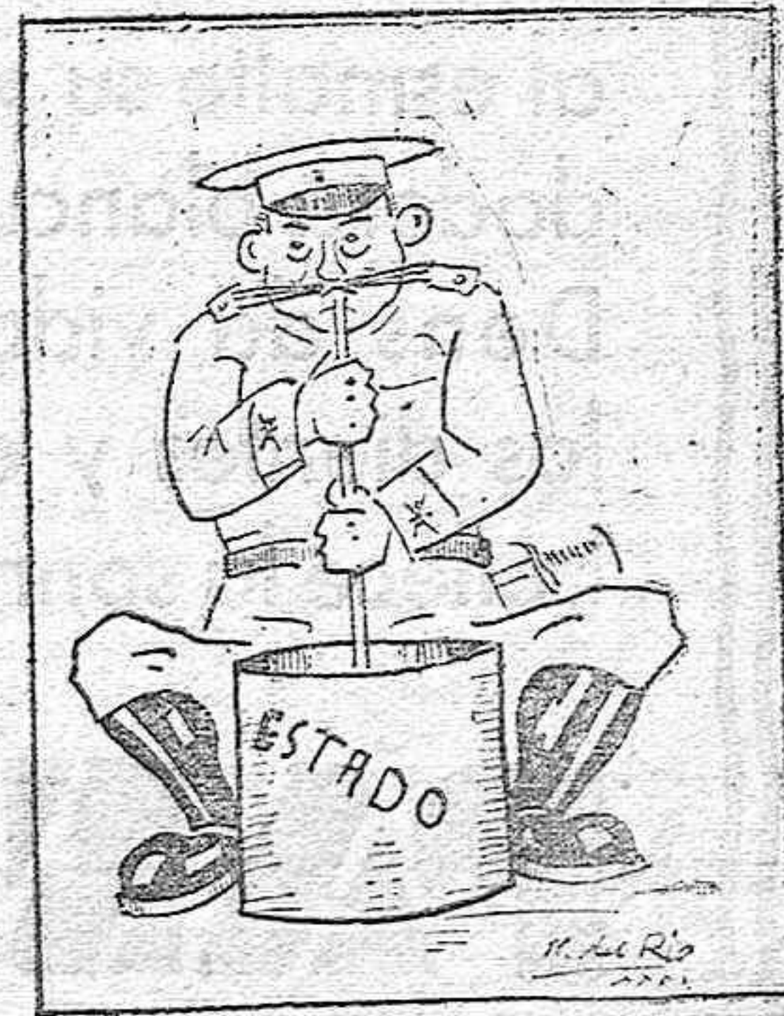
Pero este no bebía que "chupaba del estao."