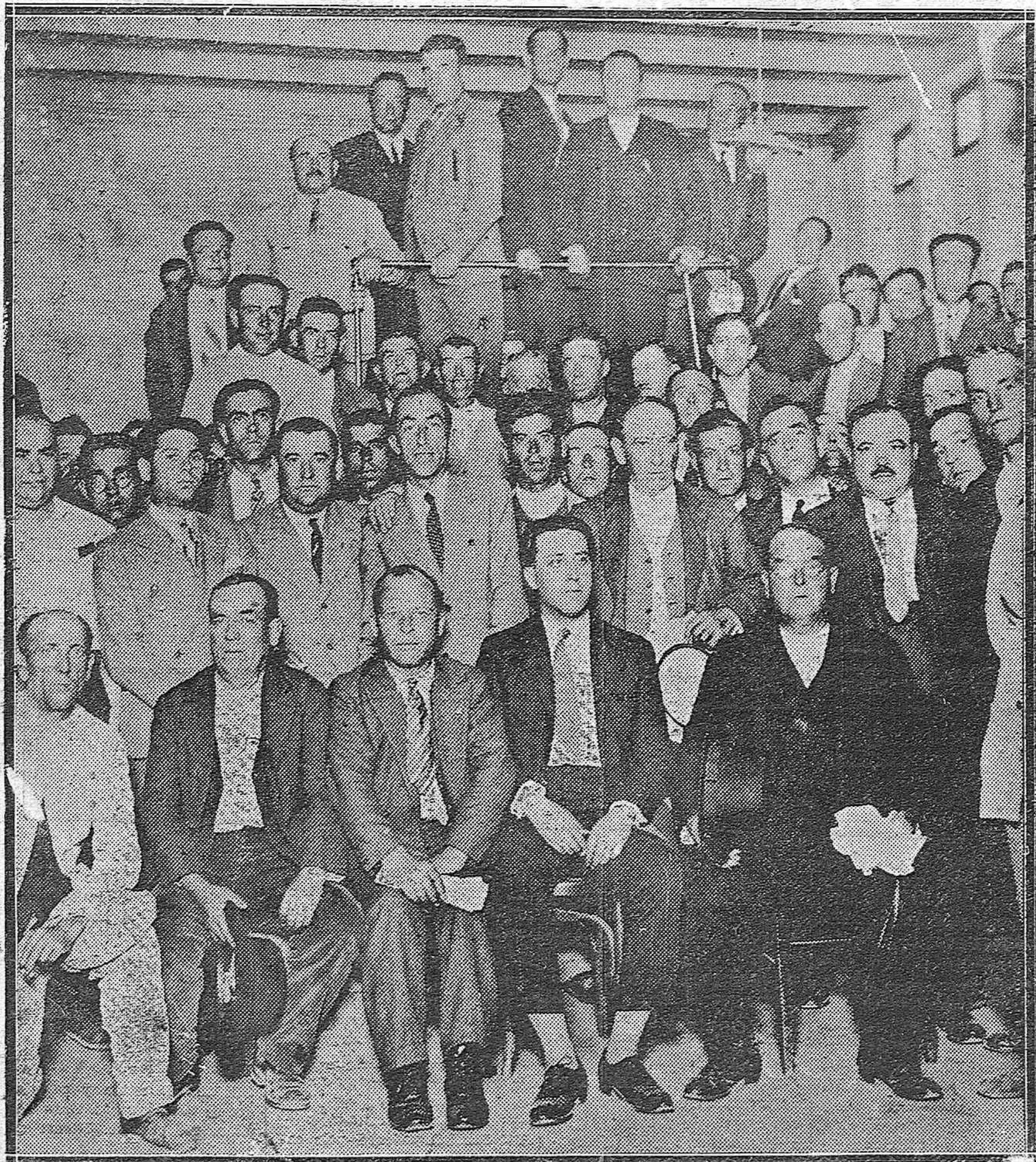
EN LA CASA DE "LA VOZ".—Grupo de asistentes al Congreso Republicano Autónomo durante la visita que hicieron ayer a los talleres de nuestro periódico