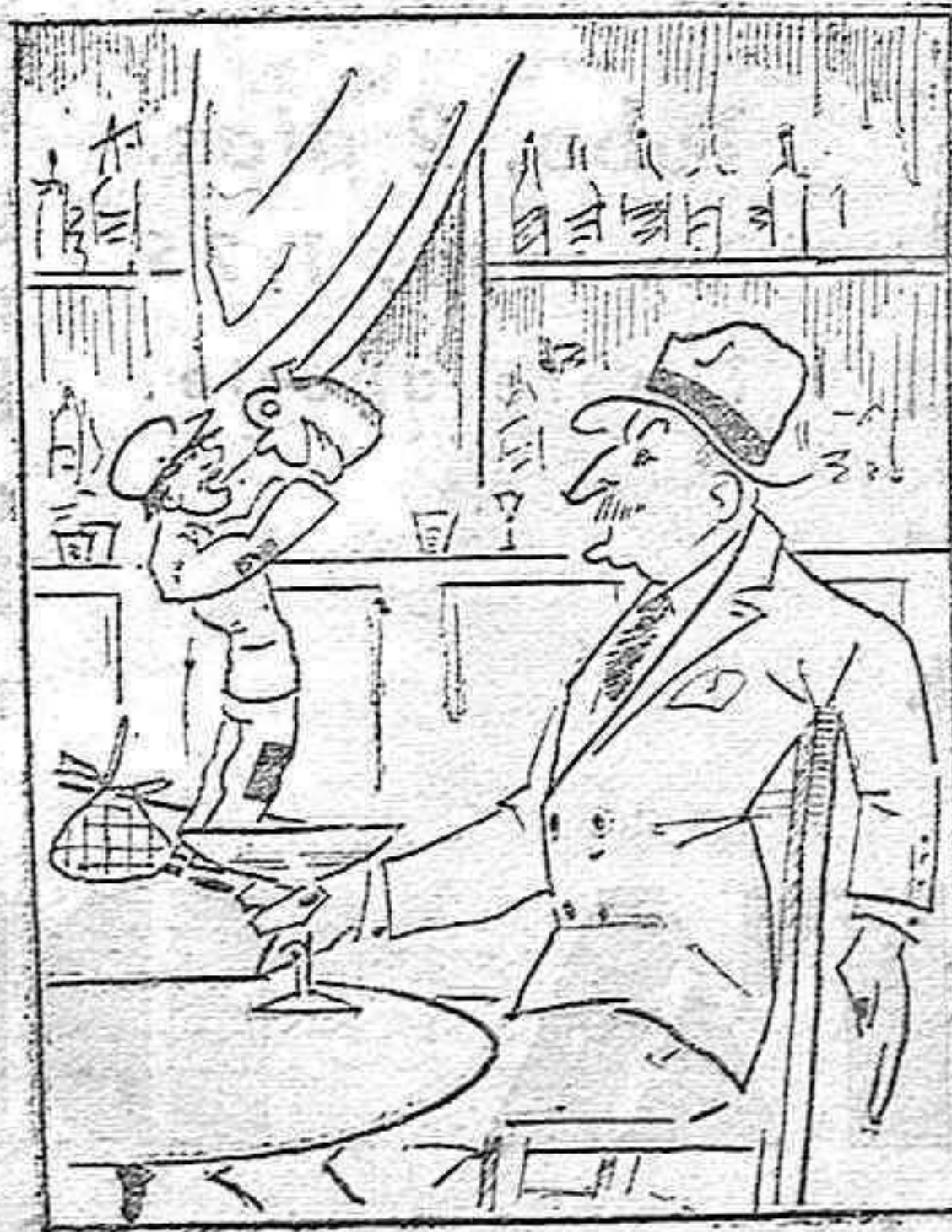
Bebe el gordo y el "delgao".