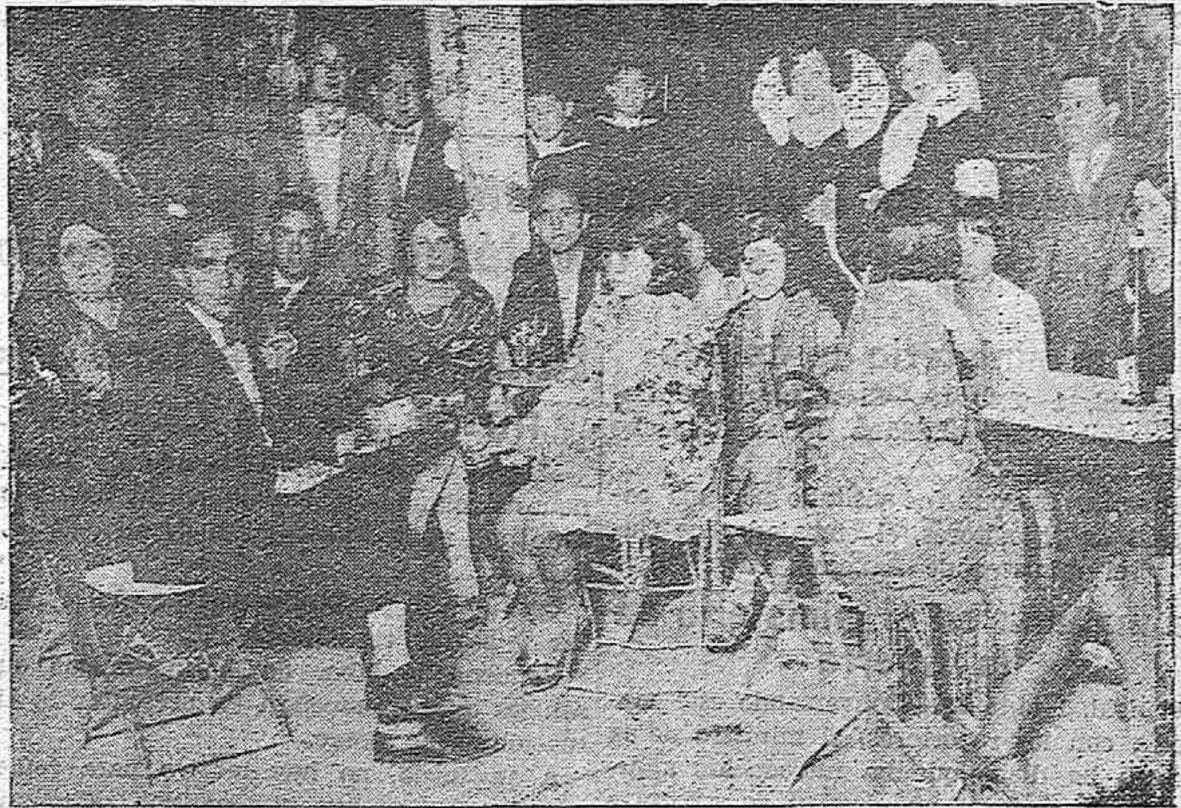
Un rincón de la bulliciosa caseta de la Juventud Republicana, donde parece que se dieron cita las nenas más bonitas de Córdoba

La democracia impera en esta caseta como en ninguna. Todos allí son iguales, el alto y el bajo, el pudiente y el que no lo es. Hasta los camareros una vez servidos los parroquianos, se retiran a su mesa como otro espectador cualquiera.