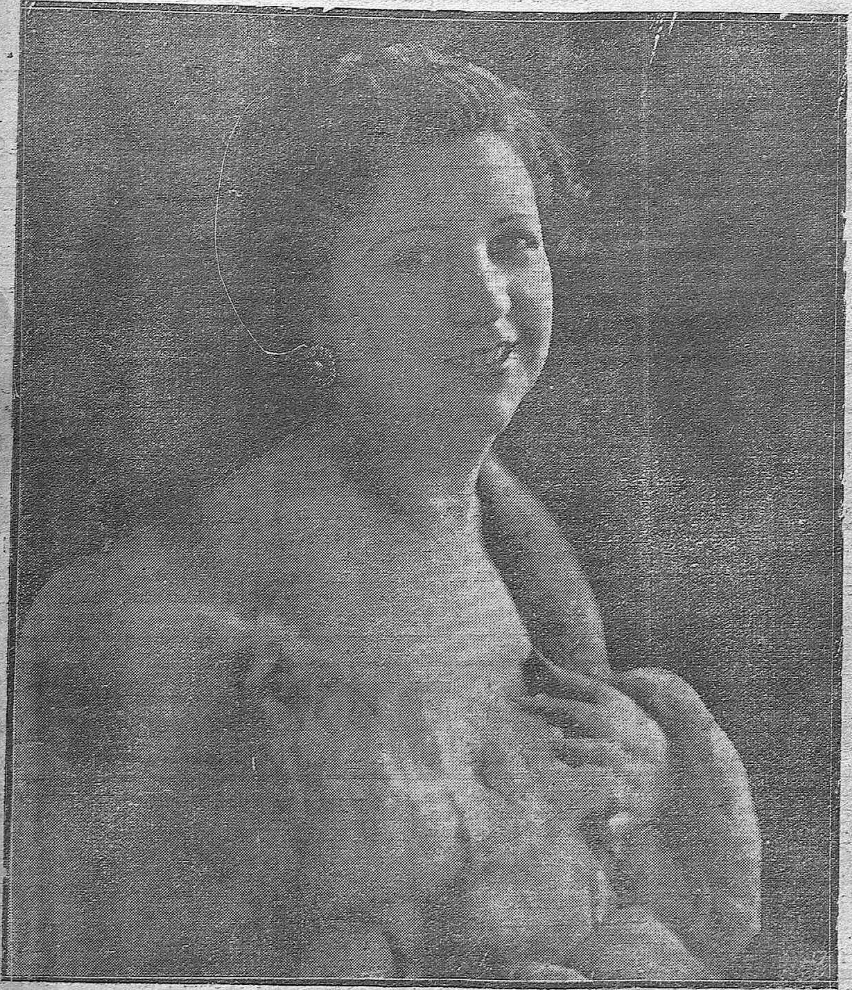
ARTISTAS ESPAÑOLAS.—La notable y bella actriz Tarsila Criado.