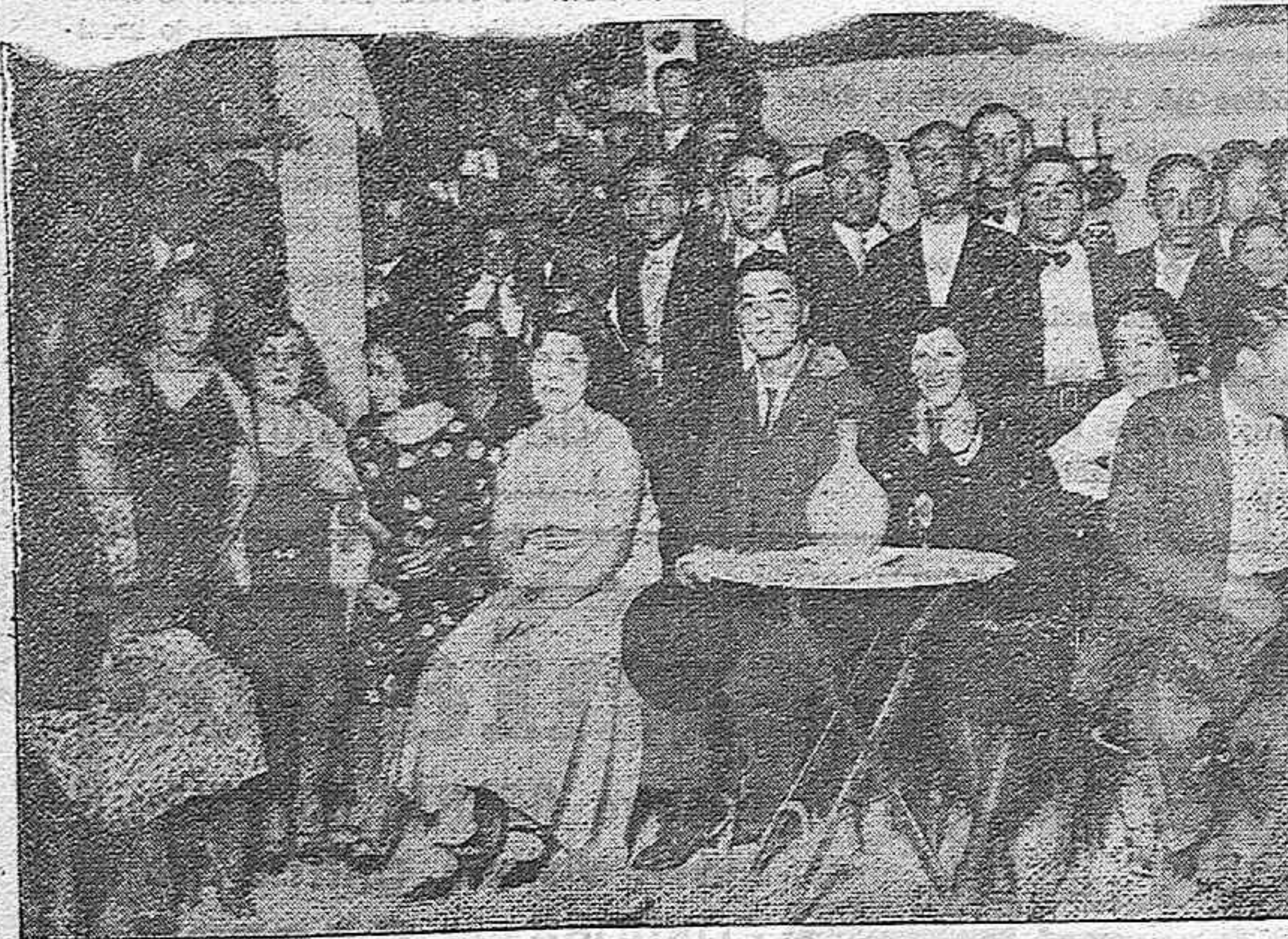
Aspecto de la caseta de la Asociación de Obreros y empleados de ferrocarriles, en una noche de Feria