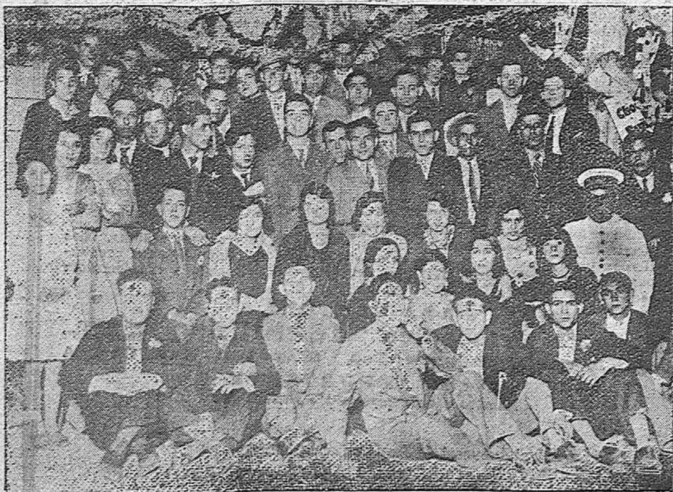
Grupo de concurrentes a la simpática caseta de "cantón" del quinto distrito, emplazada en los Jardines del Duque de Rivas