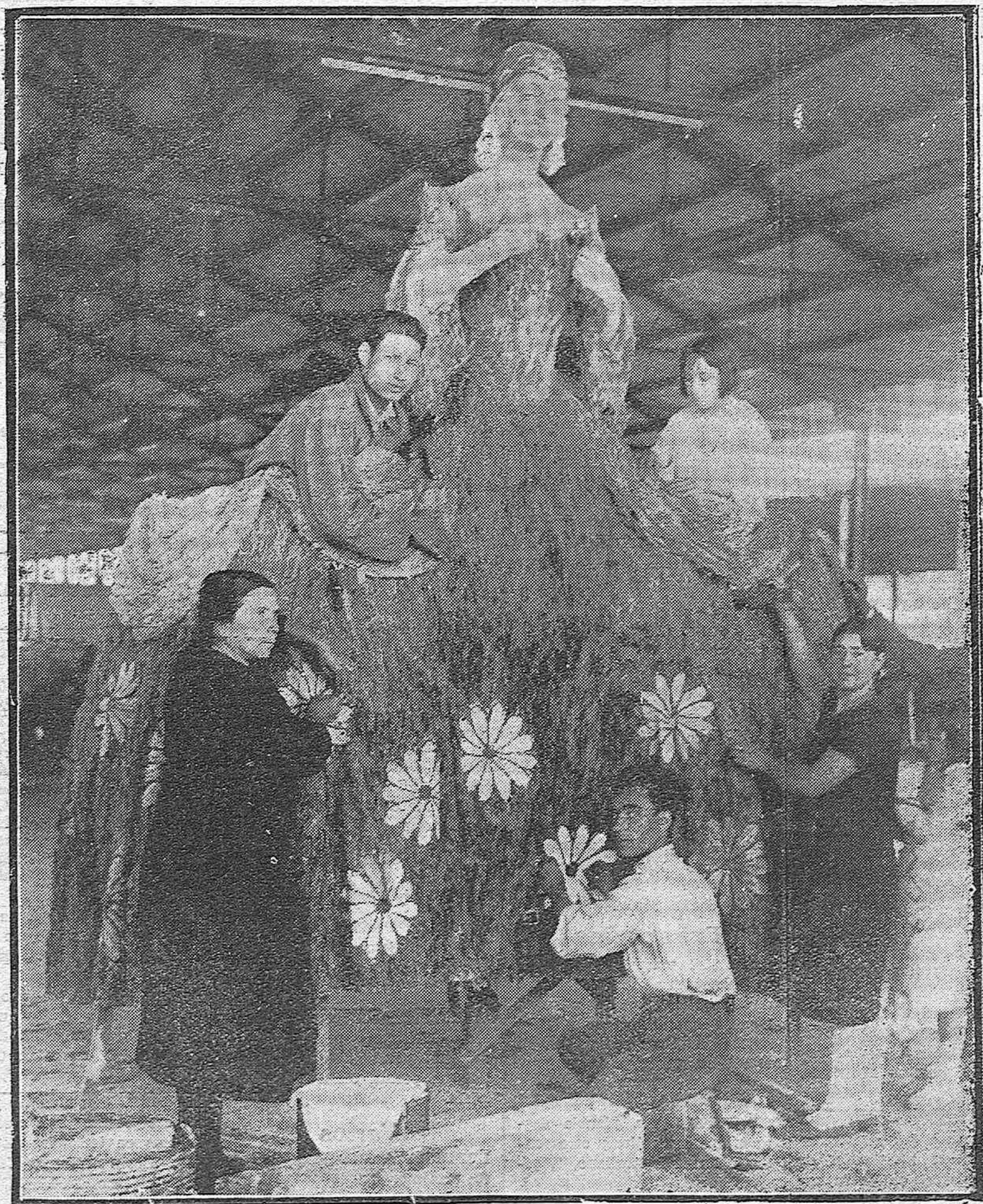
PARA LA BATALLA DE FLORES.—Los artistas valencianos del Maestro Cortina, preparando la carroza de Madame Pompadour, una de las más interesantes del festivo cortejo. (Foto Torres).