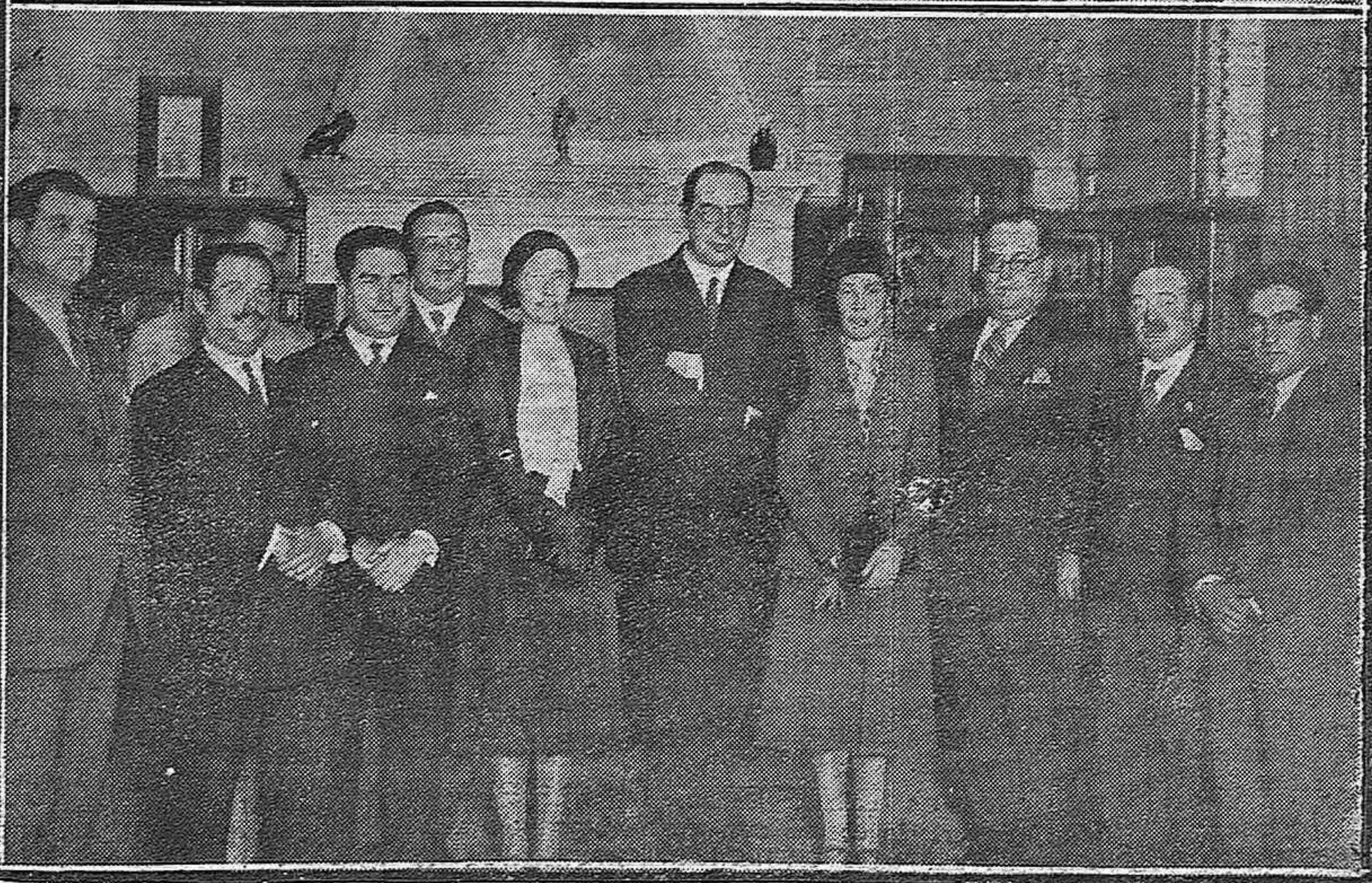
ECIJA.—Señoritas de la buena sociedad de Ecija embellecen una parte de la barrera durante la novillada de Feria. SEVILLA.—La Directora general de Penales, señorita _____ con el Gobernador civil, e. Alcalde y autoridades durante la recepción celebrada en el Ayuntamiento