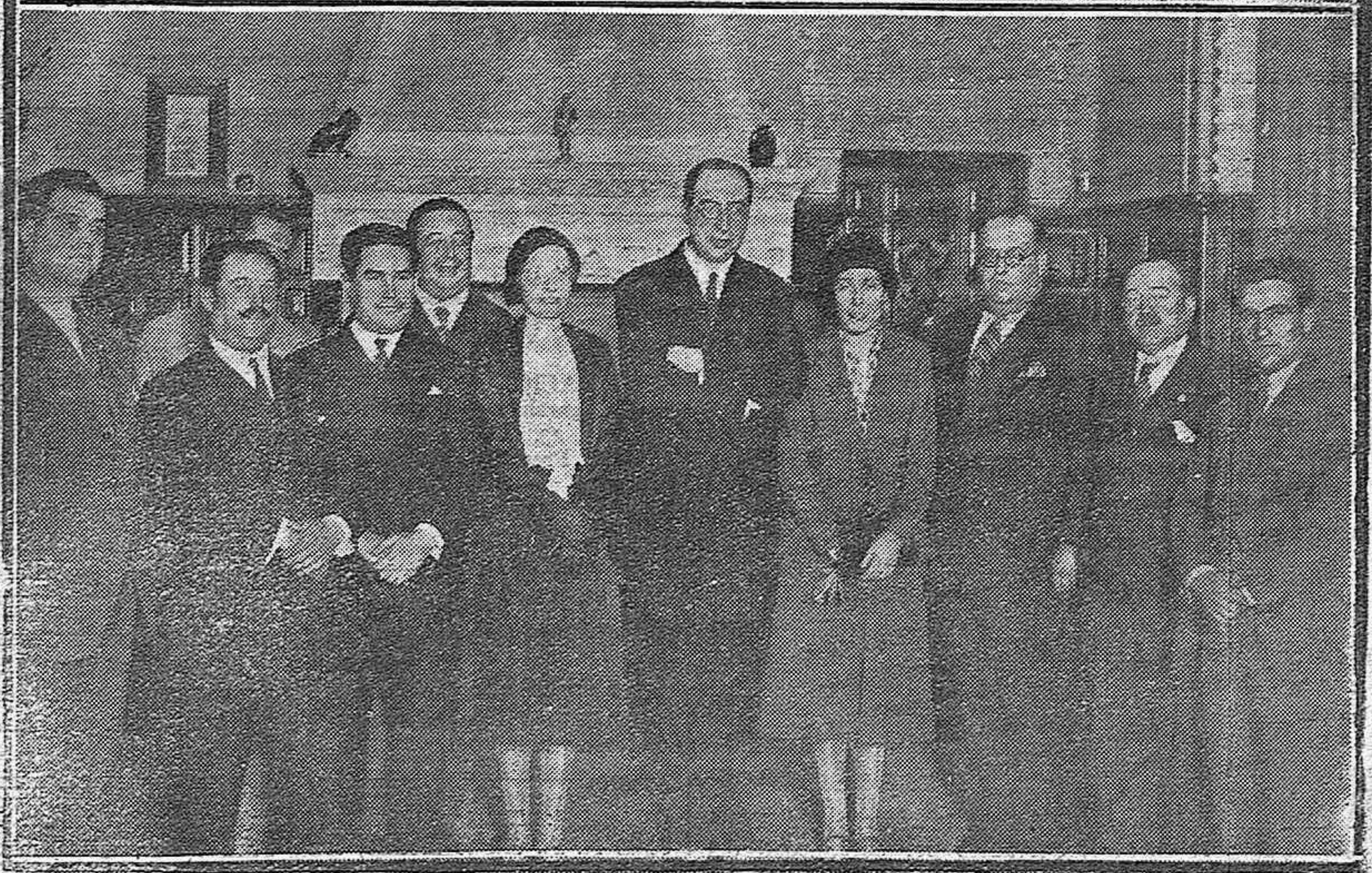
ECIJA.—Señoritas de la buena sociedad de Ecija embellecen una parte de la barrera durante la novillada de Feria. SEVILLA.—La Directora general de Penales, señorita Kent con el Gobernador civil, el Alcalde y autoridades durante la recepción celebrada en el Ayuntamiento