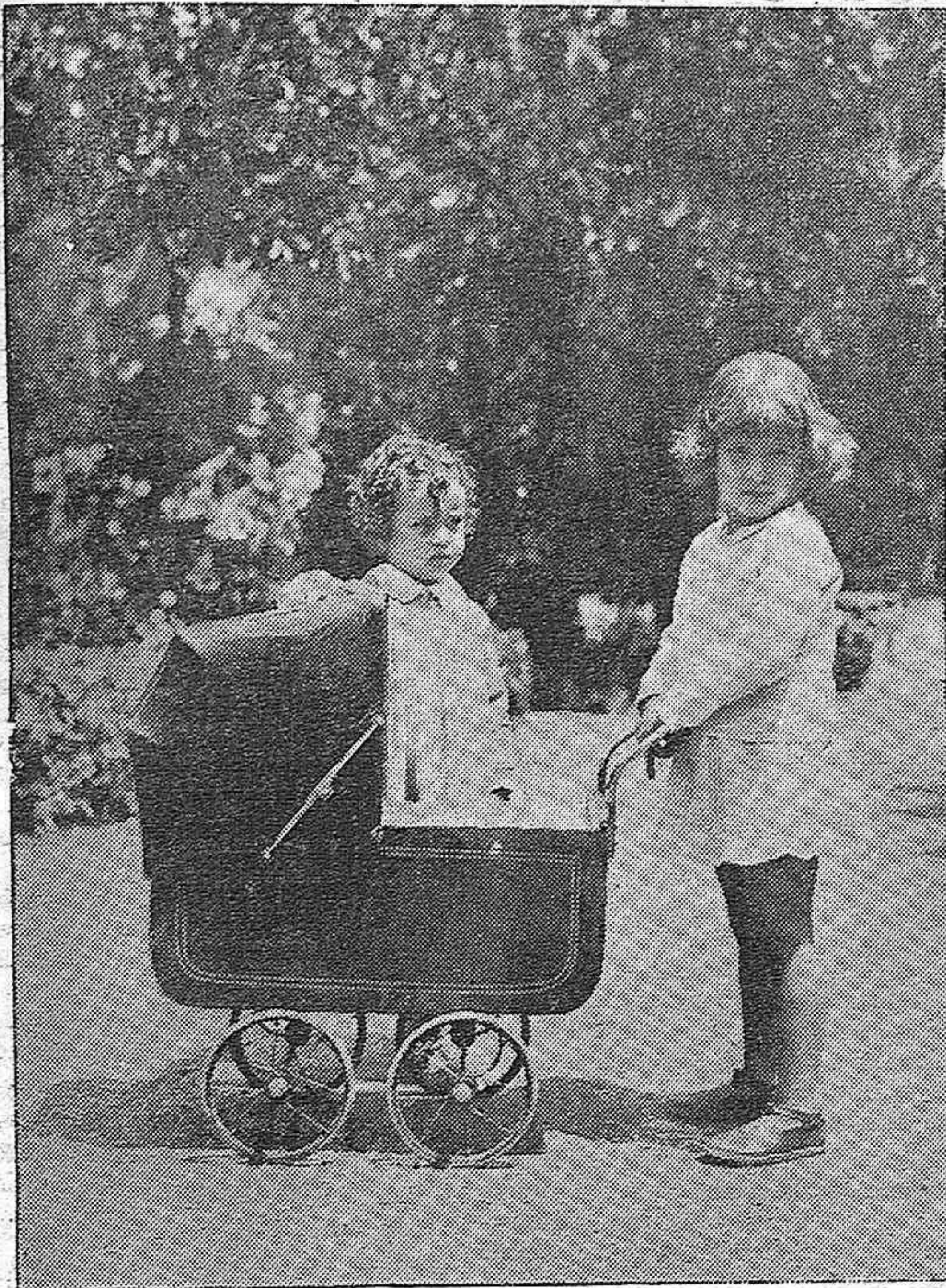
EN LOS JARDINES DEL DUQUE DE RIVAS.—De encantadores y asiduos concurrentes, que acuden en las mañanas de mayo para solazarse con sus juegos infantiles