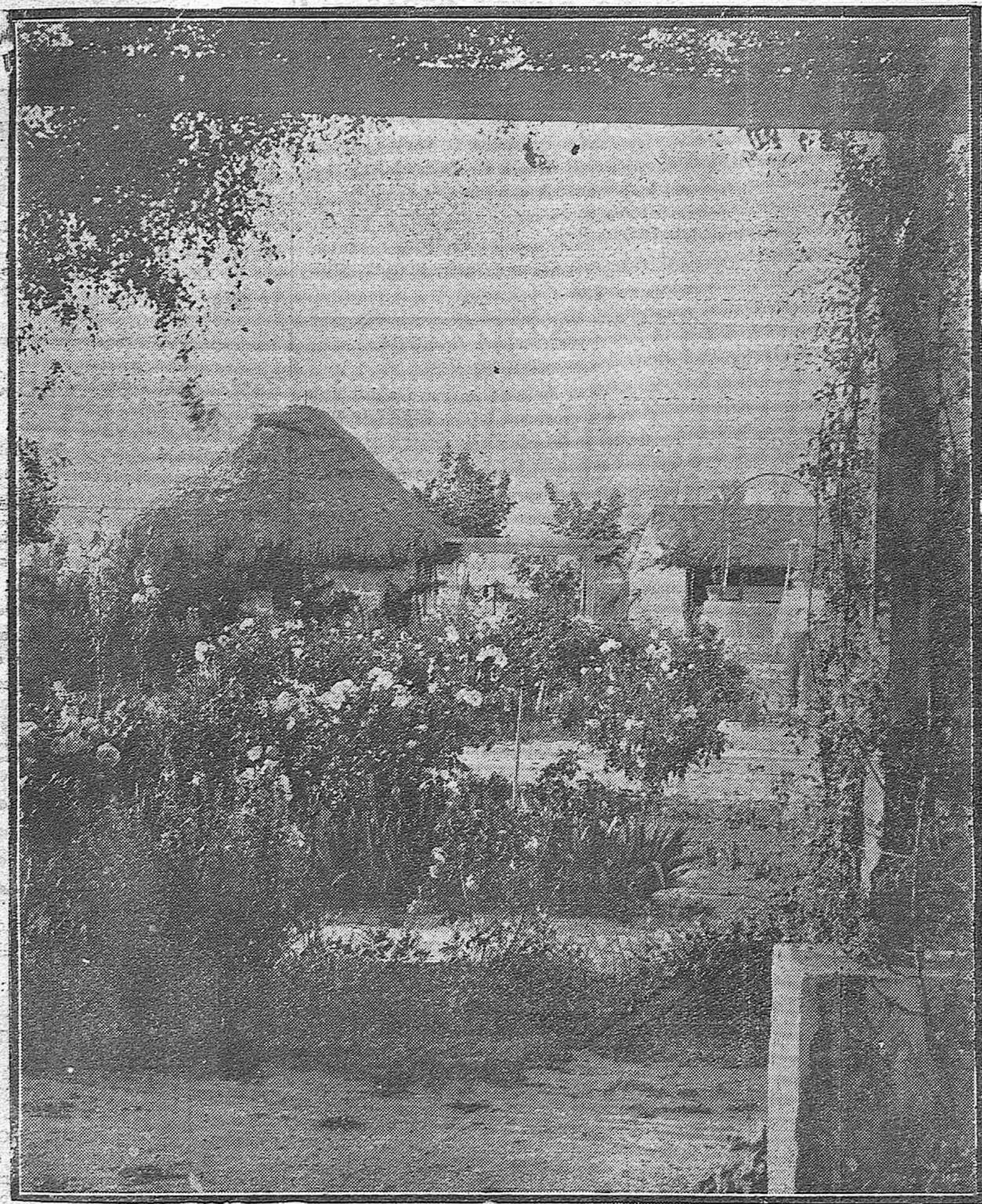
LOS JARDINES EN PRIMAVERA.—Bella fotografía del nuevo jardín del Campo de Folo, donde se jugarán los interesantes partidos de feria.