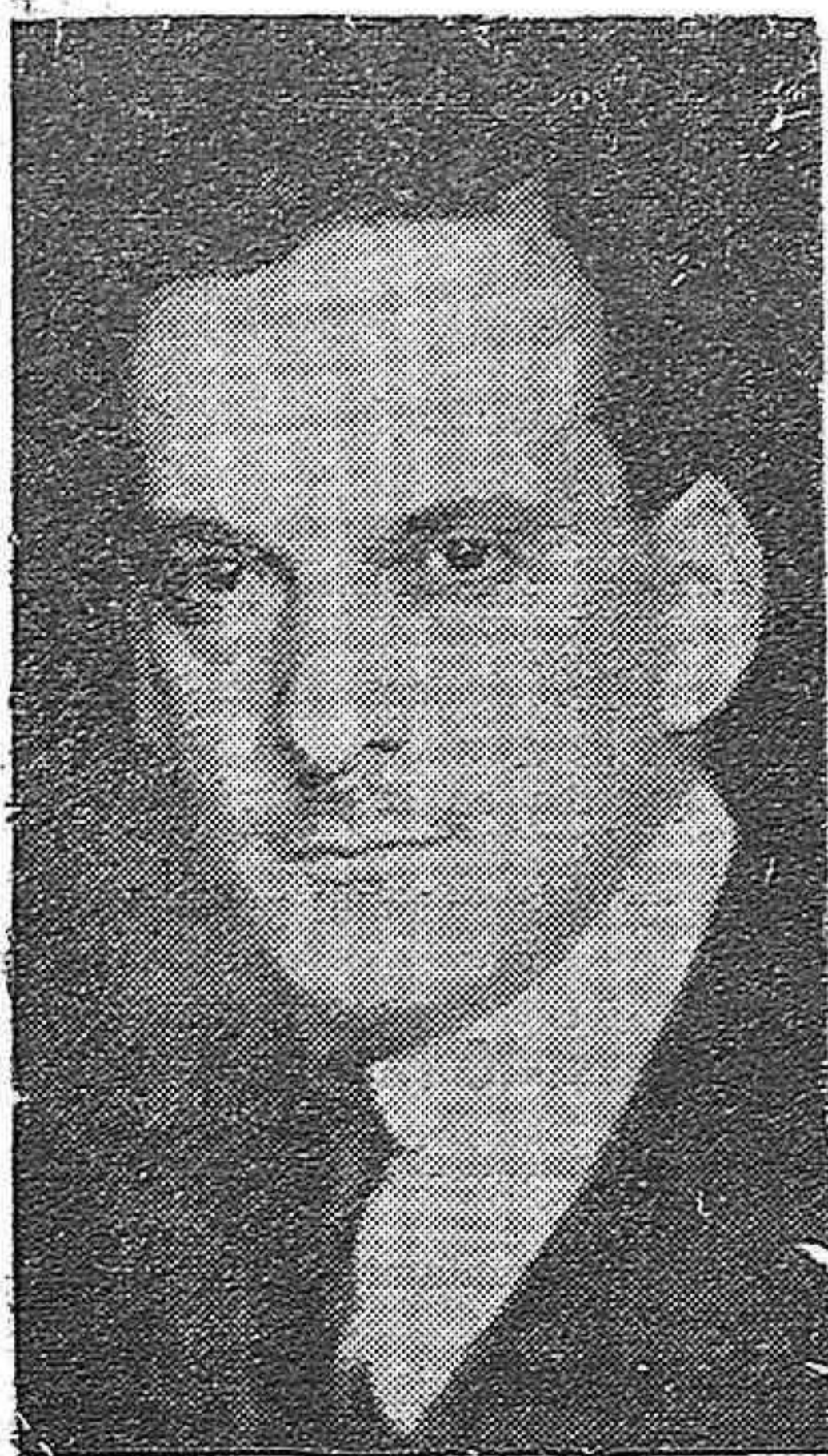
Una de las últimas fotografías del Horado maestro