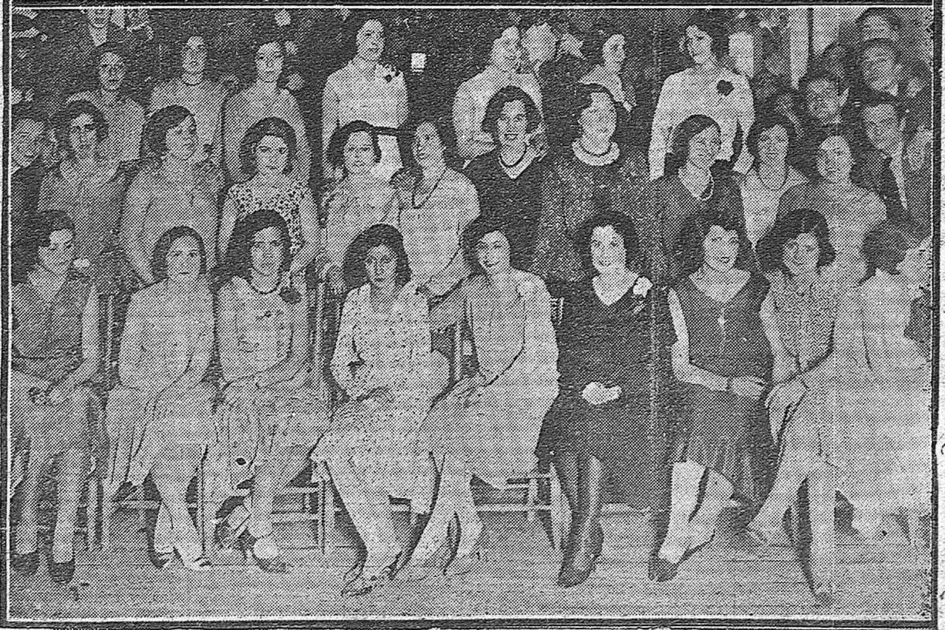
SEVILLA.—El ministro de Comunicaciones durante la recepción celebrada en el Ayuntamiento.