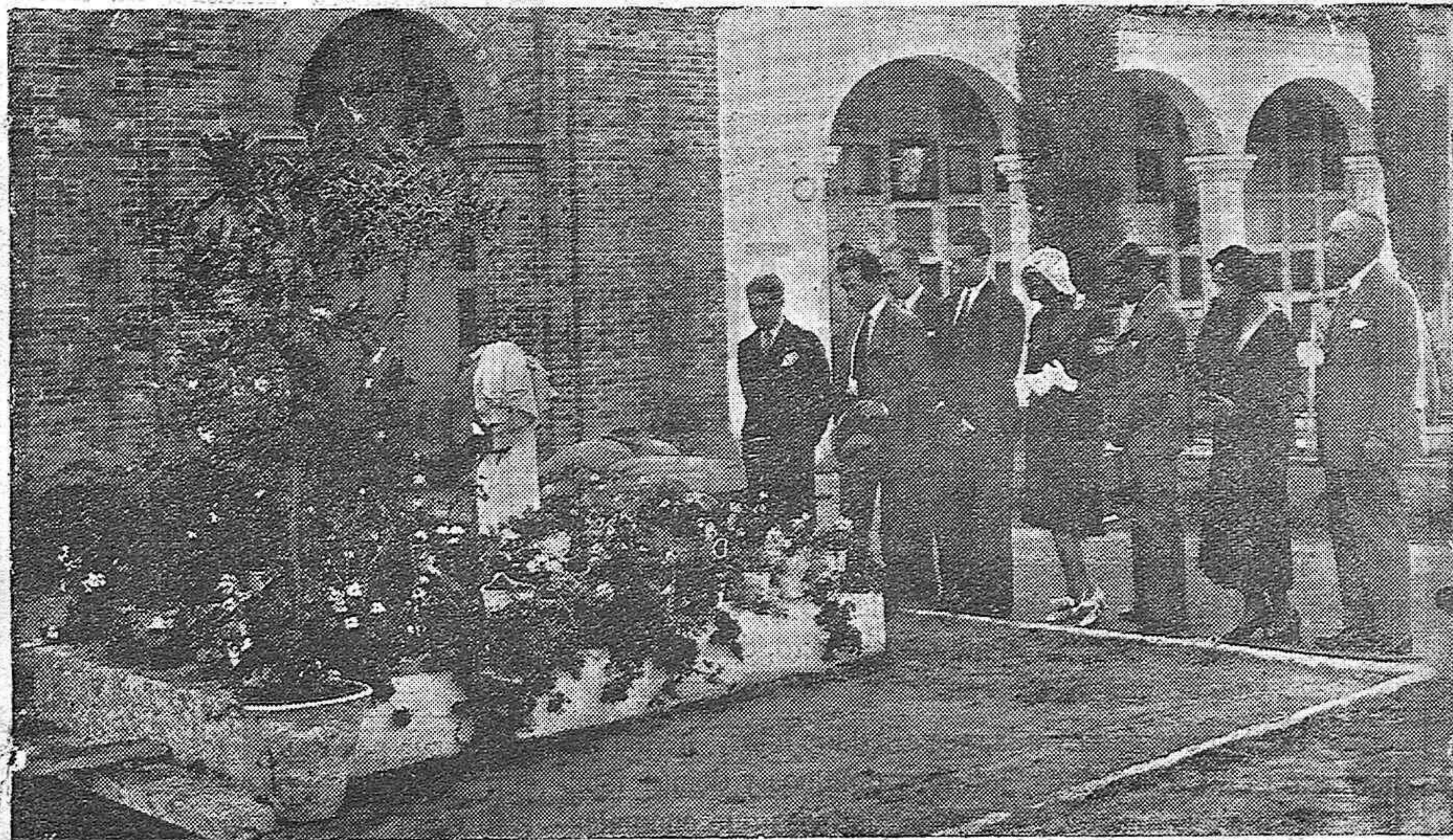
Un grupo de artistas depositando unas coronas de flores sobre la tumba de Julio Romero de Torres, días después de su sepelio