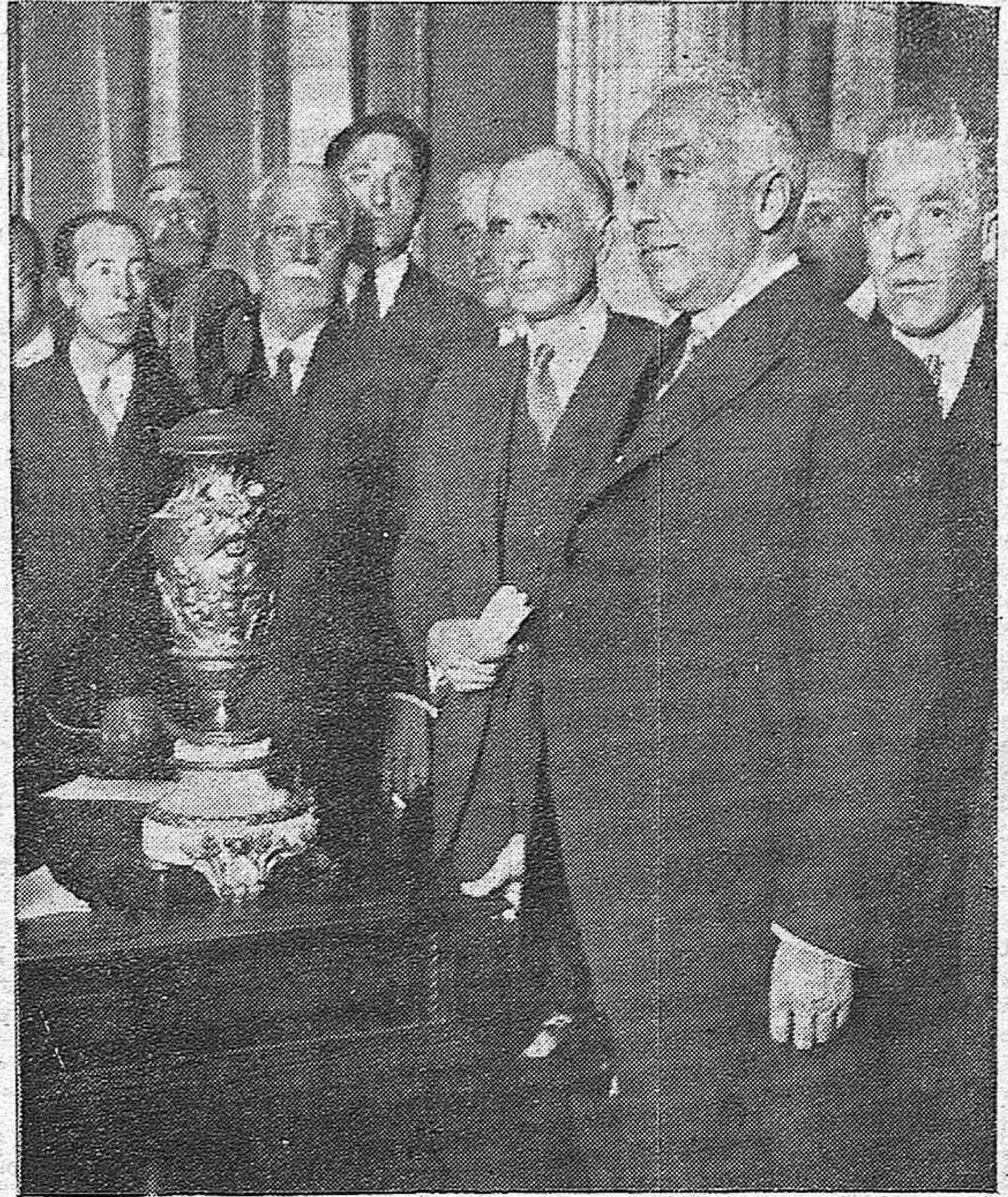
El Presidente del Gobierno provisional, don Niceto Alcalá Zamora, dando por radio una conferencia para América

La jubilación de los maestros es forzosa a los 70 años de edad y en su consecuencia por los jefes de las secciones administrativas de Primera Enseñanza, se dispondrá el cese de todos aquellos maestros que hayan cumplido o cumplan 70 años, si cuenta el mínimo de 20 de servicios abonables.