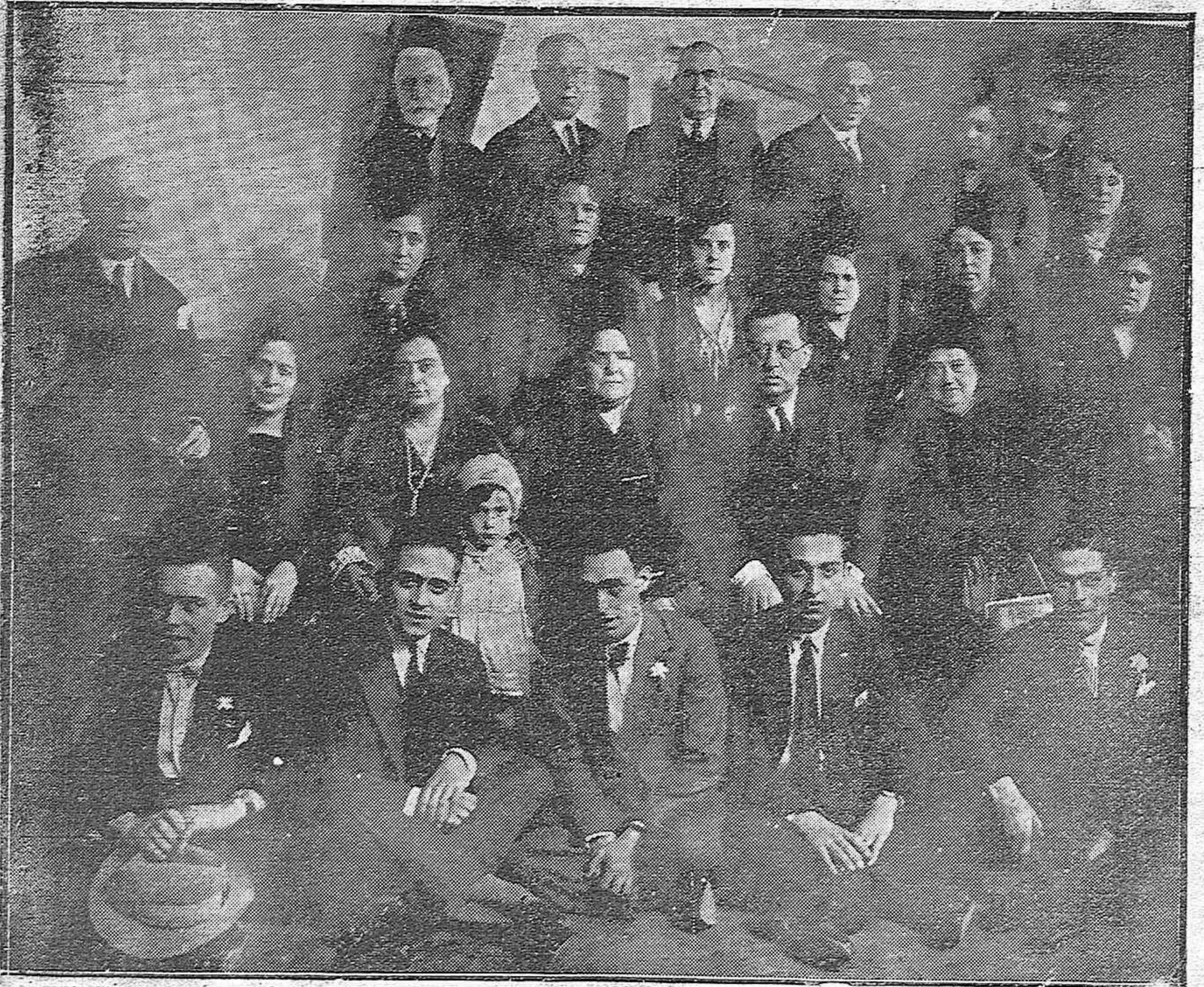
Los Maestros Nacionales al terminar la fiesta religiosa que dedicaron a San Rafael, en la iglesia del Juramento.