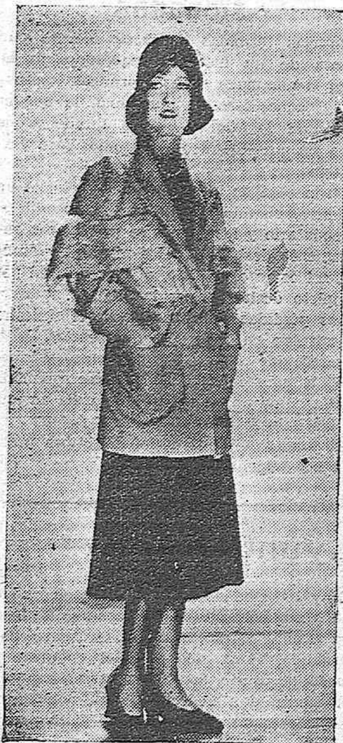
LA CHAQUETA DE PAÑO BLANCO HACE MUY chic CON EL VESTIDO DE CREPÉ NEGRO DE CHINA, EN LA GENIAL ARTISTA MARION DAVIES