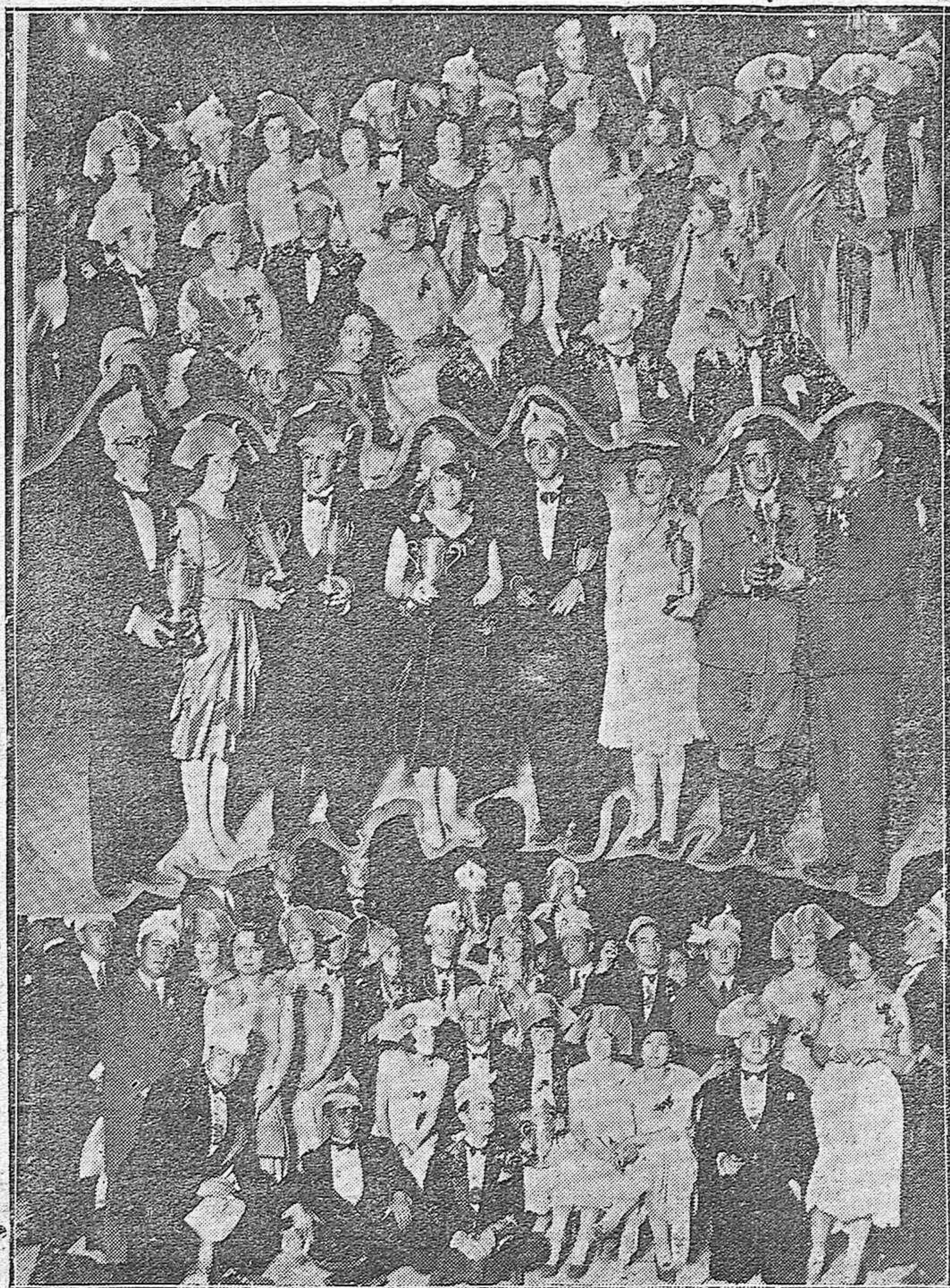
COTILLON DE HONOR EN EL CAMPO DE TENNIS Y ENTREGA DE LOS PREMIOS DEL CAMPEONATO.—Grupos de bellas señoritas y distinguidos jóvenes que asistieron al acto.—En el centro: Entrega de las Copas a los vencedores del Campeonato.