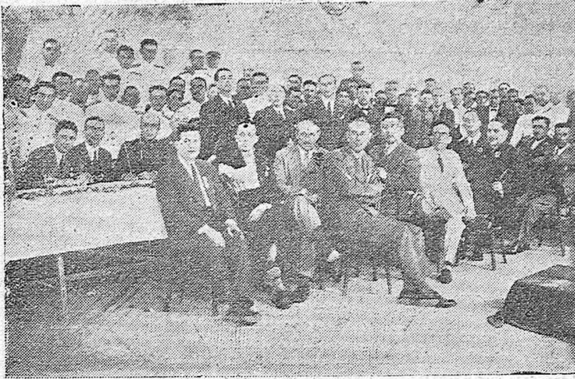
BANQUETE CON QUE EL AYUNTAMIENTO OBSEQUIÓ EN LA CASETA DEL PASEO DE LA VICTORIA, A LOS ALCALDES DE LOS PUEBLOS Y DIRECTORES DE LAS BANDAS MUNICIPALES QUE TOMARON PARTE EN EL CONCURSO-CERTAMEN QUE SE CELEBRÓ EN LOS ÚLTIMOS DÍAS DE FERIA