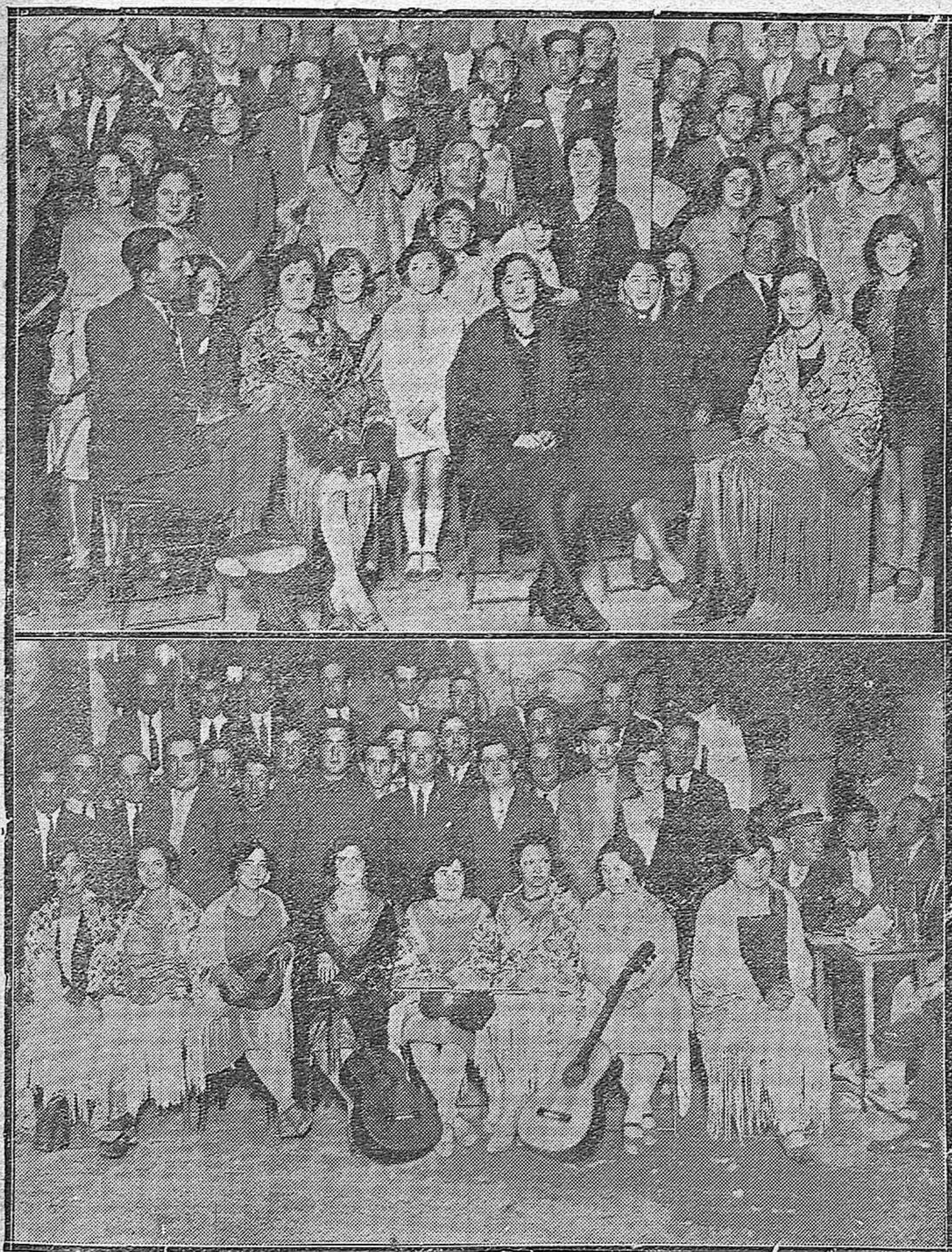
DE LA FERIA DE LA SALUD.—Últimas verbenas celebradas en las Casetas de «La Unión Mercantil Recreativa» y «Club Barrera».