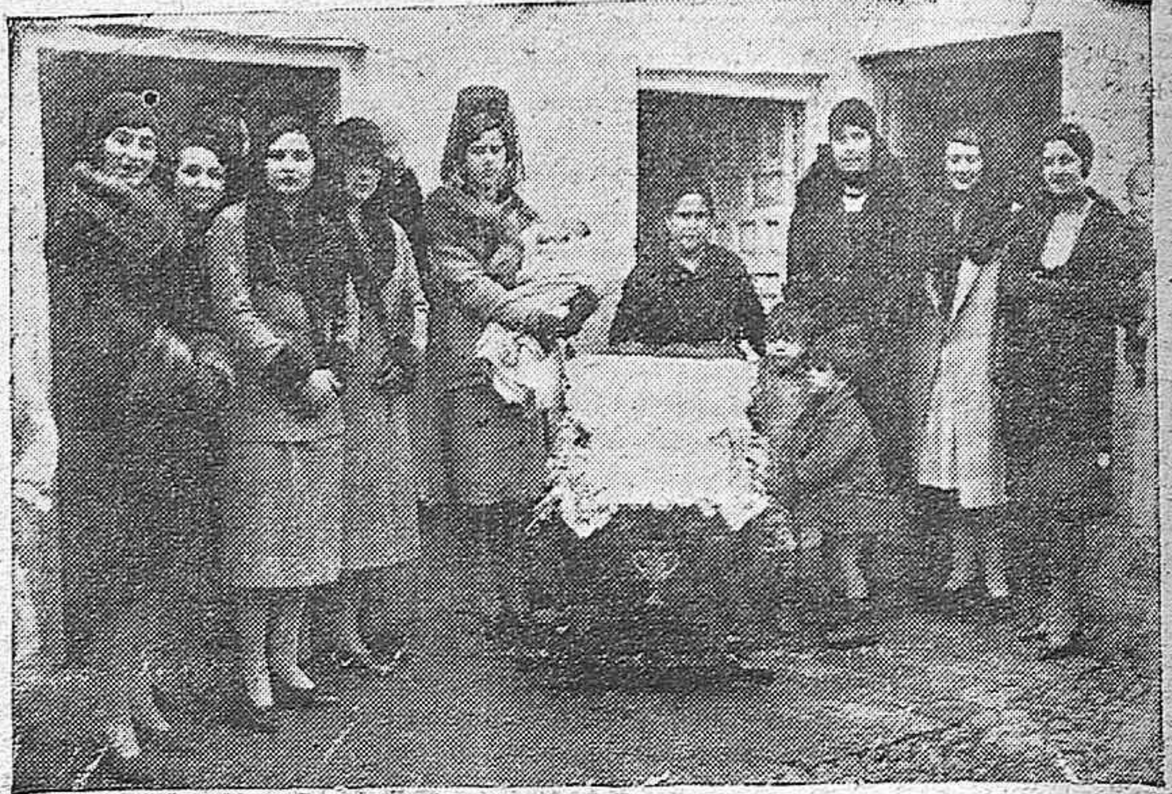
LAS DISTINGUIDAS SEÑORITAS DE DANVILA, FERNÁNDEZ DE CÓRDOBA, RUIZ SANTAELLA, ALVEAR, CRUZ CONDE, FERNÁNDEZ DE MESA Y CÁCERES, ENTREGANDO UNA CUNA Y UN HATILLO A UNA OBRERA CUYO HIJO NACIÓ EL DÍA DE NOCHEBUENA.

Como puede observarse, el procedimiento es de una claridad conmovedora.—X. X. X.