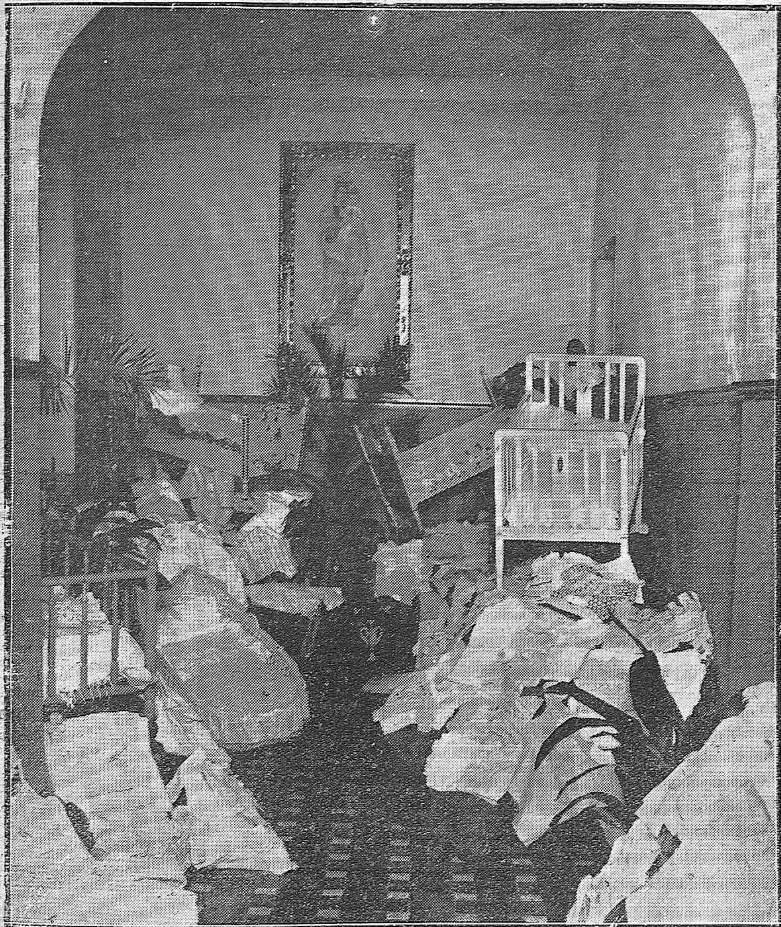
LAS DAMAS CATEQUISTAS. — EXPOSICIÓN DE ROPAS PARA LOS POBRES, CONFECCIONADAS POR LAS SEÑORITAS AUXILIARES DE ESTA BENÉFICA INSTITUCIÓN.