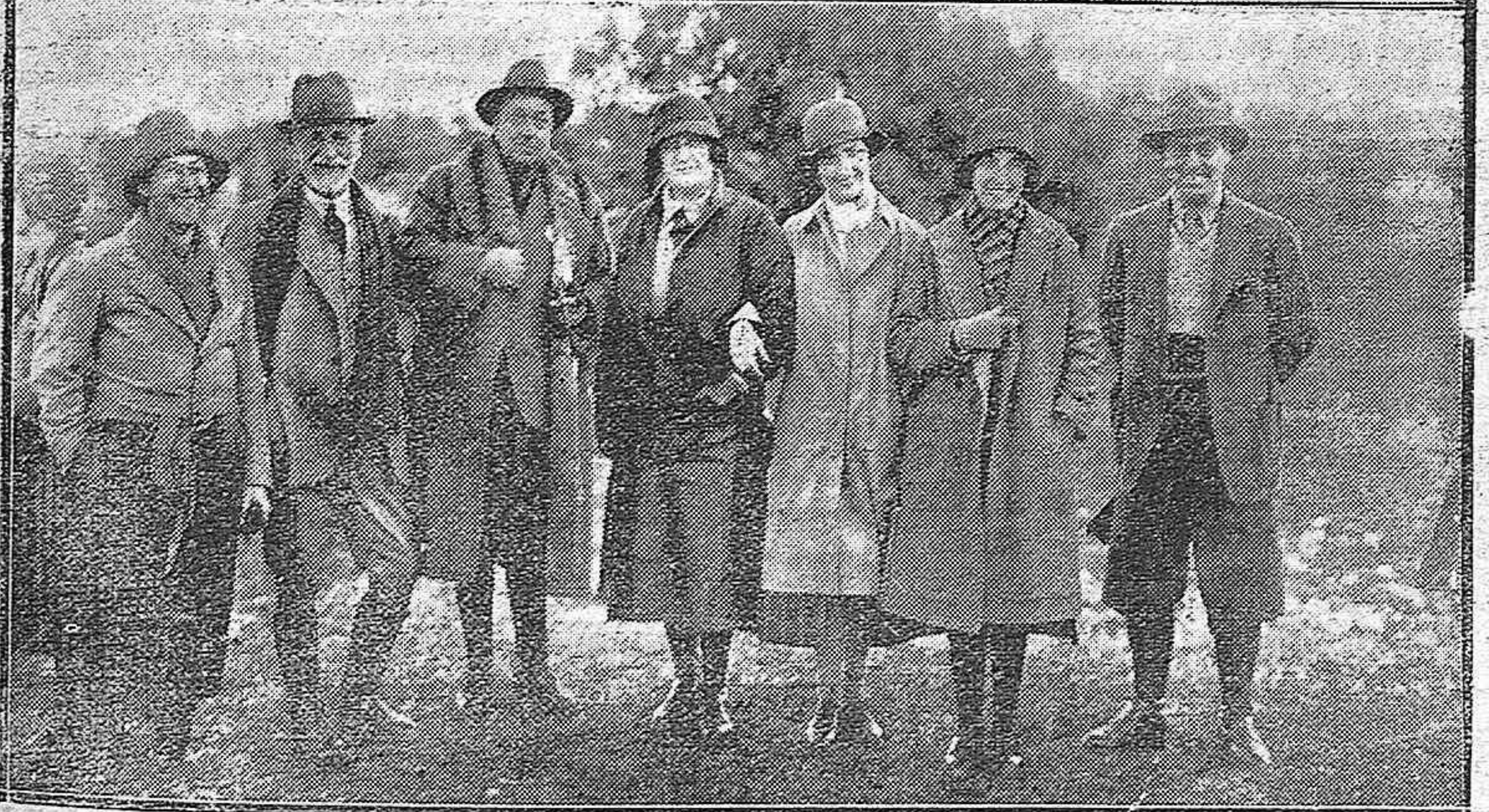
LA CACERIA REGIA EN MORATALLA. — S. M. EL REY AL LLEGAR AL PUNTO. — VARIOS ARISTÓCRATAS DE LOS QUE HAN TOMADO PARTE EN LA CACERIA.