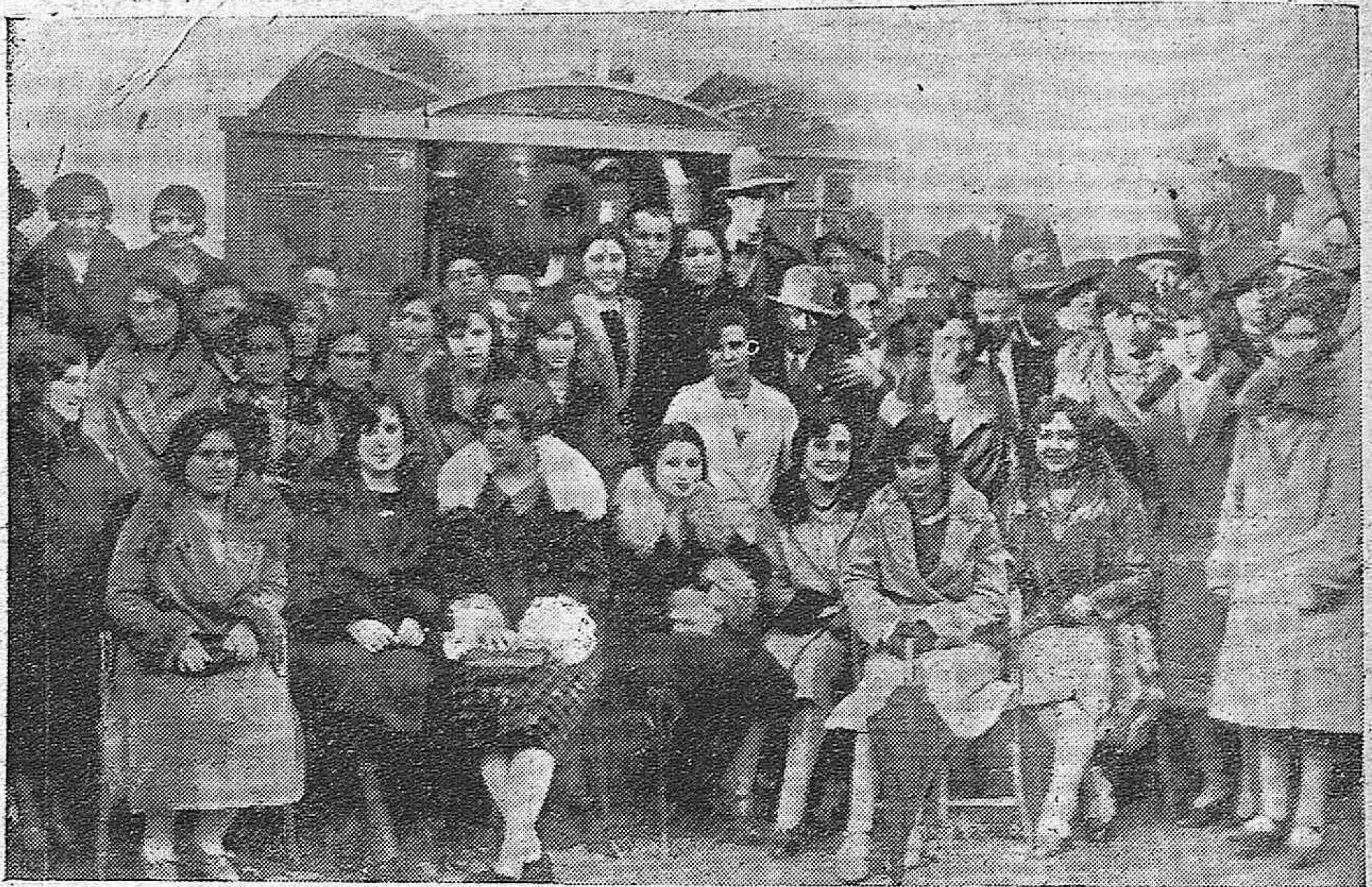
POZOBLANCO.—DISTINGUIDAS SEÑORITAS QUE ASISTIERON AL REPARTO DE JUGUETES Y PRENDAS DE VESTIR A LOS NIÑOS POBRES, CON MOTIVO DE LA FIESTA DE REYES.