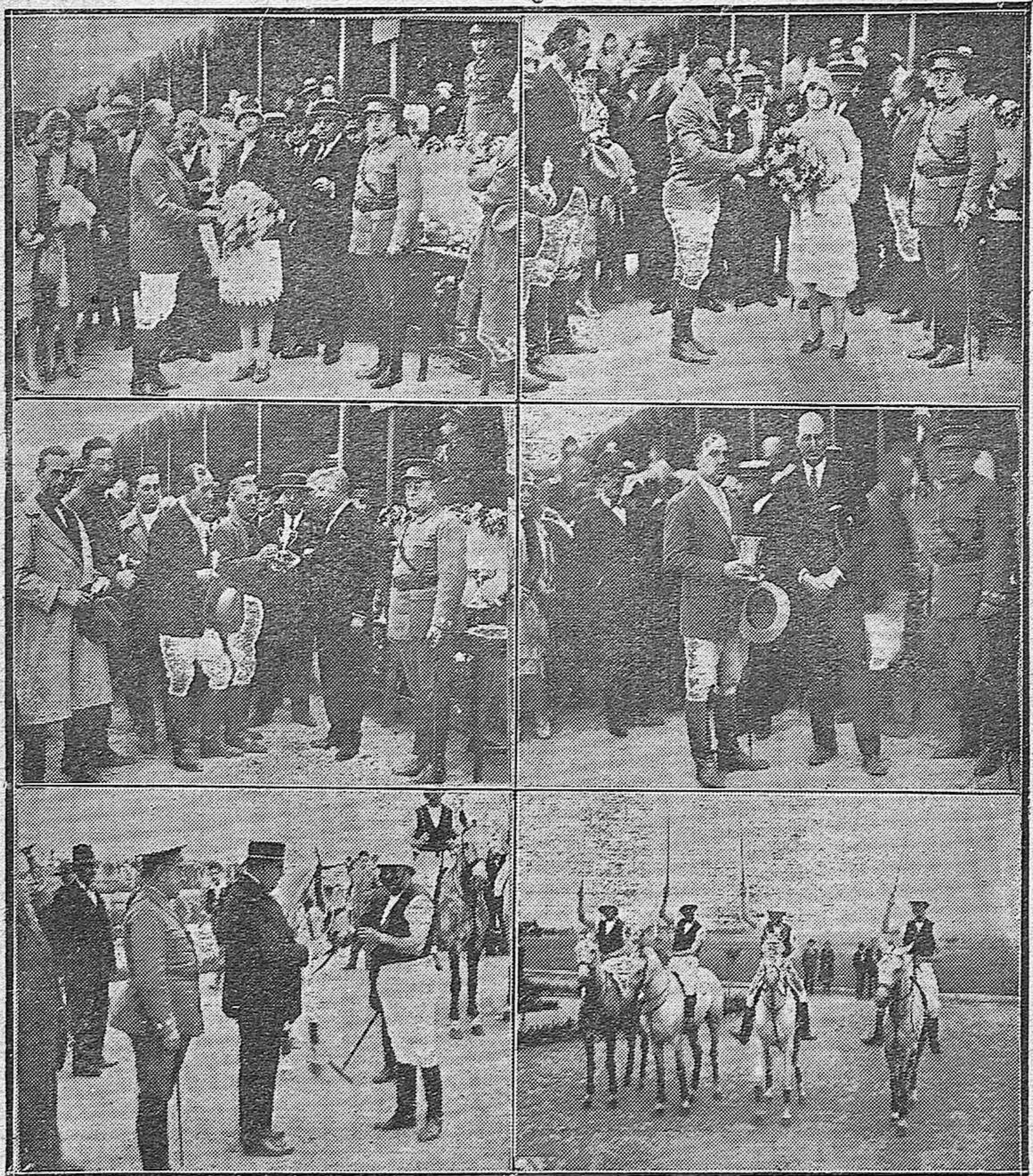
EN EL CAMPO DE POLO.—Terminación del Campeonato Regional.—Entrega de las Copas ofrecidas en las diversas pruebas realizadas durante los encuentros.