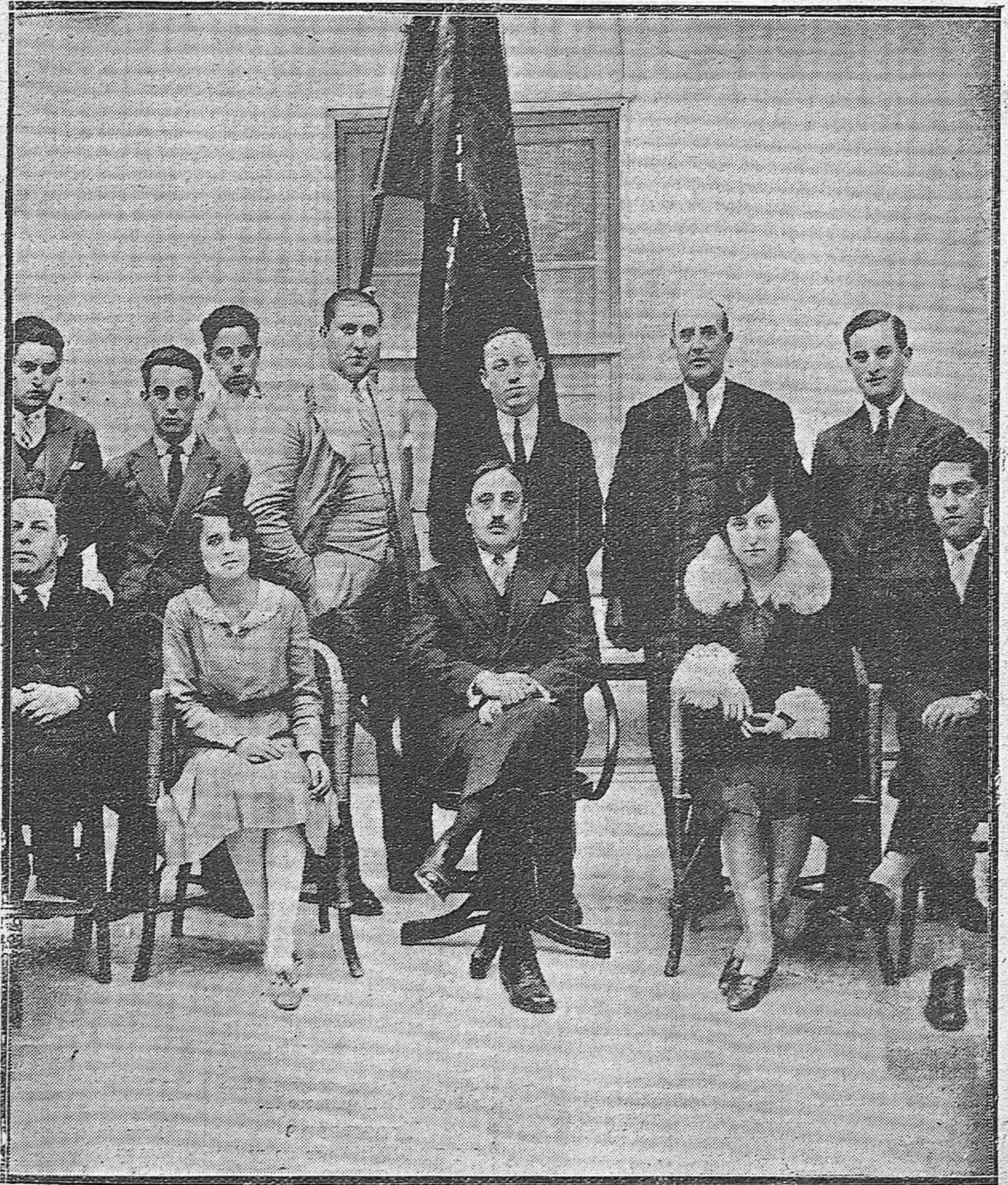
EL DIRECTOR Y PROFESORES DE LA ESCUELA OFICIAL FRANCESA, DESPUÉS DE LA FIESTA CON QUE CELEBRARON EL ANIVERSARIO DE SU REORGANIZACIÓN.