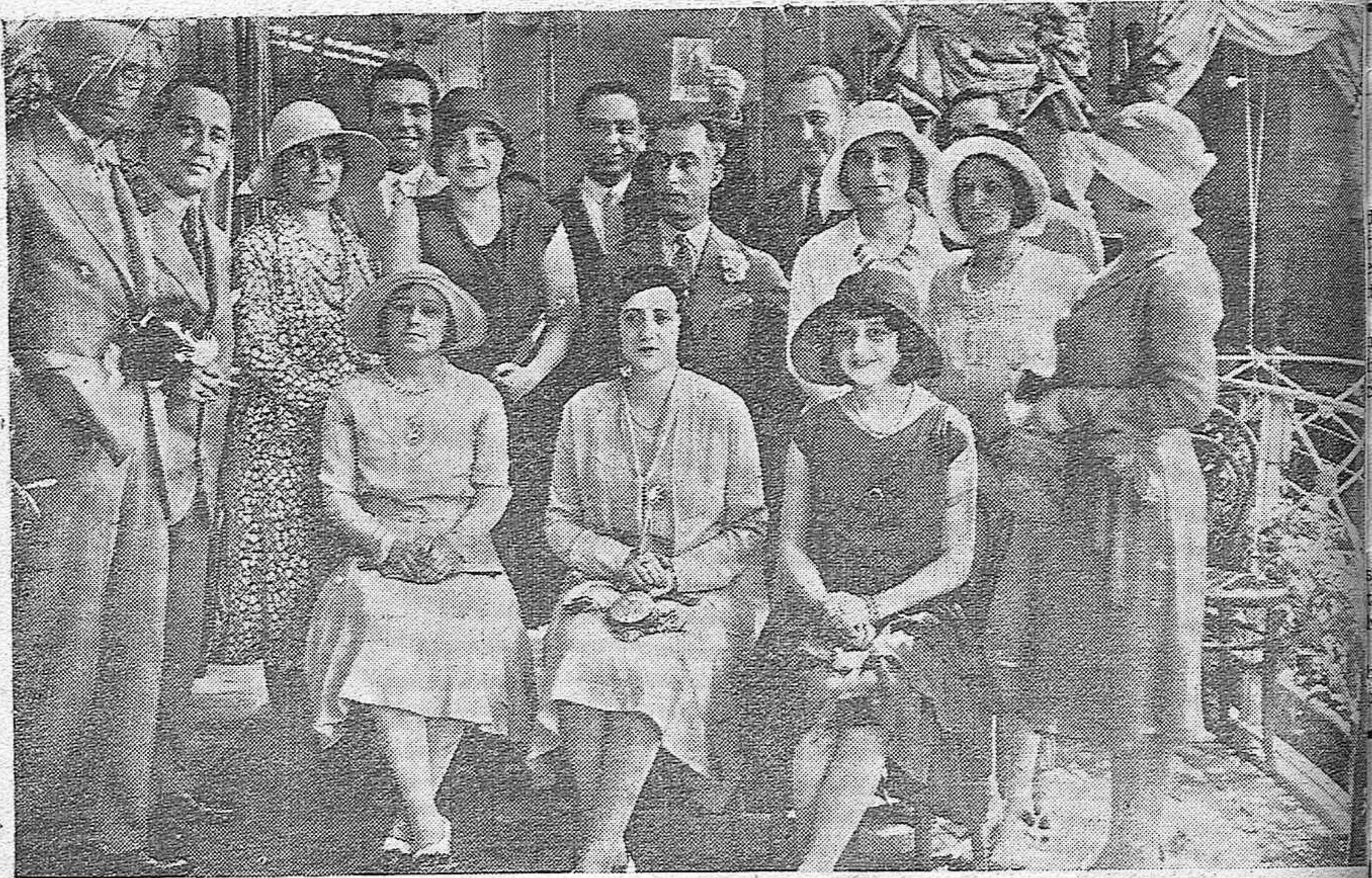
EN LA CASETA DE LA AMISTAD.—UN GRUPO DE DESINGUIDOS JOVENES QUE ASISTIERON AL ÚLTIMO BAILE MATINAL.