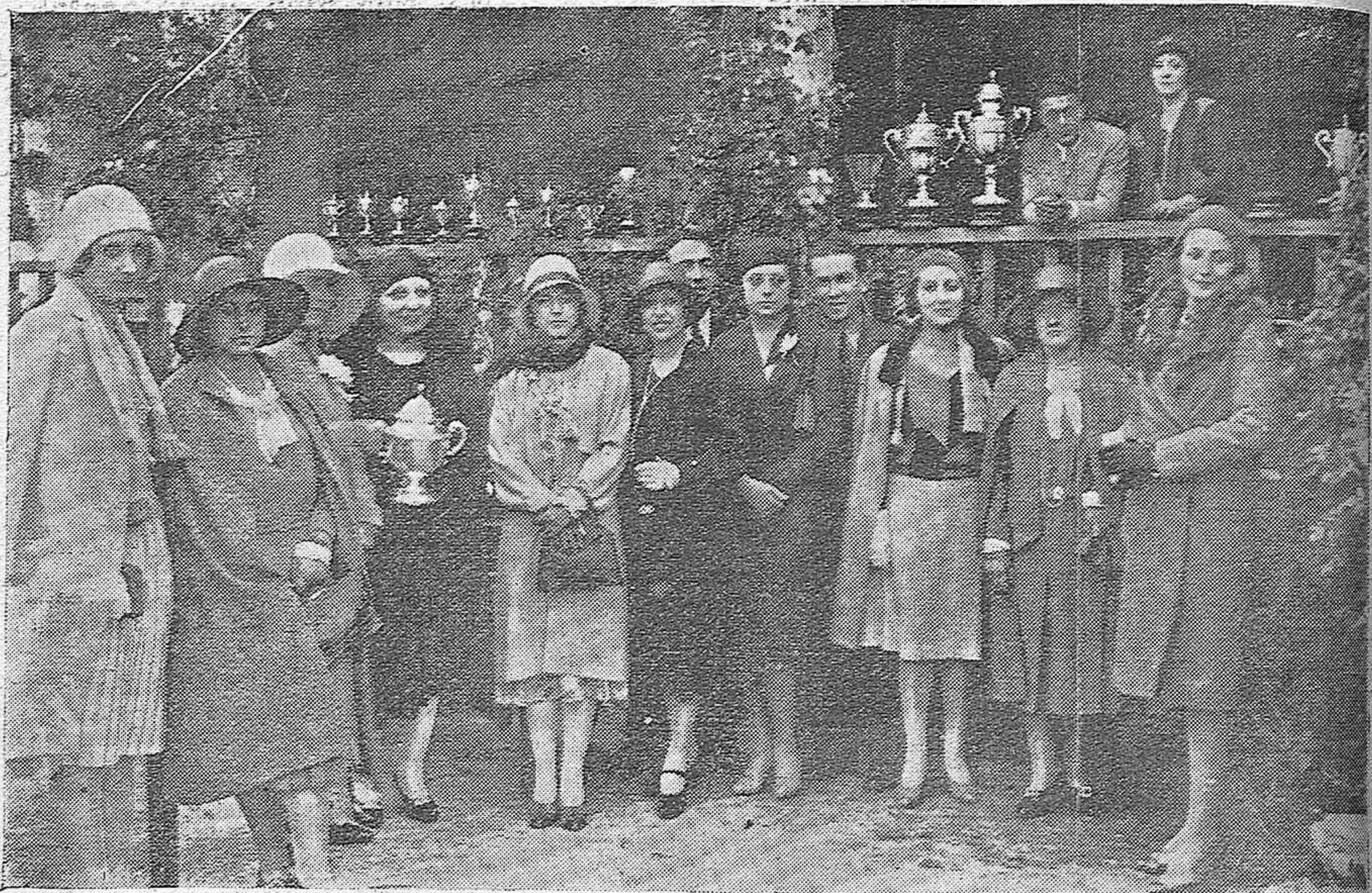
EN EL TIRO DE PICHON.—BELLISIMAS SEÑORITAS QUE ENTREGARÁN LAS COPAS A LOS VENCEDORES Y QUE ASISTIERON AYER A LAS PRIMERAS PRUEBAS.