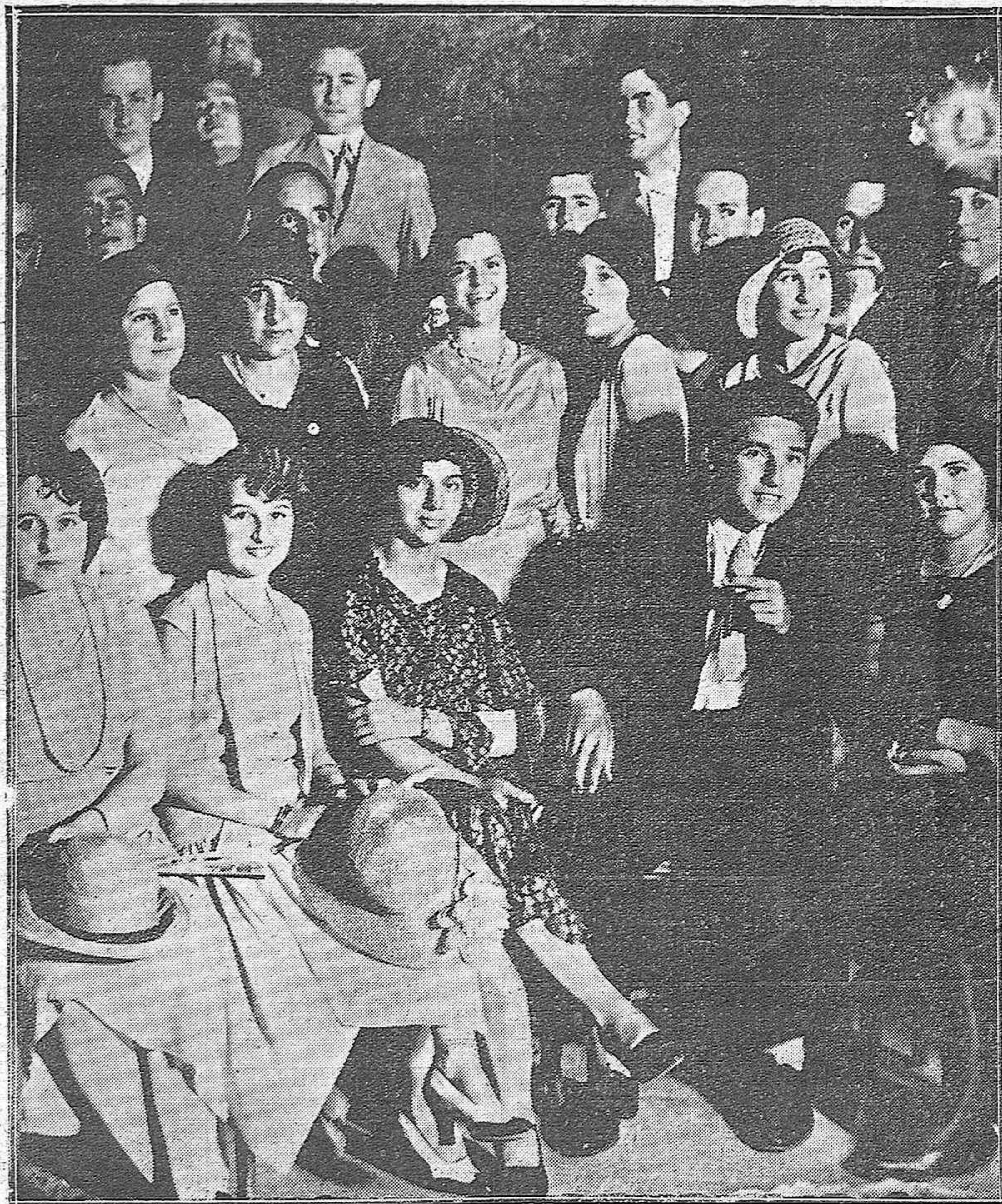
GRUPO DE BELLISIMAS SEÑORITAS EN LA CASETA DEL CÍRCULO DE LA AMISTAD, QUE GOZA DE GRAN ANIMACIÓN ESTE VERANO.