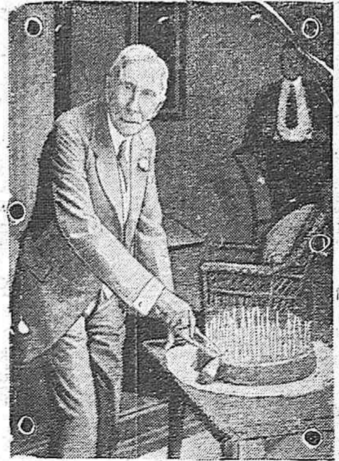
EL MULTIMILLONARIO NORTEAMERICANO JHON D. ROCKEFELLER ANTE EL PASTEL DE ANIVERSARIO, CON LAS 91 VELITAS ENCENDIDAS, EN MEMORIA DE LOS 91 AÑOS QUE CUMPLIÓ EN JULIO.

Ambos extremos son viciosos, y ambos, igualmente recusables. Y esperamos que el gobernador, al hacer frente a los "negocios" de ciertos mercaderes, vigile asimismo los otros manejos, que encubiertos bajo una capa de legalidad, tienden al mismo fin, que no es otro que ver acrecentar saludablemente sus beneficios, por cauces no siempre de acuerdo con las prevenciones legales.