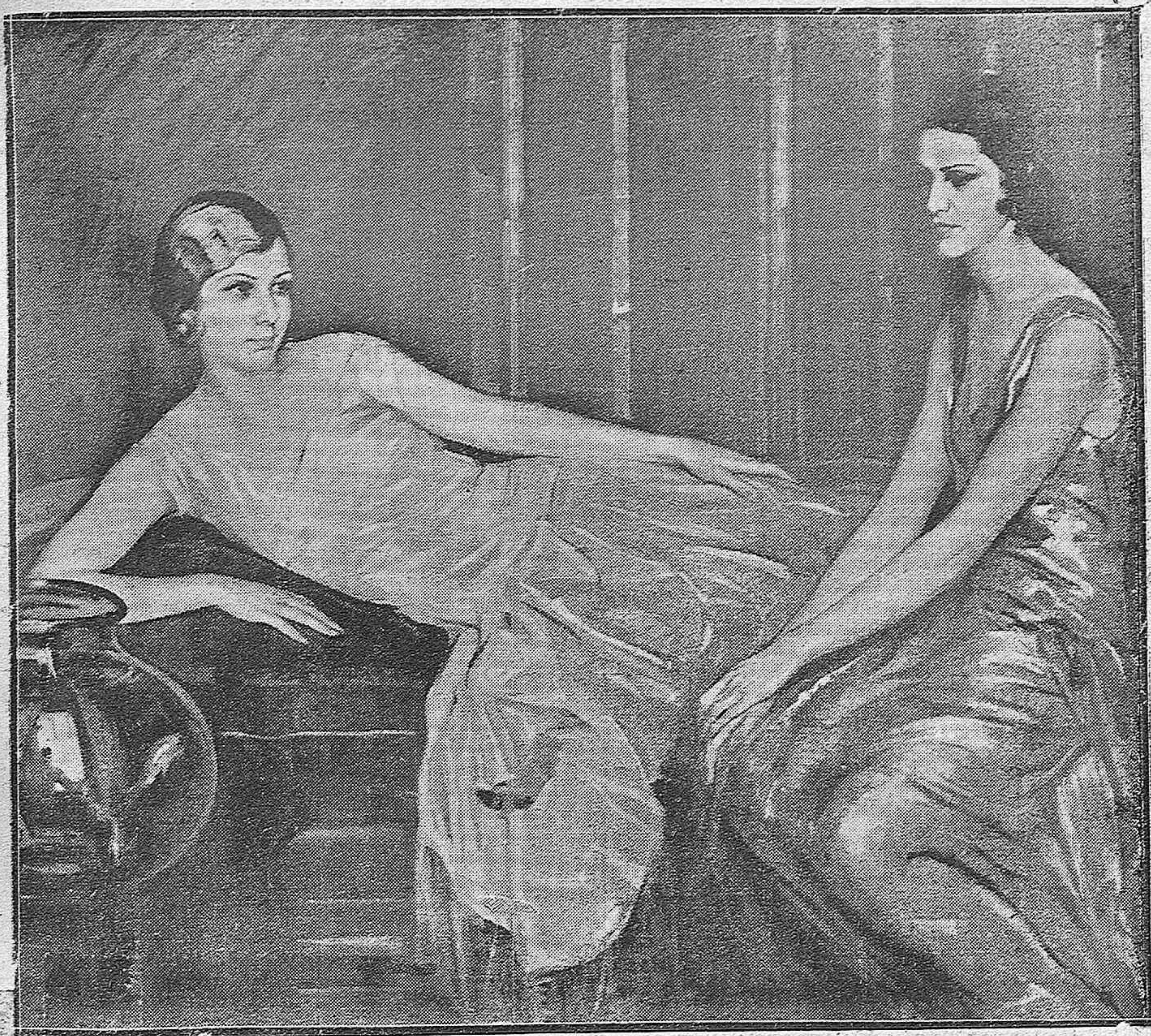
«LUZ Y ELENA», BELLÍSIMO LIENZO DE LEÓN ASTRUC, PREMIADO CON TERCERA MEDALLA EN LA EXPOSICIÓN NACIONAL DE BELLAS ARTES.