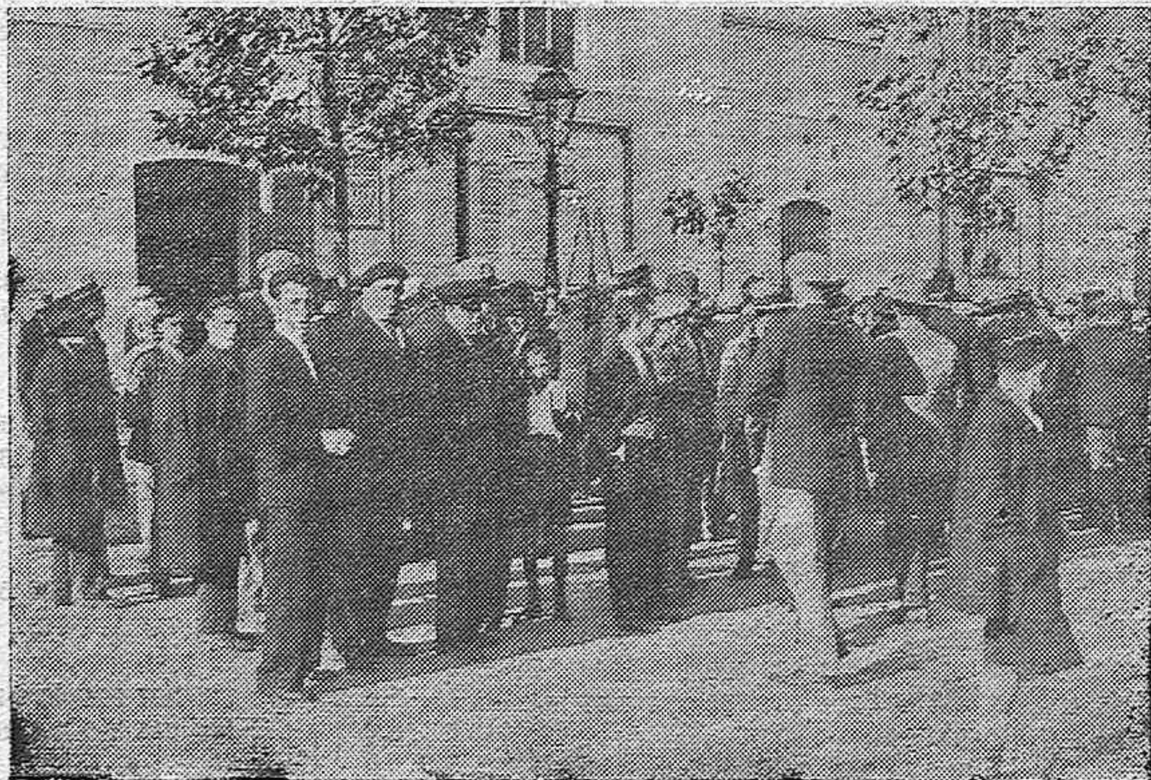
EN LA AVENIDA DEL GRAN CAPITAN.—El público estacionado ante las pizarras de LA VOZ leyendo el resultado del sorteo de Navidad, que no ha sido nada halagador para los cordobeses.