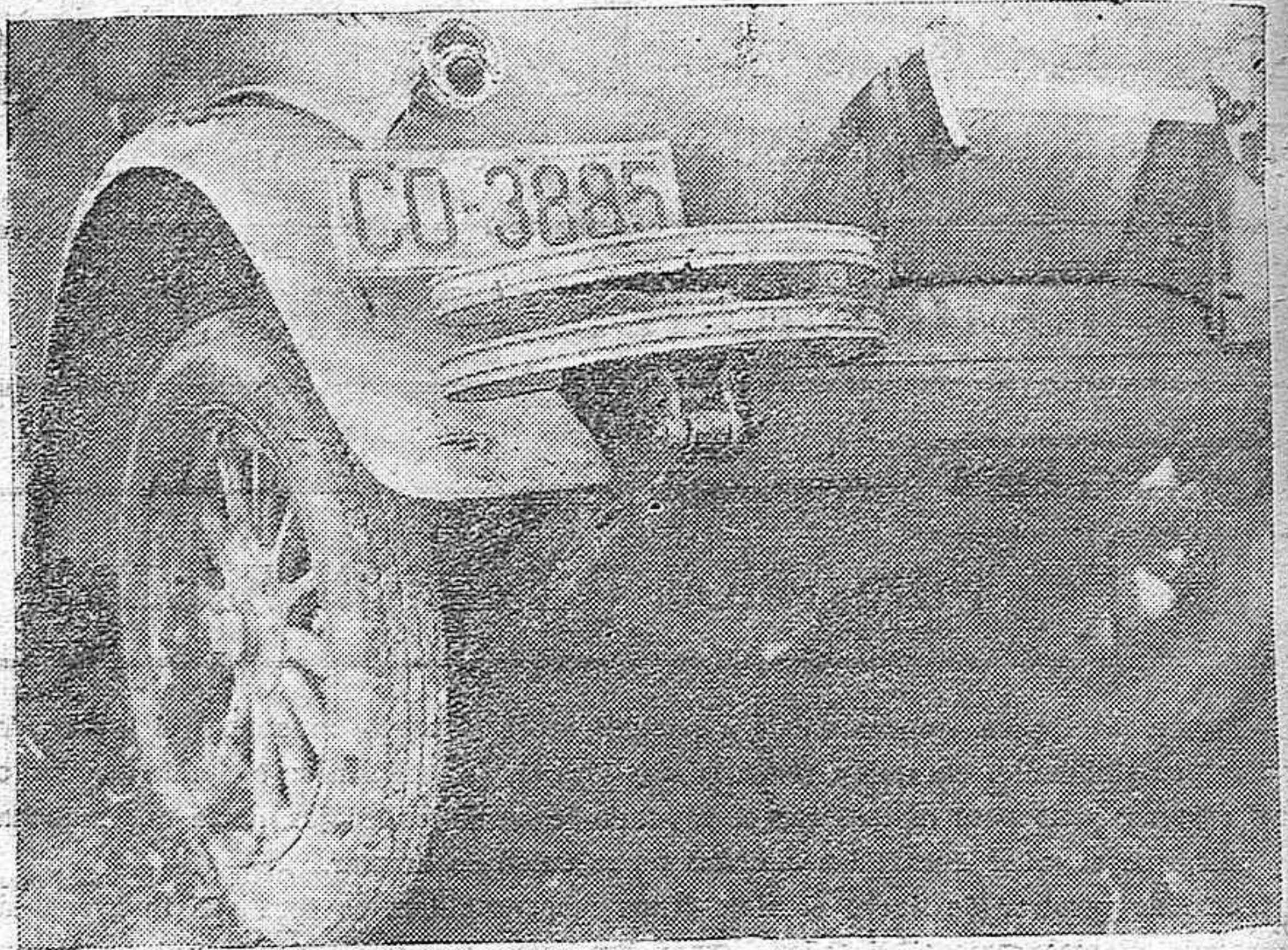
DEL ROBO AL SEÑOR CARRETO.—Los desperfectos ocasionados en el accidente al automóvil que robaron los malhechores.

Se vende uno de 4. H. P. en inmejorables condiciones de precio y en perfecto estado de conservación y funcionamiento.—Razón en esta Administración.