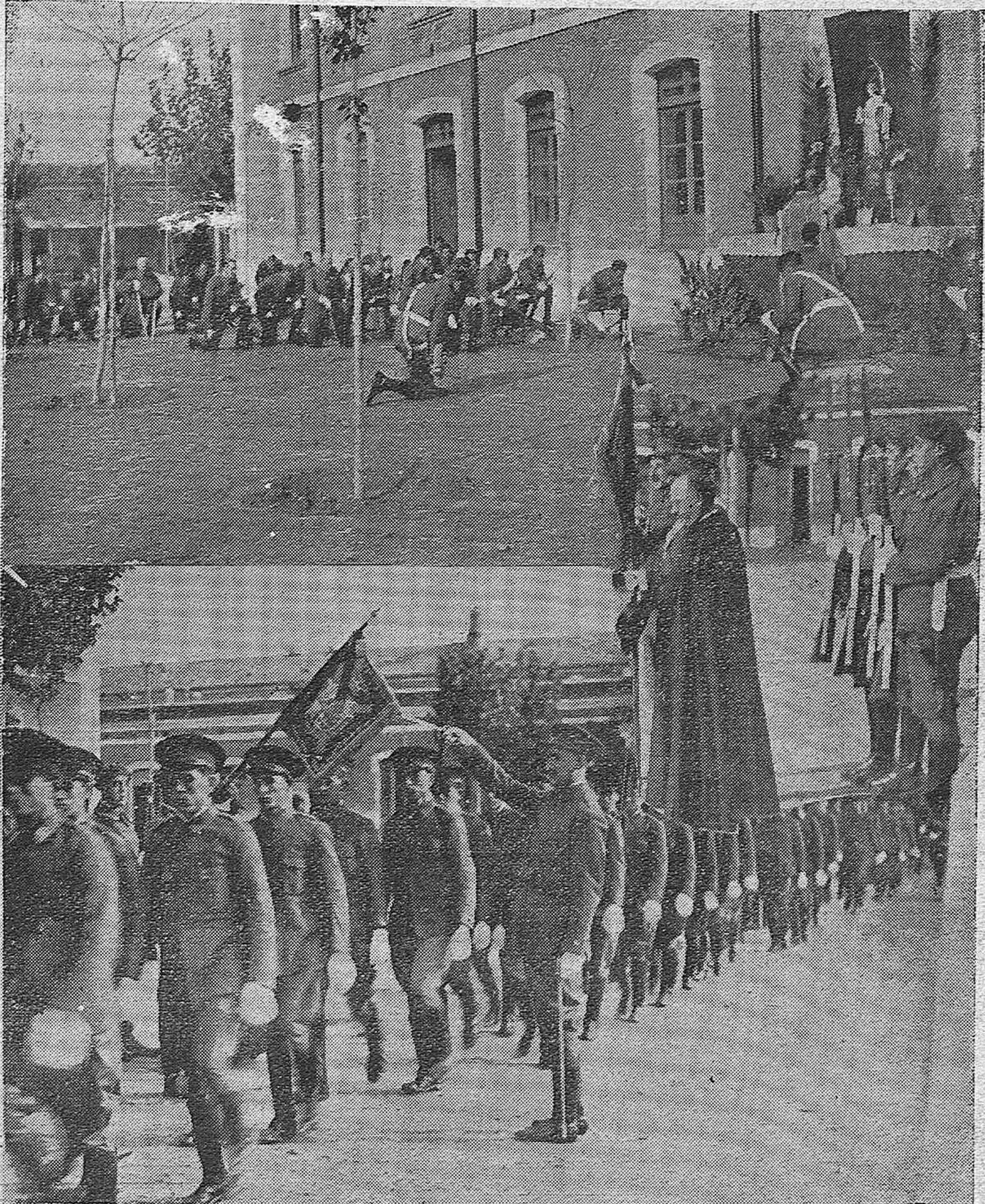
EN EL CUARTEL DE SAN RAFAEL.—Varios momentos de la jura de la bandera, celebrada el pasado domingo