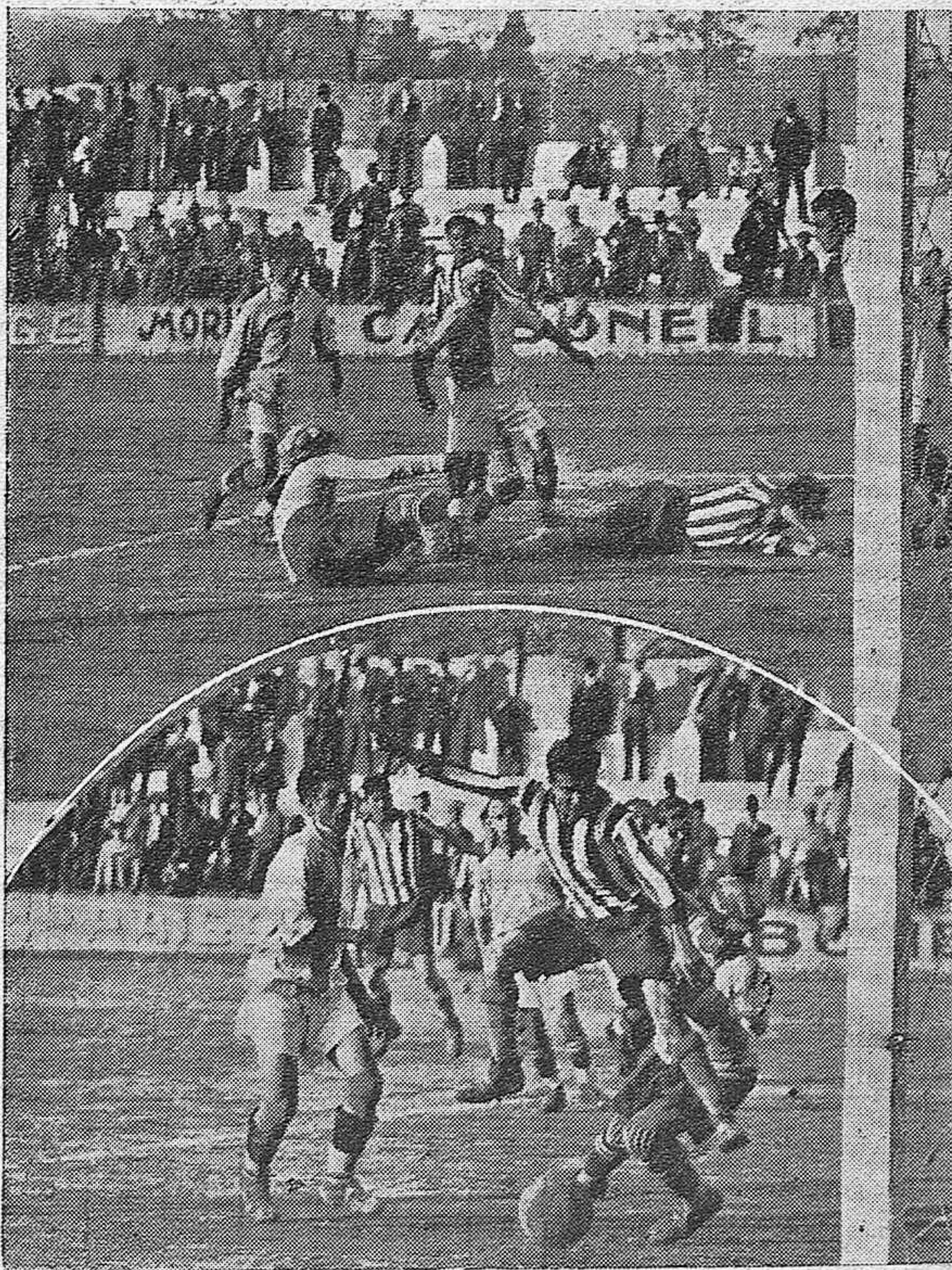
El impetu del Racing.—Dos momentos de peligro ante la meta del Titán de Huelva.

Otro ataque de los forasteros origina un corner contra los locales. La pelota revolotea largo rato ante la meta de Bueno y