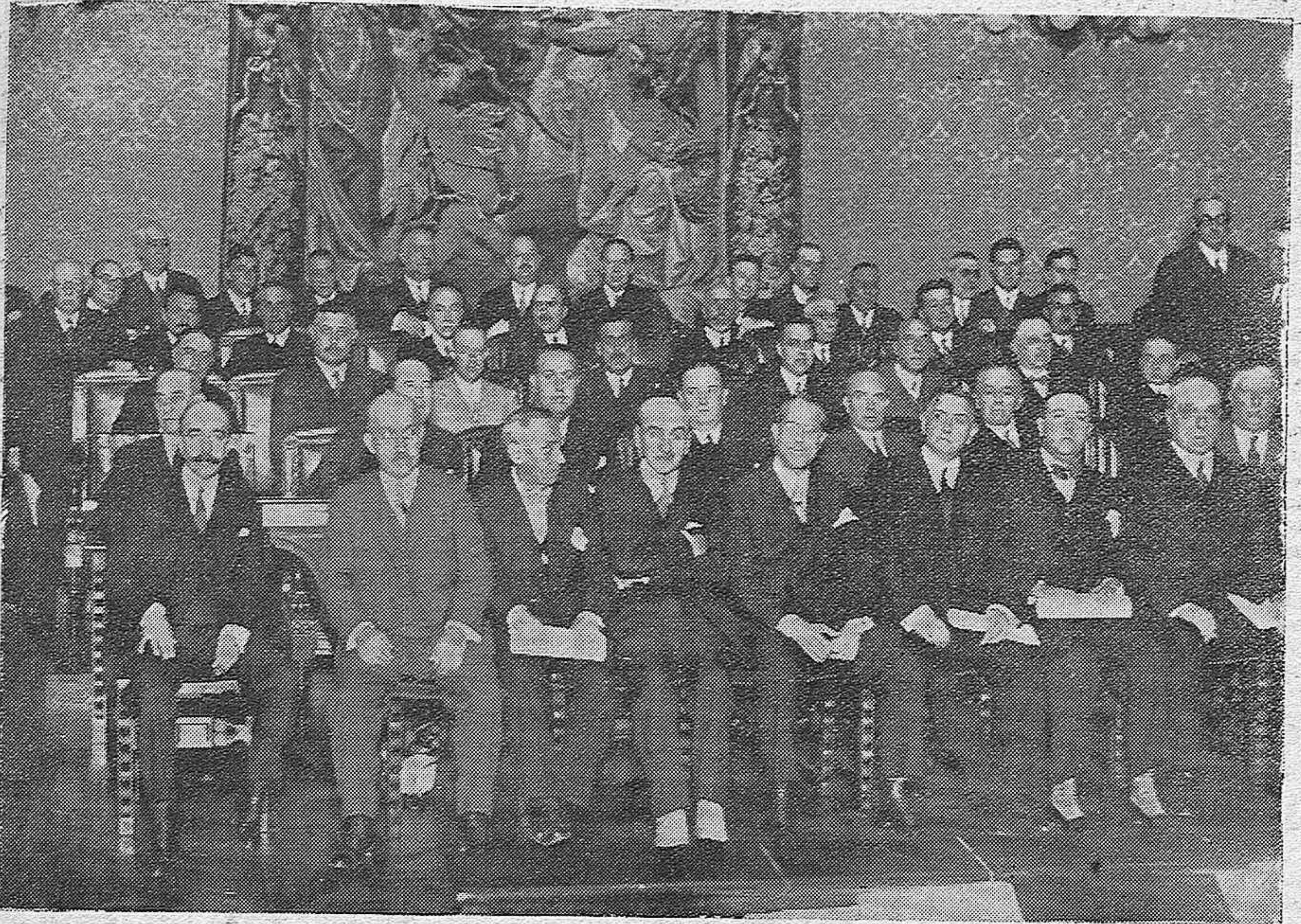
MADRID.—Asambléa de Diputaciones provinciales. Grupo de asambleístas con el Presidente de la Diputación Madrileña