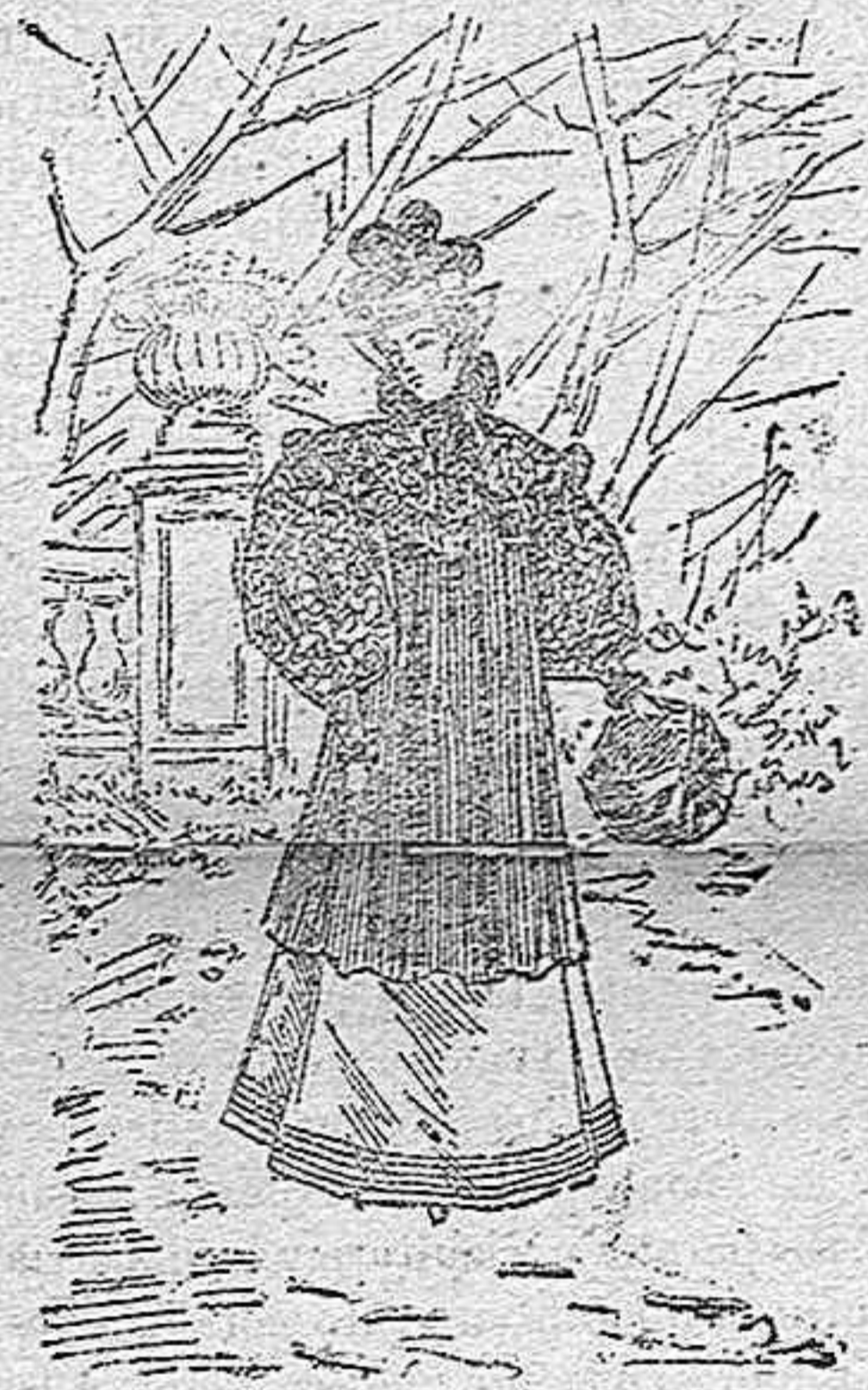
Cuerpo de abrigo largo.

Sin ser en absoluto un abrigo puede servir de tal la pelerina de que da idea el figurín. Se hace de piel de castor, y se dejan largos los paños, que caen naturalmente hasta dos palmos por encima del pie. El cuello es alto y ovalado tal como en el modelo se indica, y el forro de raso negro.