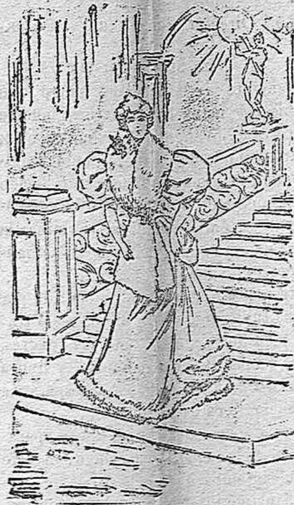
Salida de teatro.

Modelos exclusivos para nuestras lectoras, de los grandes almacenes de «El Siglo», Barcelona.