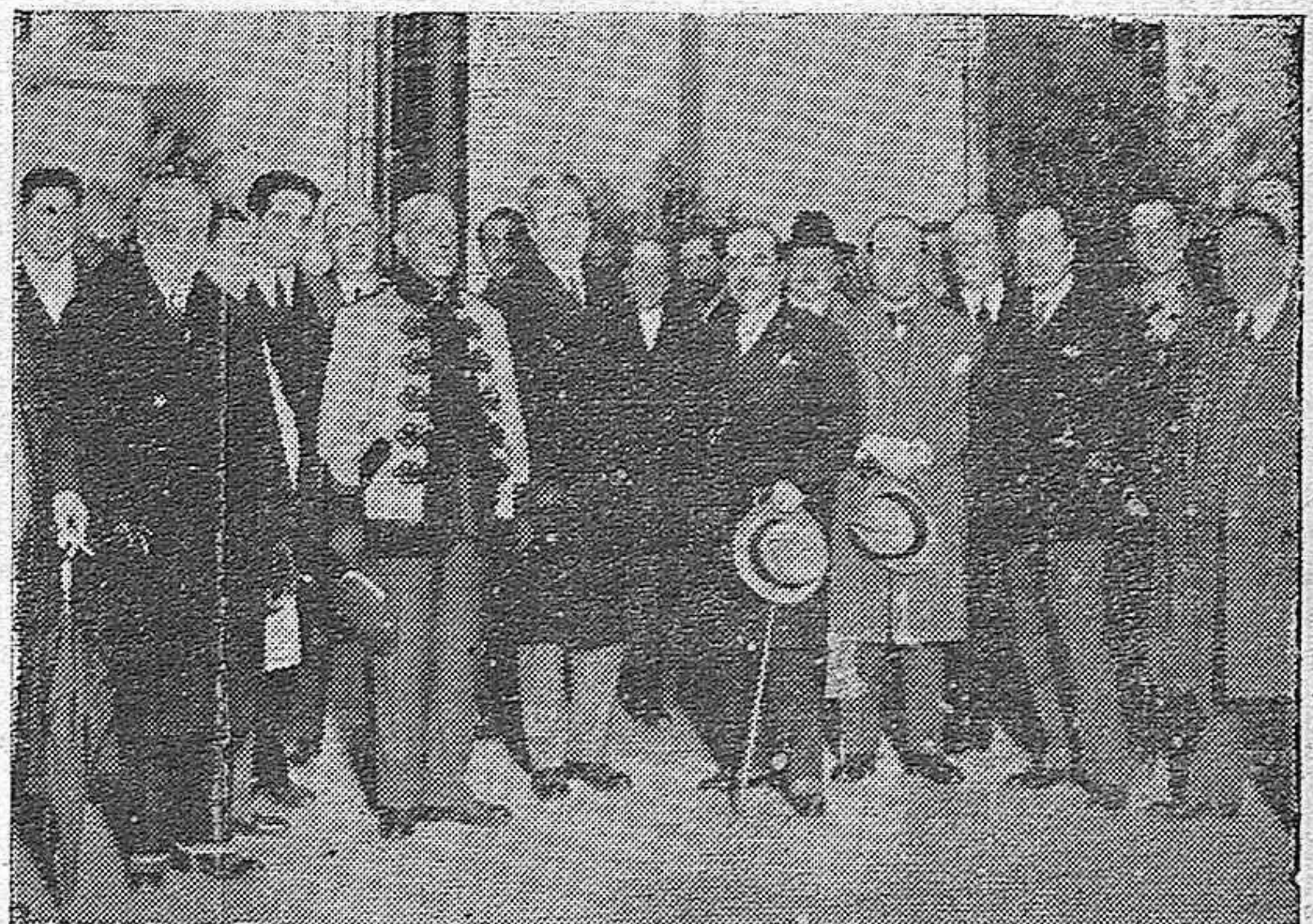
Autoridades y concurrentes a la inauguración del Dispensario Antituberculoso y nueva Casa de Socorro.

012 033 035 101 107 123 138 159 183 195 204 299 417 504 506 521 530 540 584 636 638 656 672 706 743 753 780 813 829 866 902 905 911 937 943 987 994