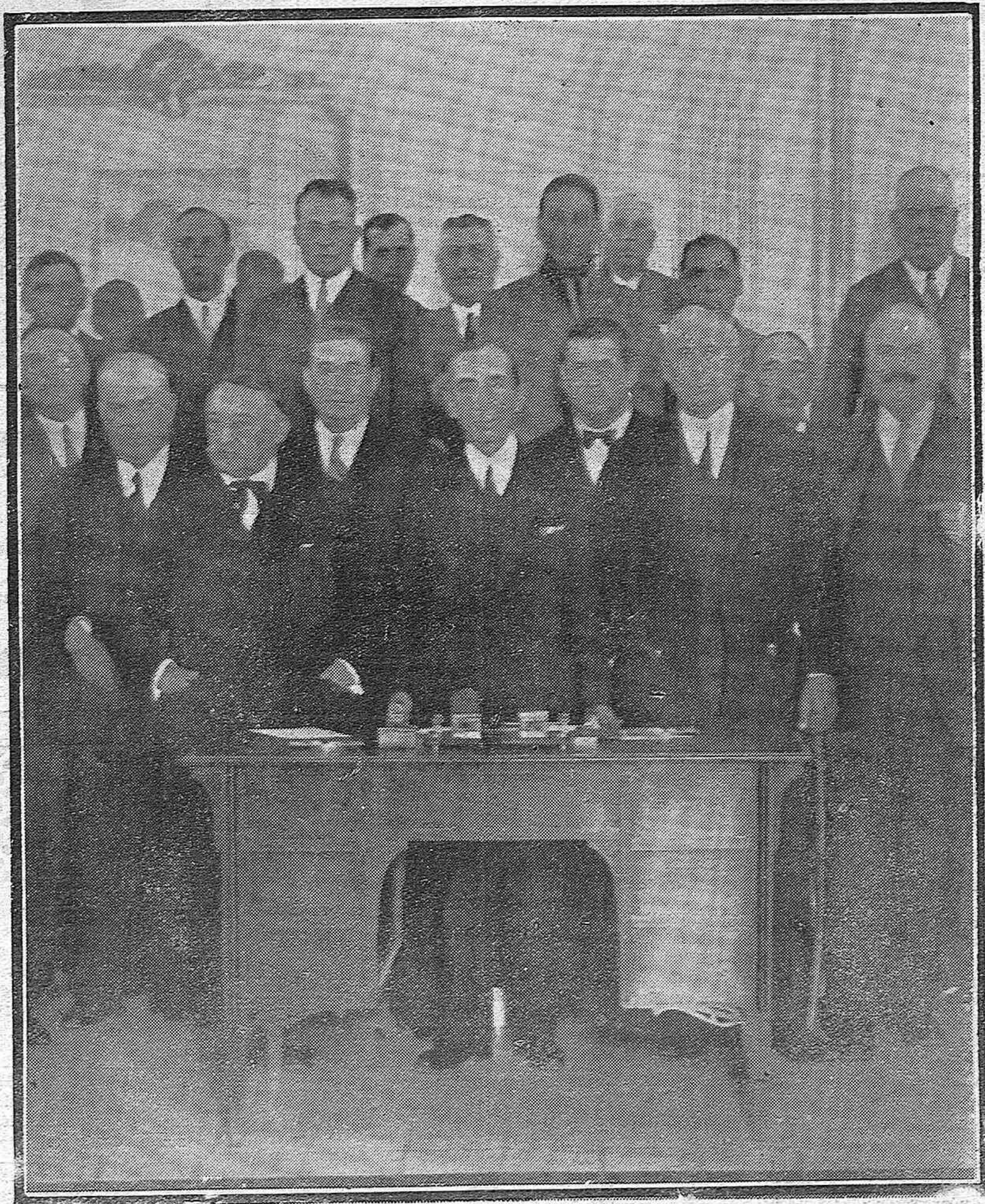
CORDOBA.—Presidencia de la importante asamblea celebrada esta mañana por los agricultores de toda la provincia.