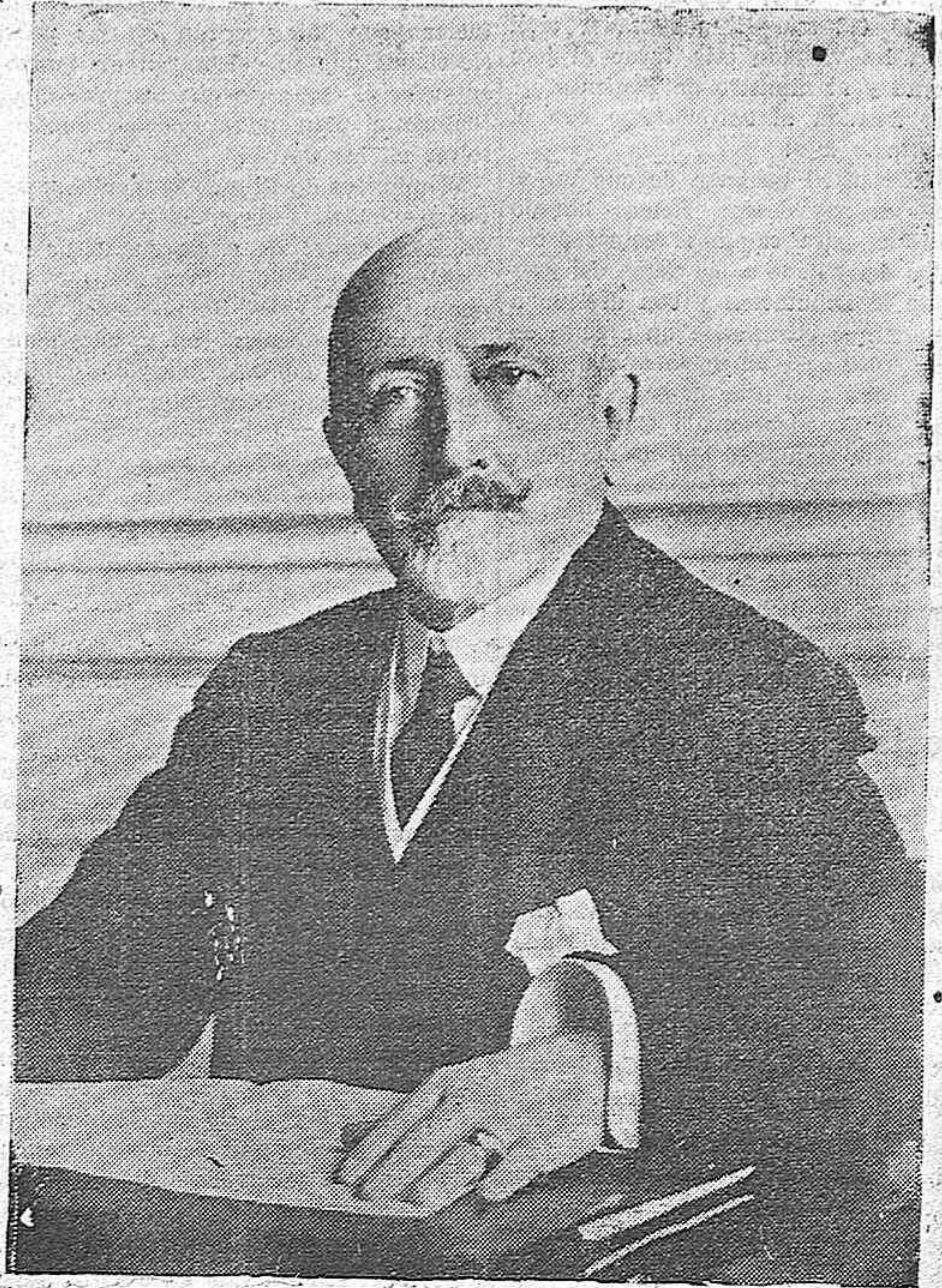
El marqués de Cabra, ilustre personalidad financiera fallecida ayer en Madrid.

Bucarest, 11 (3.30 m.).—El ministro de Instrucción pública ha dirigido una circular a todas las Universidades invitando a los rectores a eliminar de las aulas a todos los agitadores. La circular dice que el Gobierno tomará medidas energéticas a fin de evitar cualquier manifestación susceptible de perturbar el orden. El ministro de Cultos ha dirigido a los metropolitanos y obispos una circular diciendo que ciertos sacerdotes forman parte de Sociedades que protegen la violencia contra cierta categoría de ciudadanos, y que no tolerará en modo alguno la existencia de estas Sociedades.