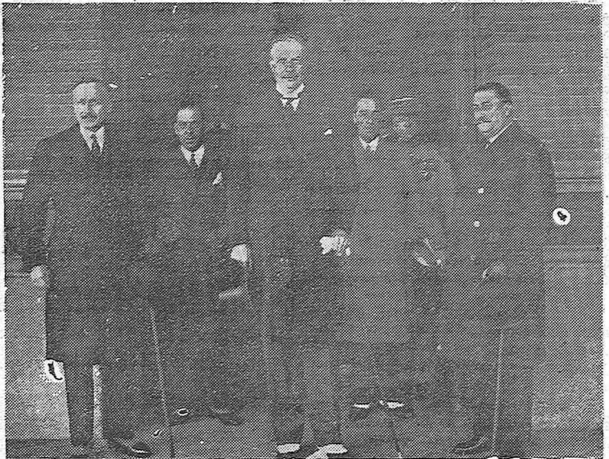
EL MINISTRO DE LA GUERRA FRANCÉS EN MADRID.—MR. MAGINOT A SU LLEGADA A LA ESTACION DE ATOCHA, ES RECIBIDO POR EL EMBAJADOR FRANCÉS, EL JEFE DEL GOBIERNO GENERAL BERENGUER, Y EL MINISTRO DE ESTADO DUQUE DE