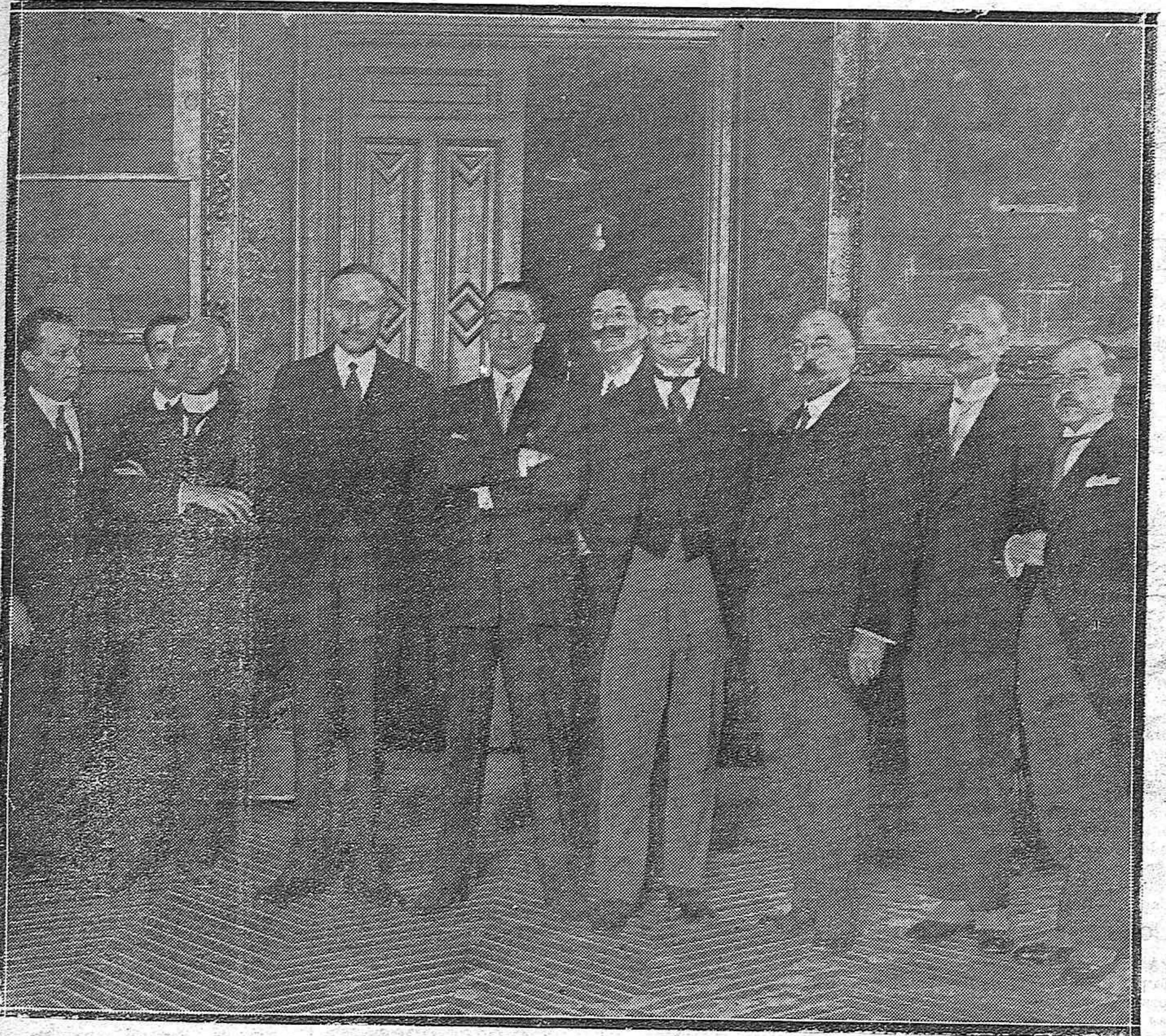
MADRID.—EL MINISTRO DE ESTADO CON EL EMBAJADOR FRANCÉS Y DELEGADOS FRANCESES Y ESPAÑOLES, QUE LLEGARON ESTA MAÑANA PARA TOMAR ACUERDOS COMERCIALES ENTRE AMBAS NACIONES