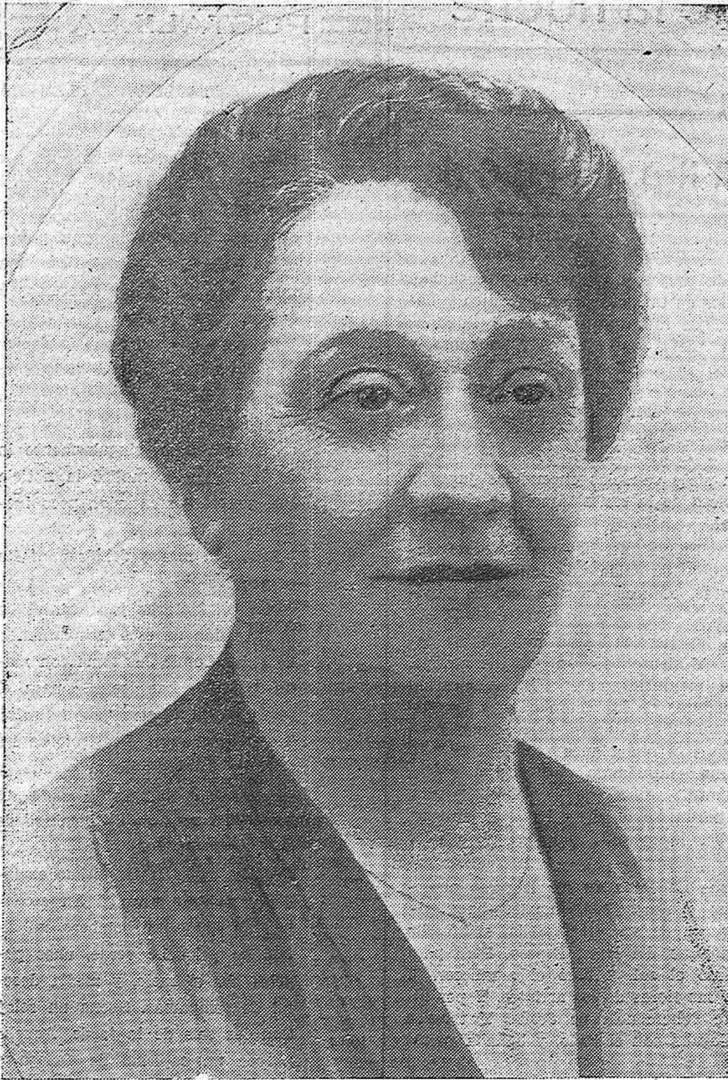
IRENE ALBA, LA INSIGNE ACTRIZ ESPAÑOLA, QUE CON OTRAS FIGURAS MANTUVO DURANTE CUARENTA AÑOS EL PRESTIGIO DE NUESTRO TEATRO, Y QUE ACABA DE FALLECER EN BARCELONA A CONSECUENCIA DE UNA HEMPLEJÍA