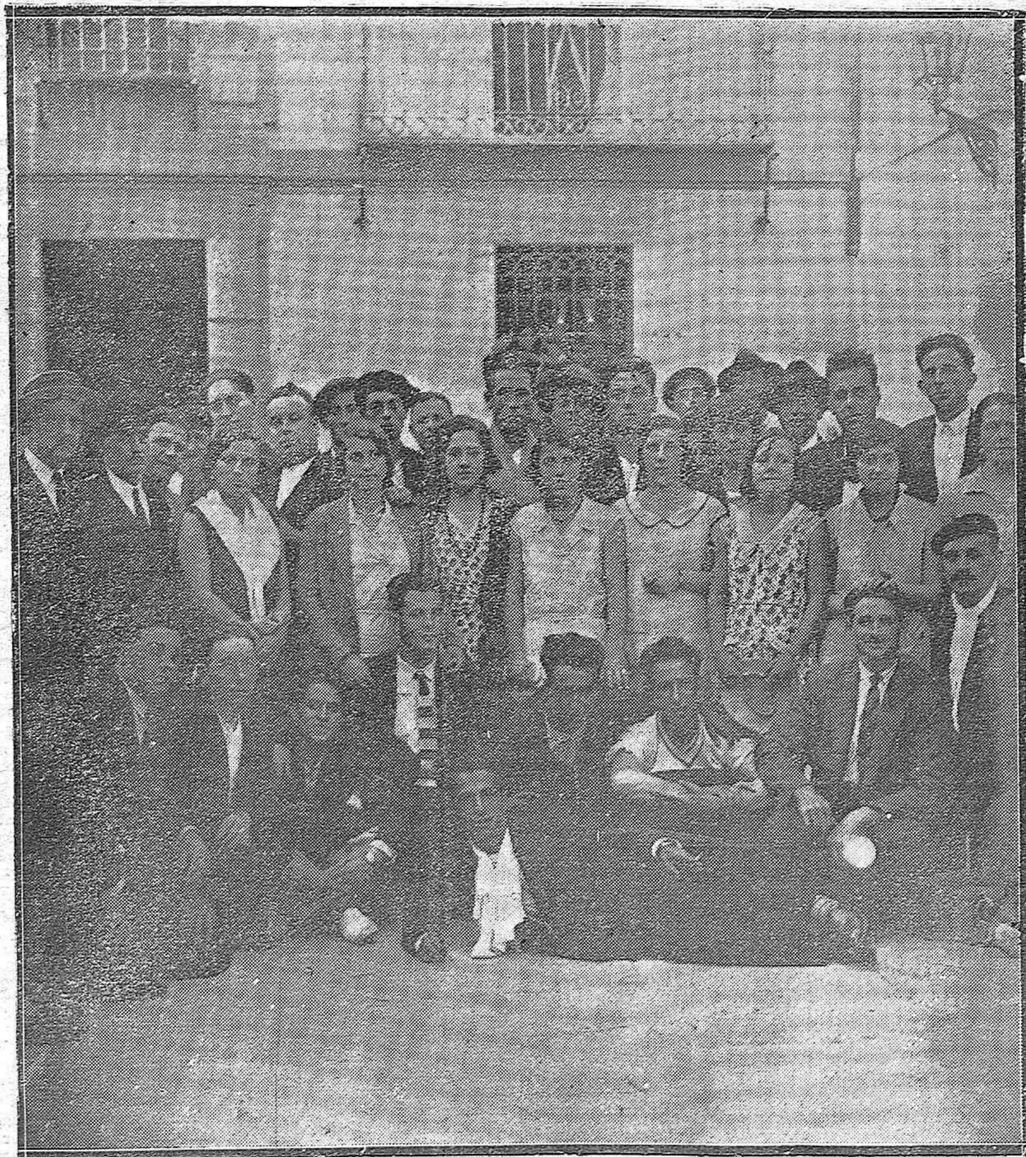
LOS COROS GALLEGOS EN CORDOBA.—LA NOTABLE AGRUPACIÓN QUE LLEGÓ A NUESTRA CAPITAL EN VIAJE ARTÍSTICO Y QUE, DESPUÉS DE ADMIRAR LOS MONUMENTOS, CANTARON EN LA MEZQUITA-CATEDRAL ANTE UN SELECCIÓN AUDITORIO Y REPRESENTANTES DEL CENTRO FILARMÓNICO EDUARDO LUCENA