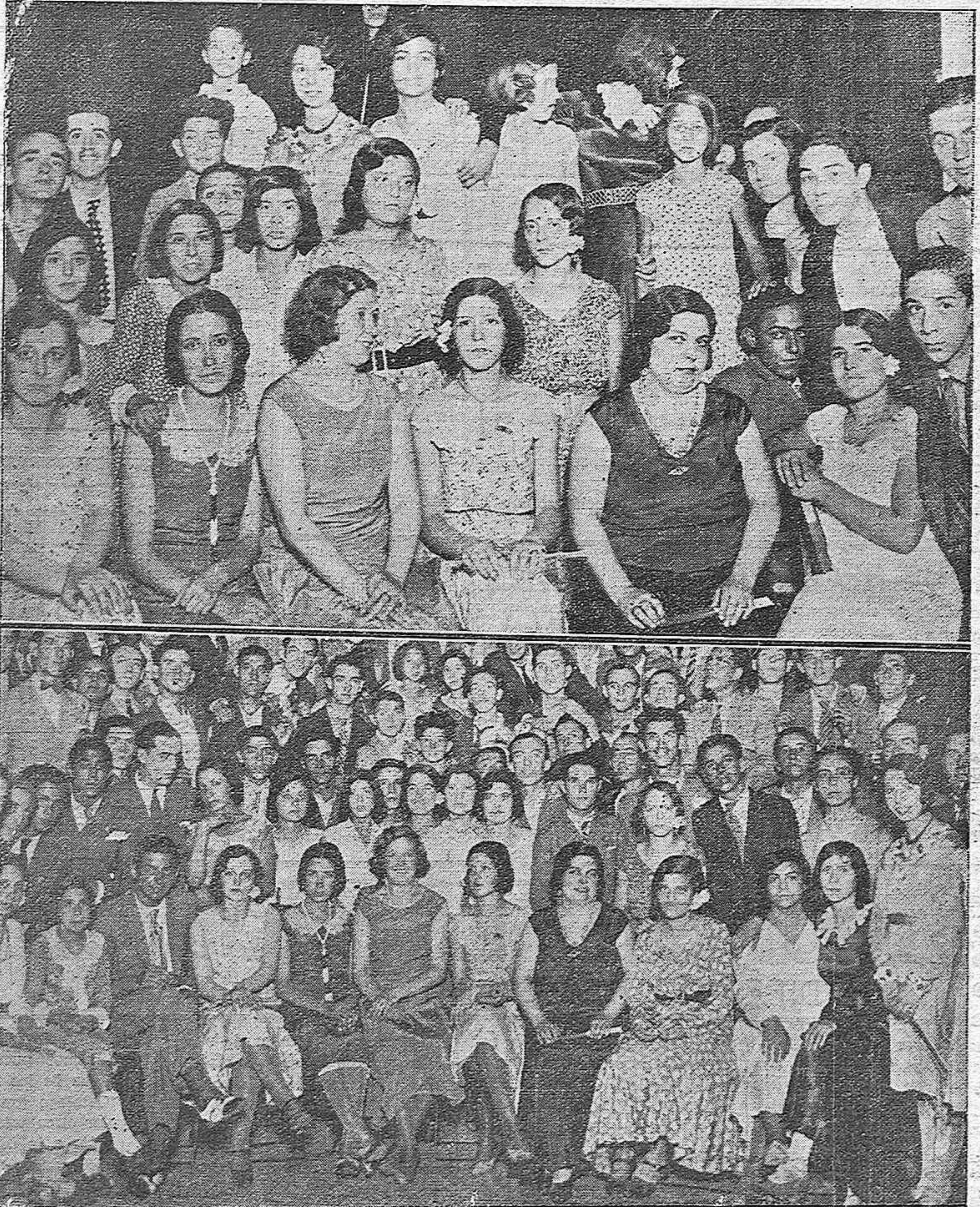
CORDOBA.—Arriba: Bellas cordobesas concurrentes al festival dado por el Centro Filarmónico Eduardo Lucena en honor de las familias de sus socios.—Abajo: Un aspecto del salón de actos del Centro Filarmónico Eduardo Lucena durante la fiesta celebrada en la noche del domingo