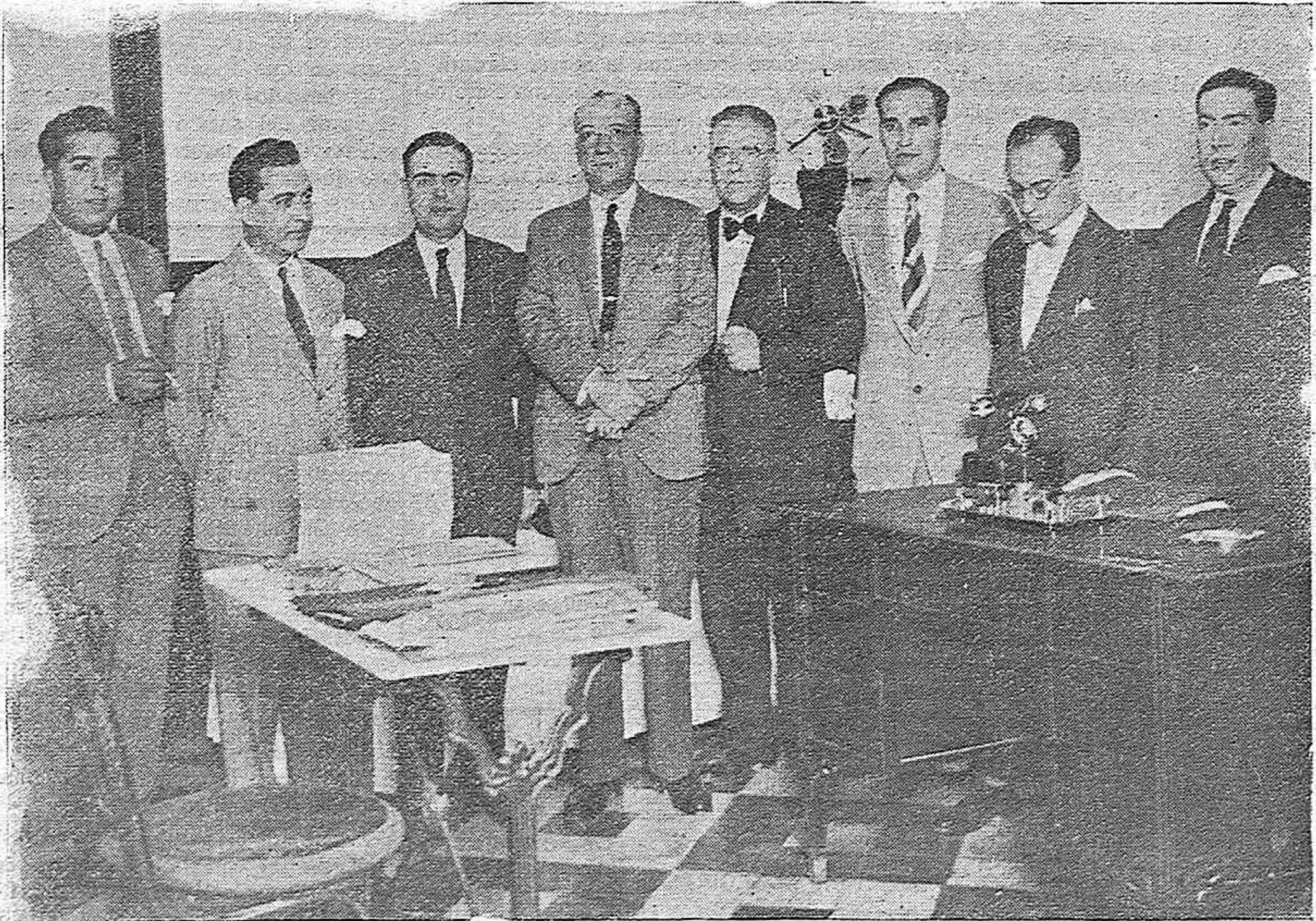
CÓRDOBA.—Presidencia de la importante Asamblea celebrada en el Circulo de Labradores por la Asociación provincial de Empleados de Oficinas Particulares

A las doce del lunes entregó dicho primer teniente alcalde en la alcaldía un escrito, autorizado por los seis concejales de la minoría socialista, en el que no concordaban las numerosísimas e intolerables faltas de ortografía con la redacción y rebuscamientos de palabras y frases del documento; en éste se pedía la sustitución del alcalde por otro socialista. No existiendo disposición alguna legal en que basar tan extraña petición y menos el que se tratara de ella en sesión ordinaria, por cuanto se planteaba un problema político y estas corporaciones son exclusivamente administrativas, el alcalde denegó la adición de la orden del día con este punto (la otra proposición no llegaron a pre-