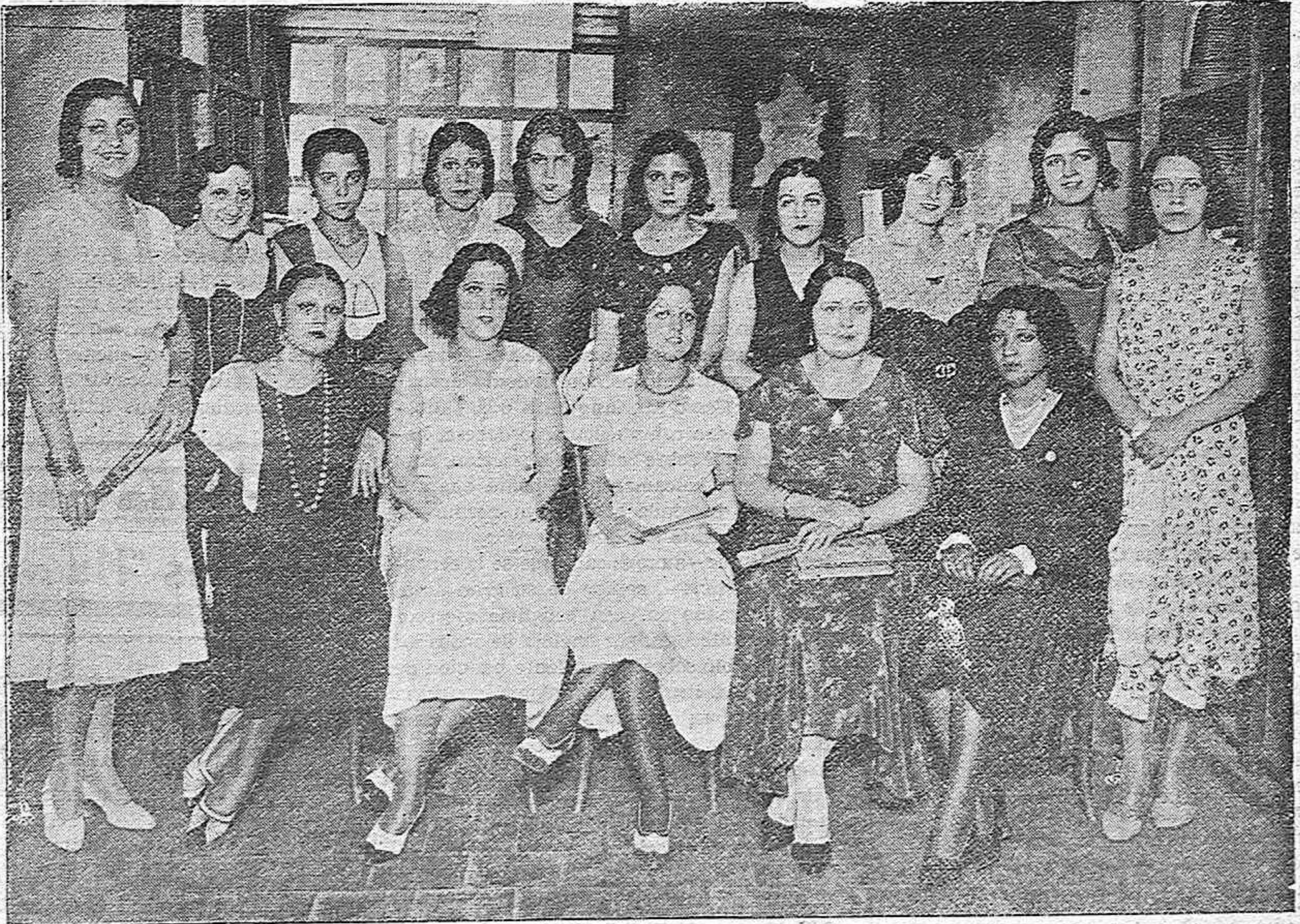
MADRID.—Aspirantes al título de Miss República para 1931, concurso organizado por el Comité femenino del Sindicato de Actores

Añade que si todos los hombres libres hubiesen estado de acuerdo es probable que se hubieran solucionado los problemas. En esta creencia se comenzó la obra revolucionaria, con toda cordialidad, desbrozando abrojos, desterrando dificultades. Pronto desapareció