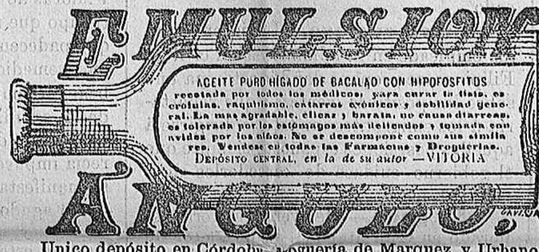
Unico depósito en Córdoba, droguería de Marquez y Urbano.

Desde San Juan próximo se arrienda la cochera, cuadra y pajar, pertenecientes a la casa calle de Pedregosa, número 28.