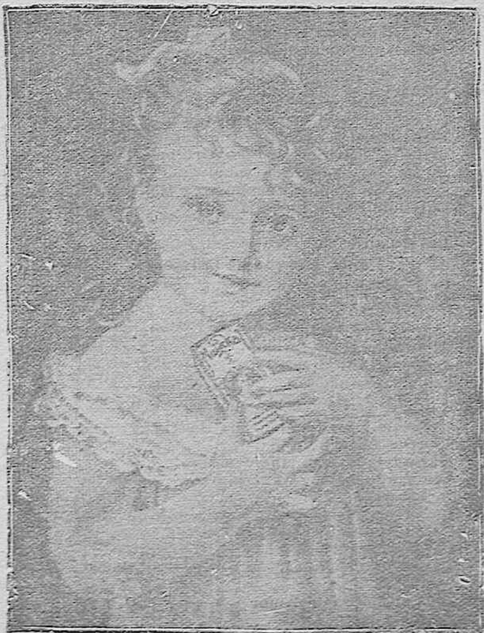
“La niña del Maizkal”