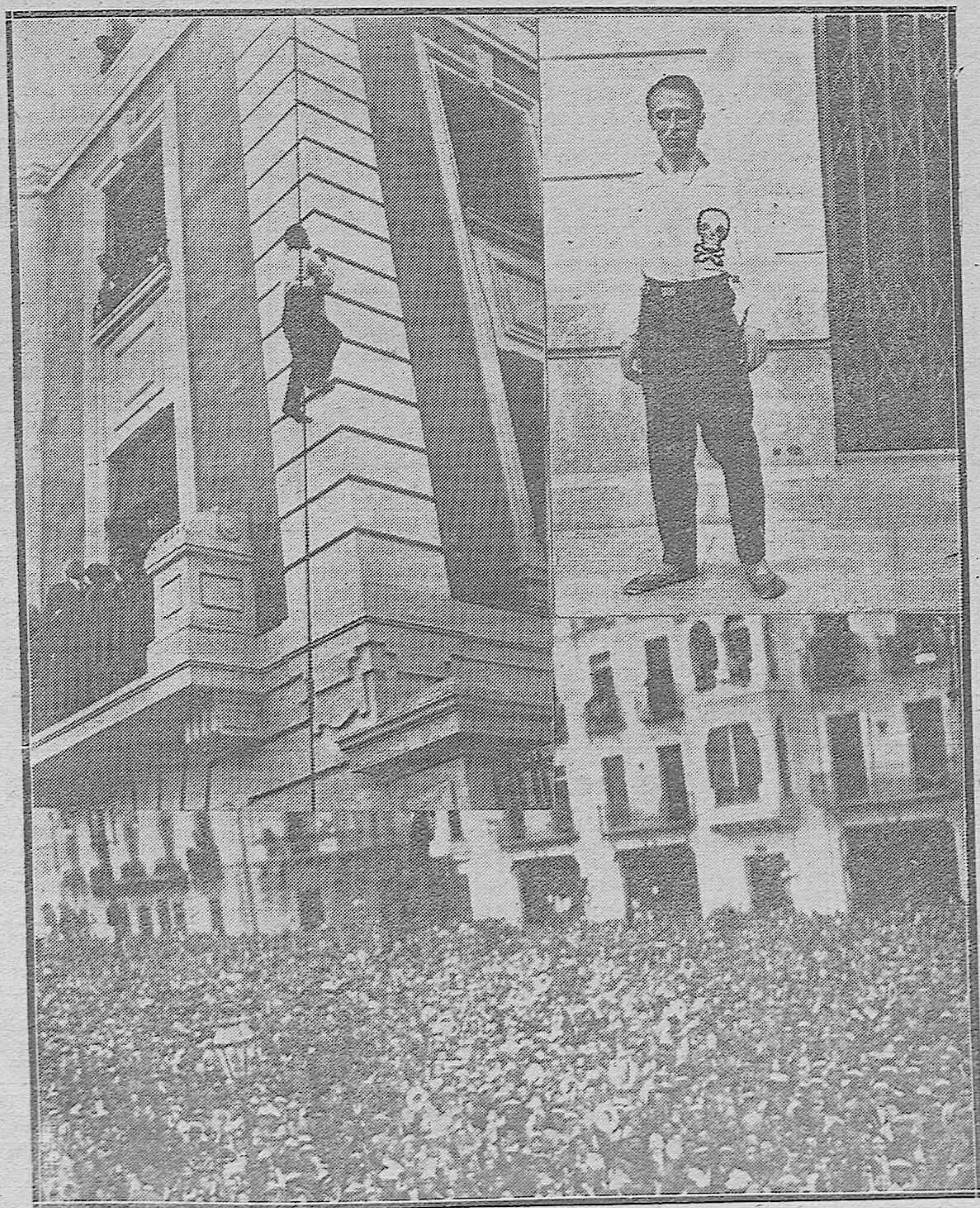
EL HOMBRE MOSCA.—El intrépido artista escalando uno de los edificios de la Avenida del Gran Capitán.—El lusitano Mosca Vaz al disponerse para escalar el edificio.—Imponente aspecto de la Avenida del Gran Capitán durante el emocionante espectáculo.