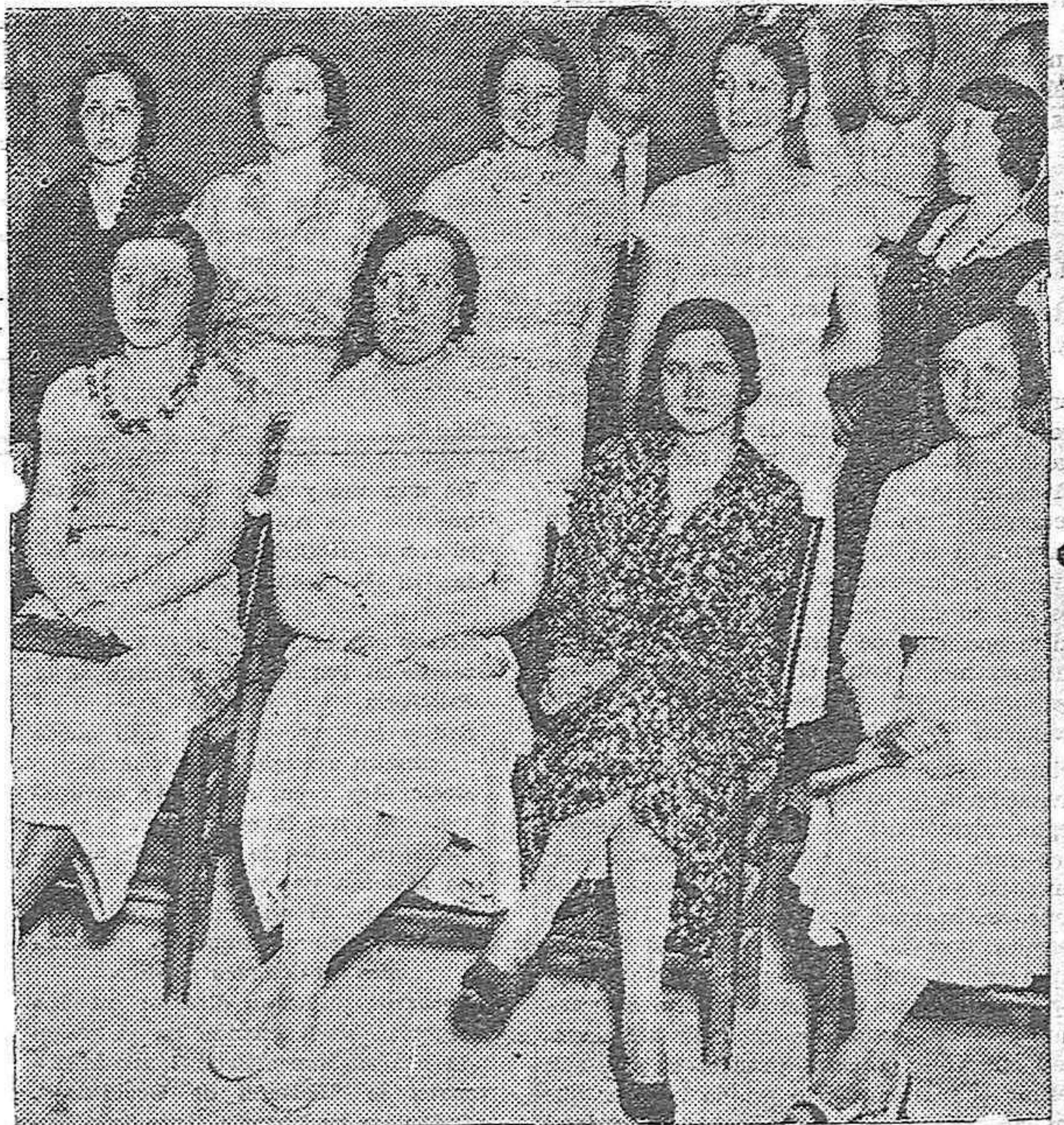
Un grupo de concurrentes a la fiesta organizada por el Tennis Club con motivo de la entrega de premios a los ganadores del campeonato.

A nosotros, ¡plán! No haber sido tan primos.