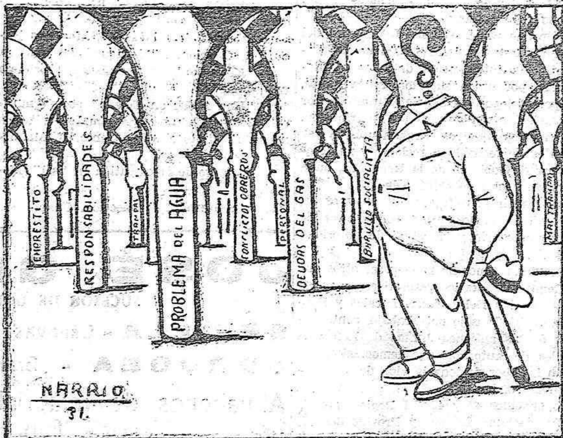
EL FUTURO ALCALDE, SENOR (?).--Con que "indeseable" ¿eh?, pues yo creo que lo indeseable es meterse en este laberinto aunque otra cosa digan los del barullo.