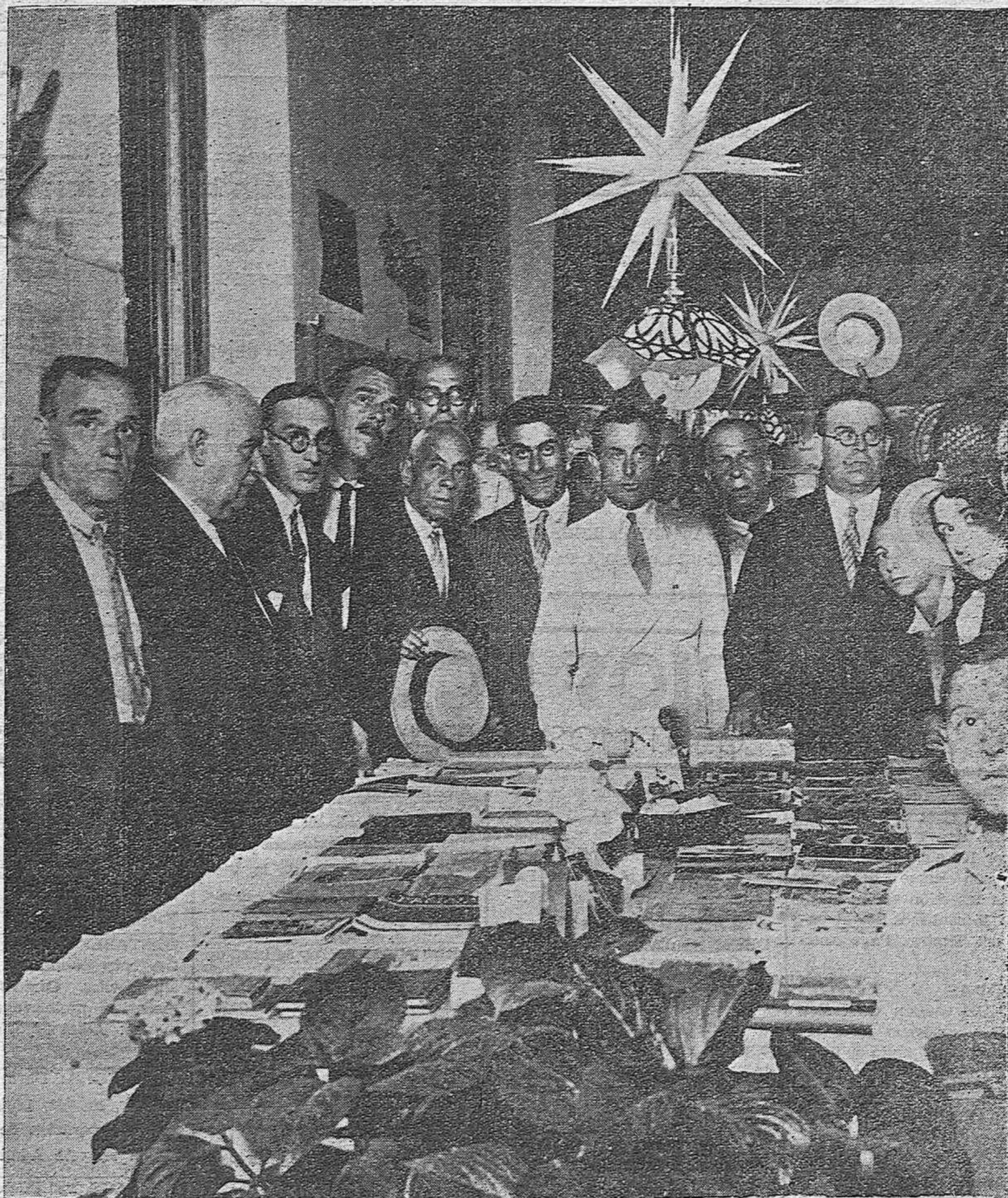
EN LA ESCUELA DE LA CALLE SARAVIA.—Interesante exposición de trabajos escolares de los alumnos normalistas y niños de la graduada aneja, inaugurada anoche.