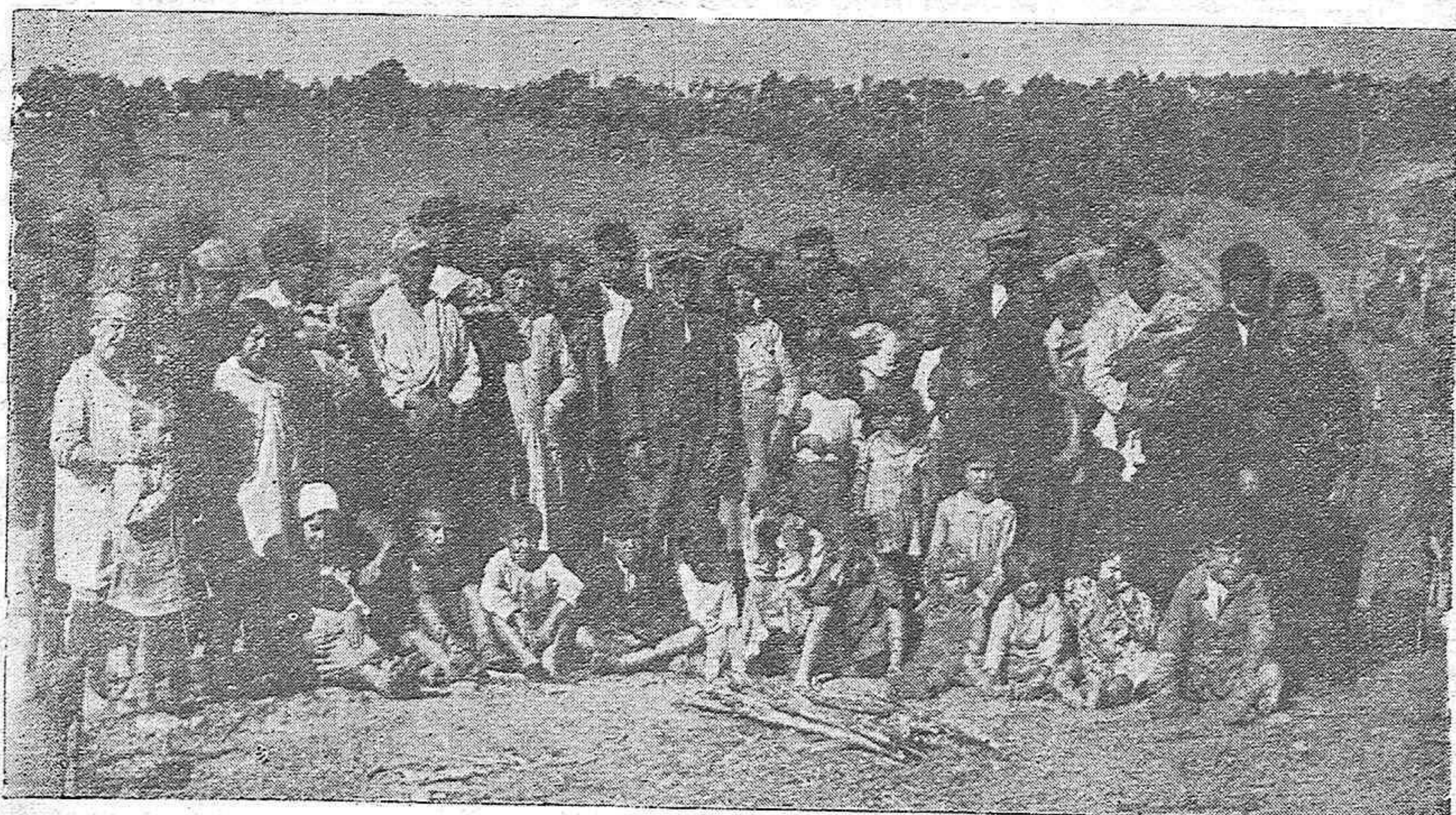
Grupo numeroso de personas que han quedado sin albergue y en la más espantosa miseria, a causa del incendio.