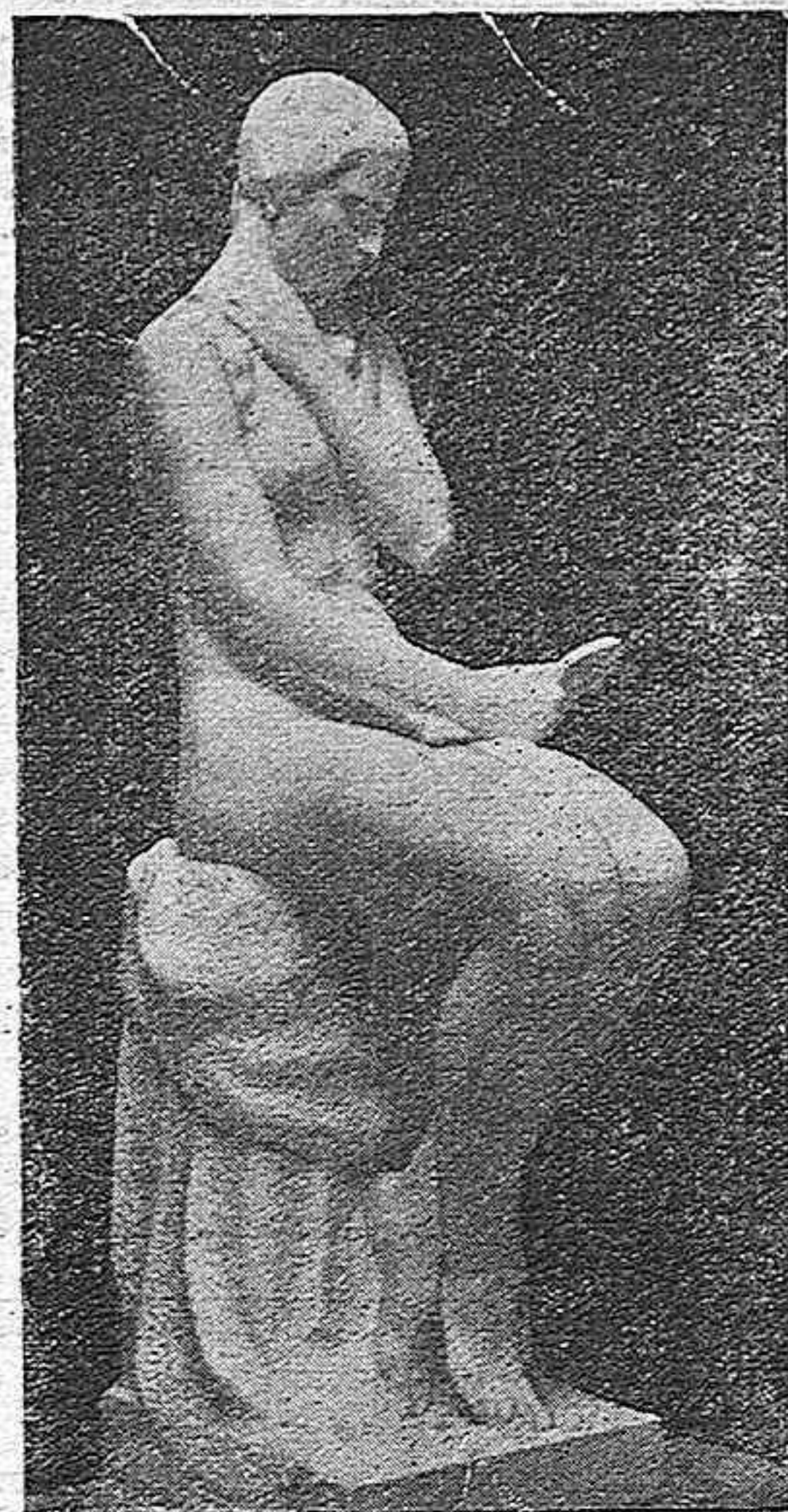
"Coquetería", magnífico desnudo de Mateo Inurria

El desnudo mereció de Inurria singular atención. Ahí están "Pudor", "Coquetería" y "Voluptuosidad" que decoran el vestíbulo del Casino de Madrid. Pero los desnudos femeninos de Inurria constituyen, no ya el ló-