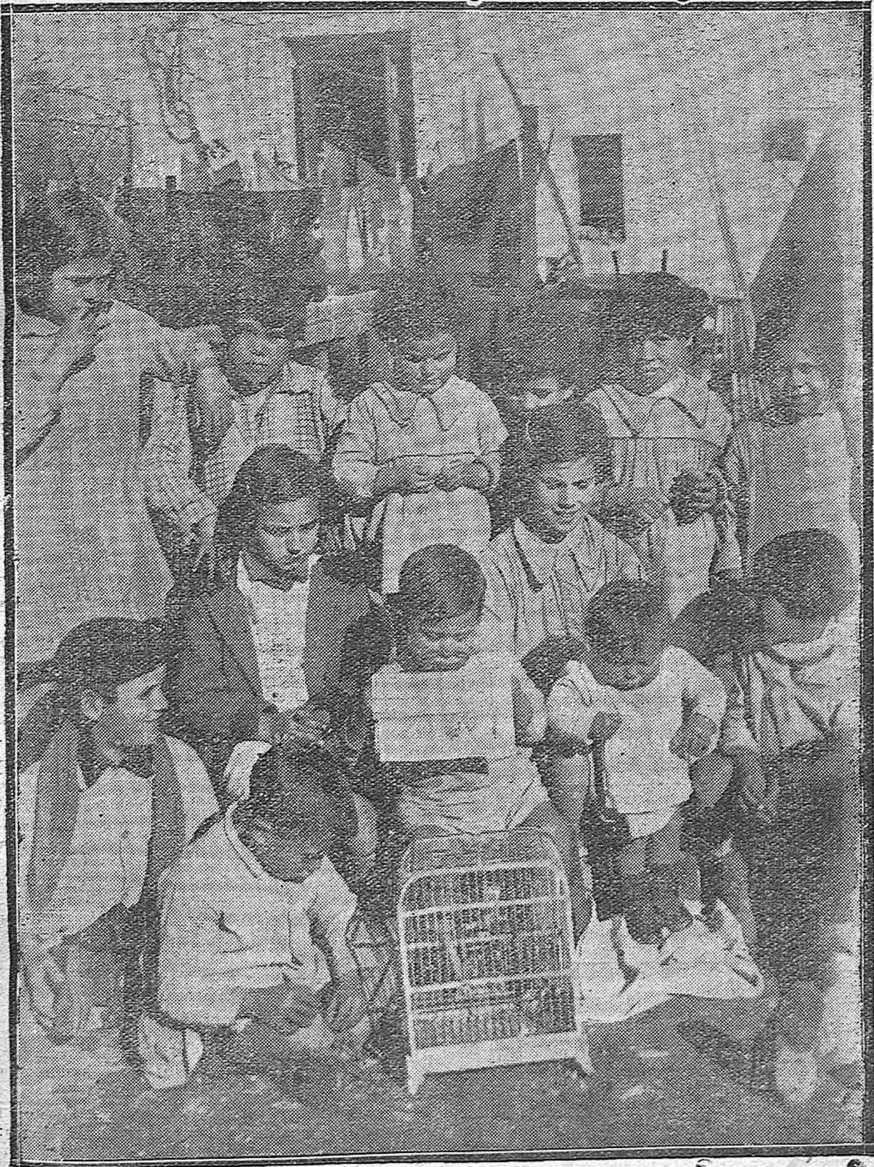
NUESTROS PEQUEÑOS LECTORES.—Un grupo de simpáticos amigos de LA VOZ, enterándose de los sucesos del día.